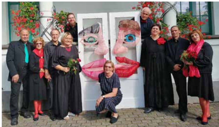
Aktierus un izrādes vienos moto „Skatuve ar un bez rāmja”. IAZ

Augustā eksperimenti vērtēs aizvadītās sezonas izrādes – „Pupas” un „Klusa nakts”, savukārt no 24. līdz 26. septembrim Limbažos pulcēsies amatier-teātru festivāla „Spēlesprieks” dalībnieki.