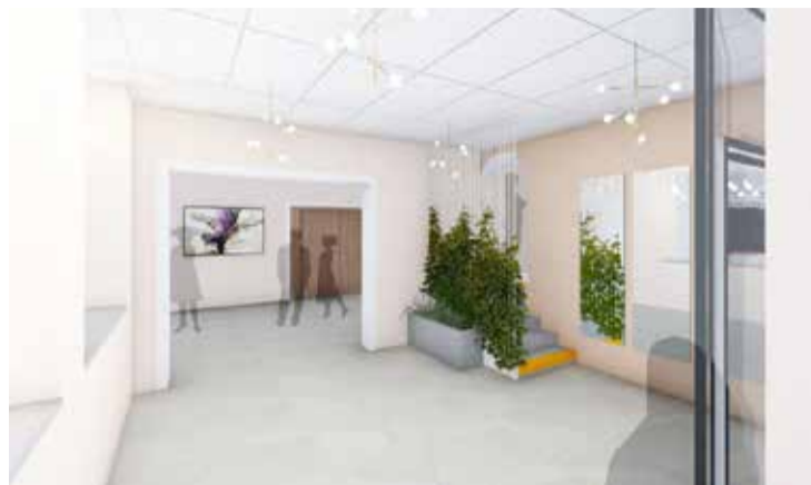
Attēlos: SIA „Arhitektūras dizaina studija” rasējumi.

Projektu paredzēts pabeigt līdz š.g. novembrim. Par būvdarbiem noslēgts līgums