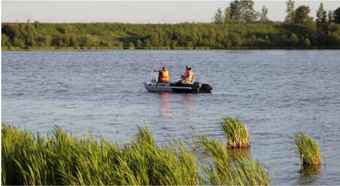
Attēlam ir ilustratīva nozīme.

Atrašanās un pārvietošanās ar laivu ir saistīta ar dažādiem riskiem un lielu bīstamību, jo dažādu apstākļu ietekmē laiva var apgāzties, turklāt šobrīd ūdens temperatūra ir zema, līdz ar to cilvēkam, atrodoties ūdenī, iespējama vispārēja ķermeņa atdzišana. Turklāt ne vienmēr negadījumiem uz ūdens ir aculiecinieki, kuri savlaicīgi var piezvanīt glābšanas dienestiem.