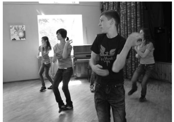
Deju grupa „Impossible”.