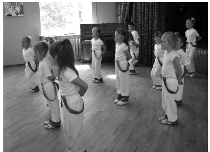
Deju grupa „Virpulis”.