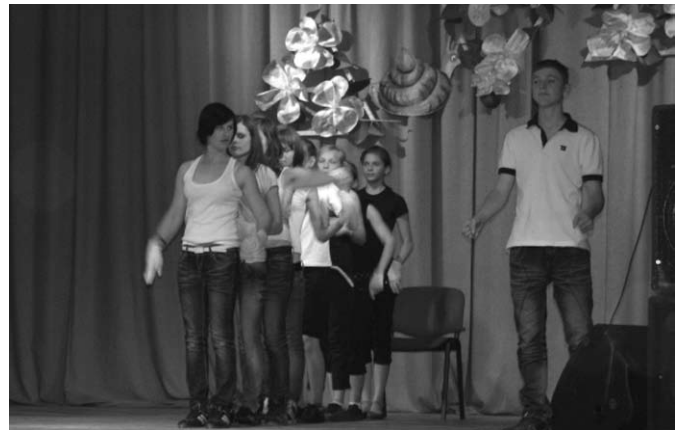
Dejo grupa „Enter Music”.