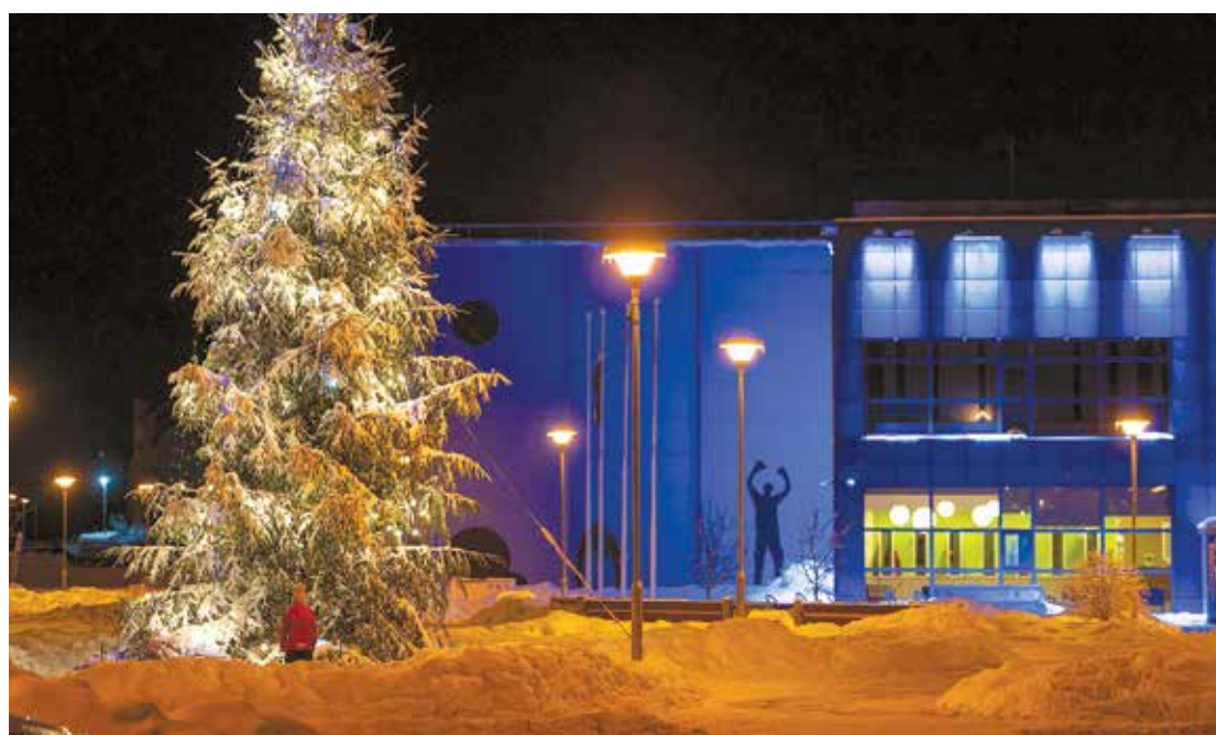
Skaista svētku egle daļo Sporta nama pagalmu.