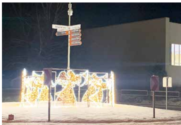
Gaismas ielas aplis svētku rotājumā.

Tuvojoties Ziemassvētkiem un gadumijai, Salaspils ielas un pagalmi iemirdzas spožās svētku gaismās. Eglēs gan pie iestādēm, gan daudzdzīvokļu namu pagalmos deg lampiņu virtenes, radot siltu svētku sajūtu. Līdzās jau ierastajiem svētku rotājumiem šogad mūsu acis priecē arī skaistais Gaismas ielas aplis, kurā spoži spīd labestības un miera simbols – eņģeļi.