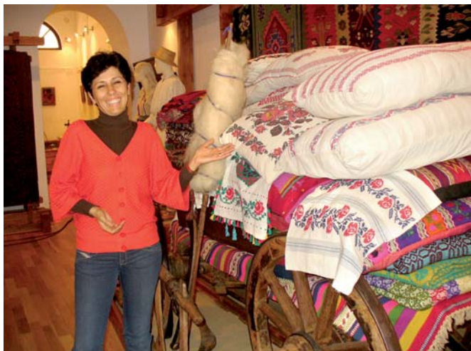
Kraļovas pilsētas Etnogrāfiskā muzeja darbiniece rāda tradicionālo ligavas pūru

tajiem projektiem pilsētas vēsturiskās arhitektūras saglabāšanā, kā arī notiek domu apmaiņa par šī Grundtvig projekta mērķiem, nozīmi un tālāko attīstību.