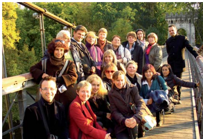
HEFORE projekta partneru tikšanās dalībnieki Kraļovas pilsētas parkā

Rumānija ir zeme ar smagu vēsturi, kurā piedzīvota gan barga diktatūra, gan bads, tāpēc tagad vai ikkatrs grib ātrāk aizmirst visu, kas bijis – tamdēļ katras mazākās biedrības priekšsēdis ir „prezidents”, katras ļaužu kopības līderis – „ģenerāldirektors”.