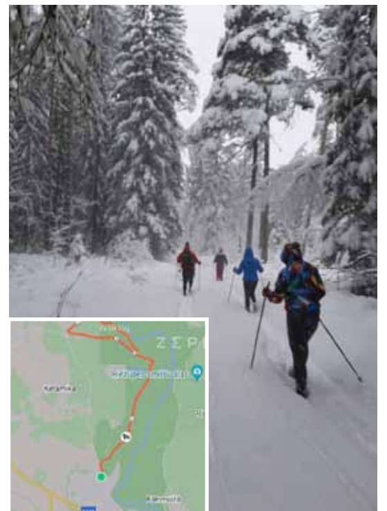
Maršruts veda no zirgaudzētavas gar Lapsu mājām un vēl krietnu likumu pa piesniģušo mežu.