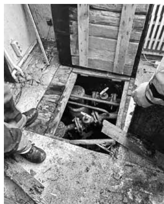
Kuldīgas siltumtīklu darbinieki griež ciet maģistrāles ventilus, meklējot noplūdes rajonus.

Alberts Dinters Kuldīgas siltumtīklu arhīva foto