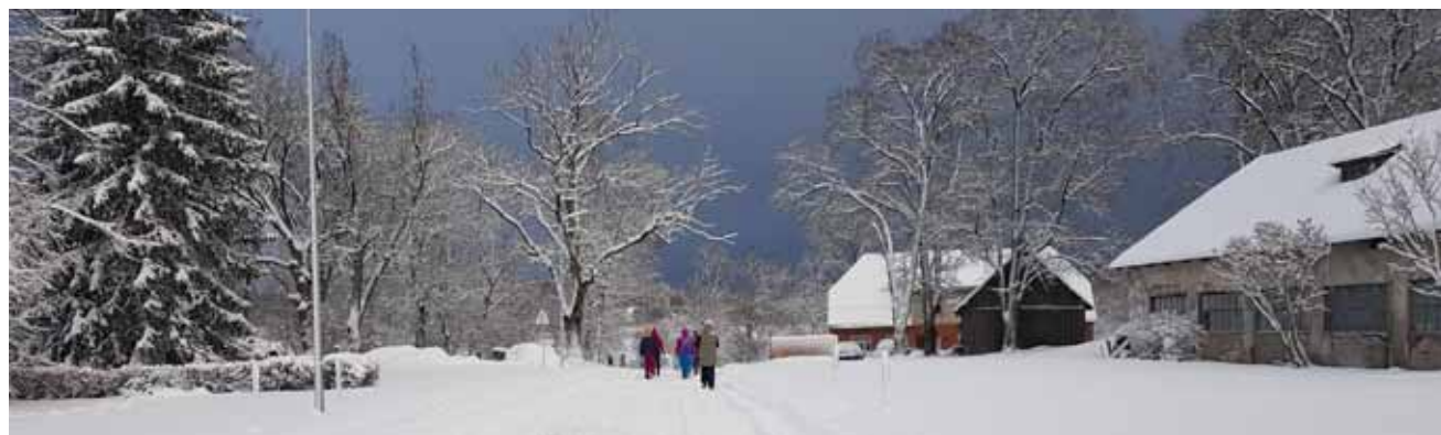
25. decembrī bija gada noslēguma nodarbība – daudz garāka un citā maršrutā. Noiet aptuveni 12 kilometri. Tā kā sniegš bija nesen uzsnidzis un tā bija daudz, paredzēto divu stundu vietā bija vajadzīgas trīs.