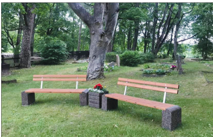
Centra kapos netālu no baznīcas novietoti divi parka soliņi un puķu pods.