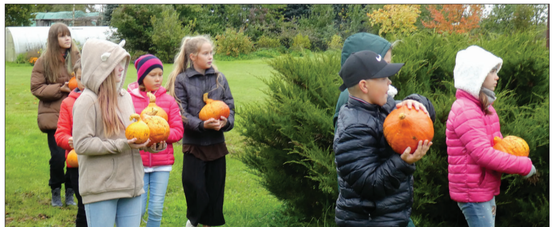
Mazpulcēni un ansamblis "Dzeguzīte" dziedātāji novāca ķirbjus.

Ikviens jauna pieredze sniedz interesantus mirkļus. To varam teikt arī par pēcpusdienu, kuru pavadījām kopā ar televīzijas filmēšanas grupu un ansambli "Dzeguzīte" dalībniekiem.