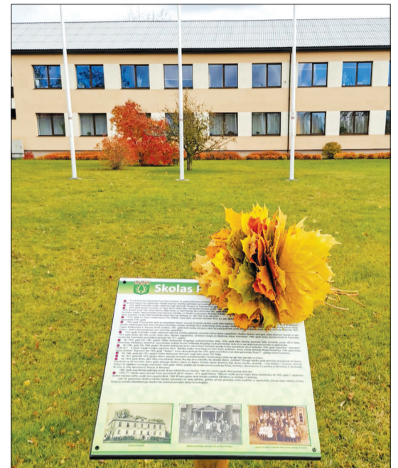
Viens no stendiem uzstādīts Puzes pamatskolas apkārtnē.

Šī gada projekts bija "Mazie soliņi Puzes pagasta vēsturisko vietu sakopšanā, vēstures materiālu apkopšanā un digitalizācijā". Pavasarī tika lemts spert vēl dažus soļus Puzes pagasta vēsturisko vietu sakopšanā un piedalīties Ventspils novada pašvaldības rīkotajā projektu konkursā "Mēs savā novadā 2021", kurā saņēmām 800 eiro. Šī projekta soļi vairs nebija plānoti tik vērienīgi kā iepriekšējos četros gados paveiktais, bet nozīmīgi vēstures saglabāšanā gan. Tā tapa pieci A3 baneri – Puzes pilskalnā, Aķu kraujā, pie Puzes ezera, Puzes augstākajā vietā Grūzciemā un pie Puzenieku skolas –, divi A2 baneri par skolām un muižām, pusmuižām un citām ievērojamām ēkām Puzes pagastā un viens lielais baneris par Puzes pagastā esošajiem dabas objektiem, lai jebkurš ceļotājs zinātu, ka atrodas kādā no Puzes pagasta vēsturiskām vietām.