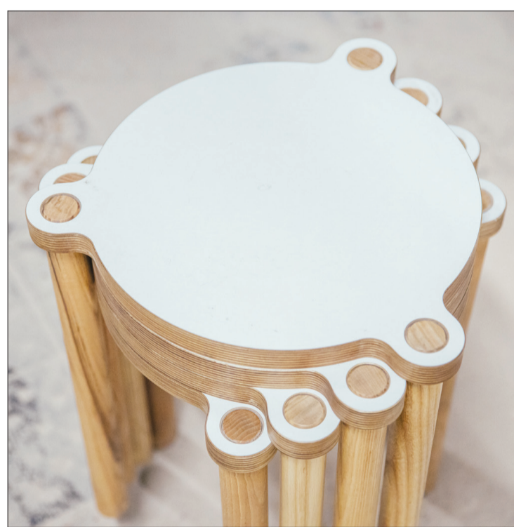
Klienti visbiežāk pasūta saplākšņu galdus, bet pieprasīti ir arī šādi ķebliši.