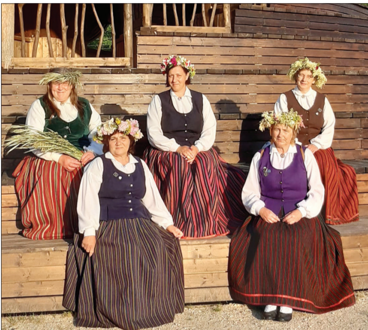
"Pūnikas" dziedātājas Jūrkalnē vasaras saulgriežos, 21. jūnijā.

"Tā būs mana līgaviņa!" Ar tādiem vārdiem šogad 25. septembrī folkloras kopa "Pūnika" nobeidza savu uzstāšanos skatē, kuras tēma bija veltīta jaunu ļaužu sapazīšanās spēlei, kas ietver visu no saskatīšanās līdz derību brīdim. Tāda neparasta mums tā skate Covid-19 apstākļos.