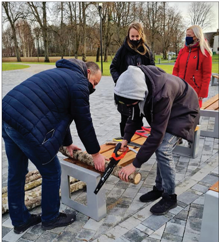
Zlākās vajadzēja nozāgēt tieši kilogramu pagališu.

20. novembrī ikviens interesents varēja iesaistīties autopiedzīvojumā "No Usmas līdz Jūrkalnei", ceļā pavadot vismaz trīs stundas un apmeklējot kontrolpunktus, kuros bija jāveic dažādi uzdevumi.