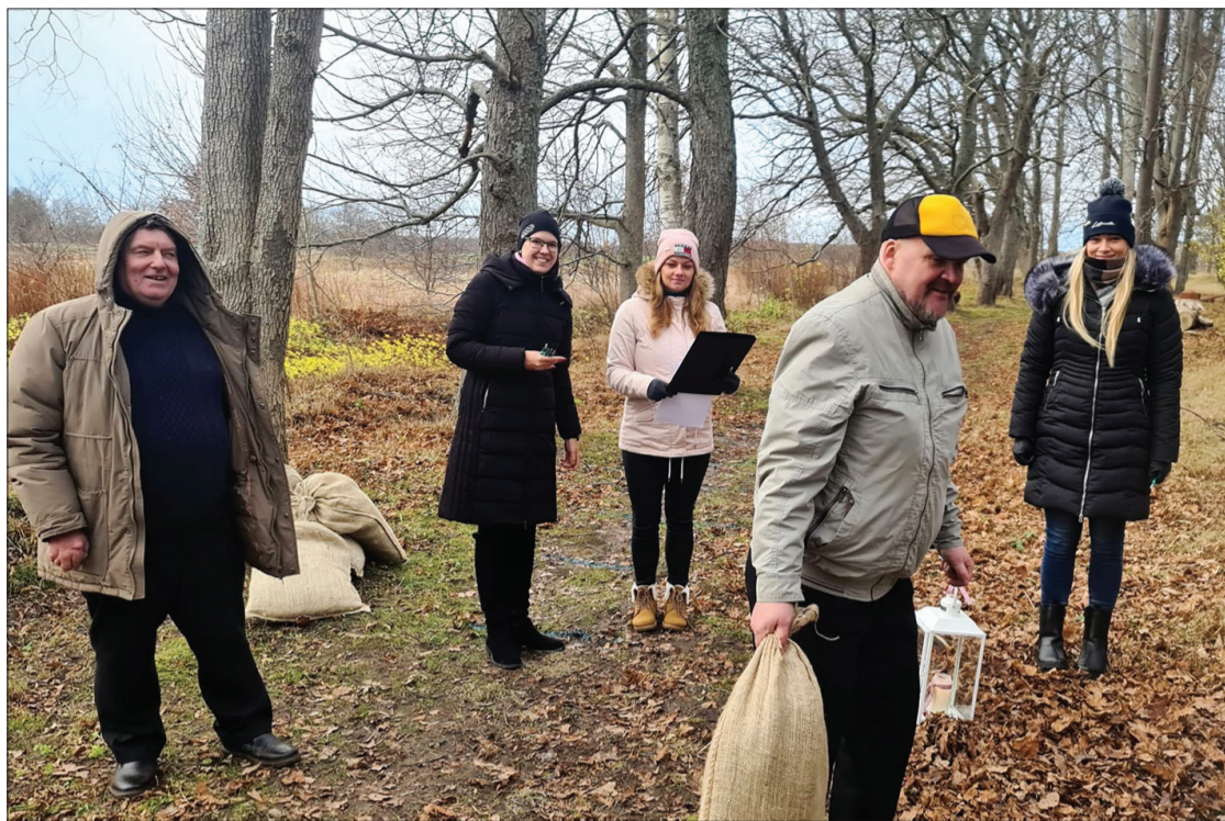
Ko darīt ar maisu, ko iesākt ar lākturi, prāto pasākuma dalībnieks.