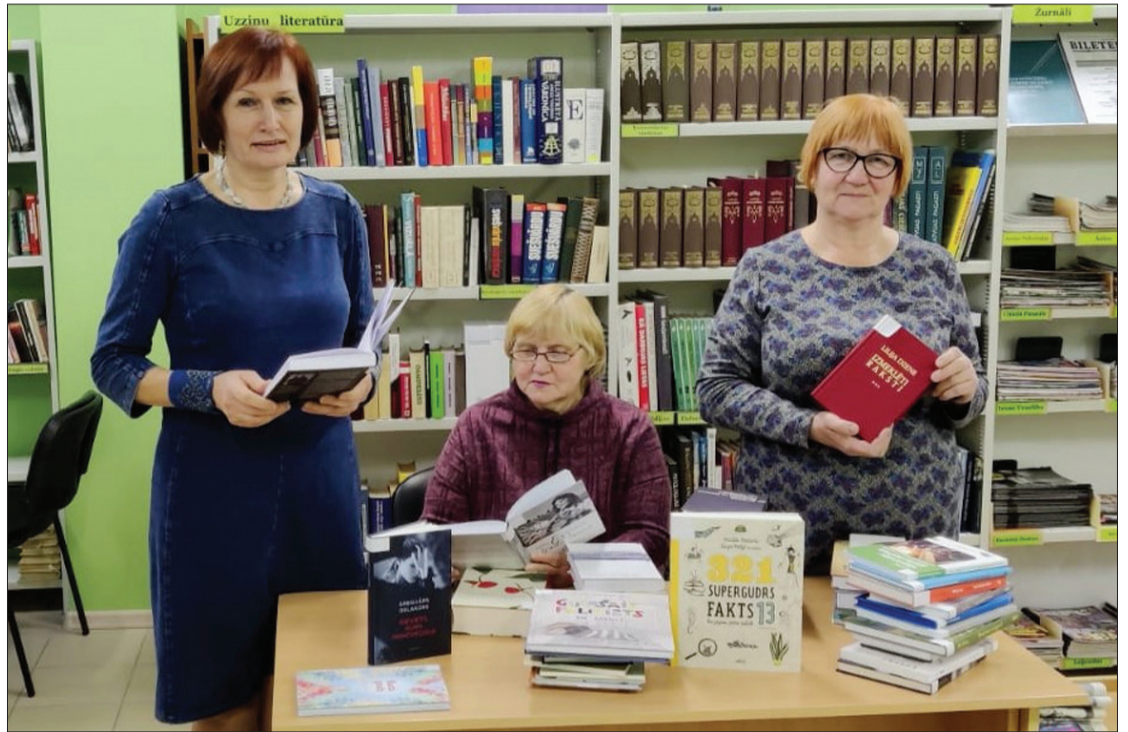
Uģāles pagasta bibliotēkas darbinieces šāgada sākumā – gatavas palīdzēt ikvienam lasītājam.

Šajos 20 gados bibliotēka tika remontēta ne vienu reizi vien, un bibliotēkas iekārtojums un aprīkojums tika nomainīts un uzlabots gan par pašvaldības līdzekļiem, gan piesaistot naudu projektos. Tā 2011. gadā, startējot Lauku atbal-