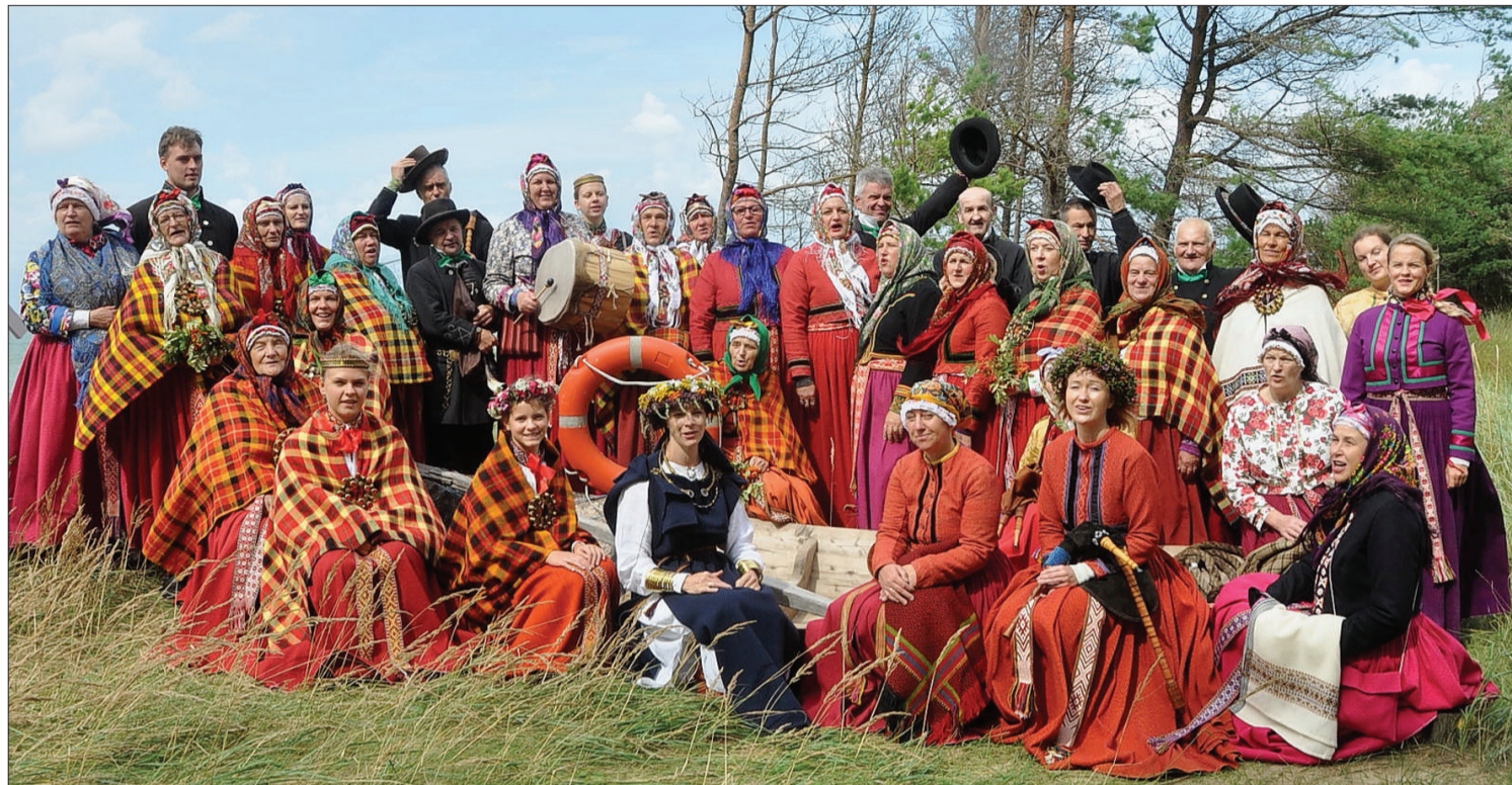
Burdona dziedāšanas svētki Jūrkalnē šovasar.

las vecuma bērniem “Suitu tradīciju skoliņa 2021”, kurā piedalījās 20 bērni. Šogad suitu tradīciju nometne notika desmito reizi. Tika apgūtas suitu tradīcijas, izzināta vēsture un radošā darbošanās.