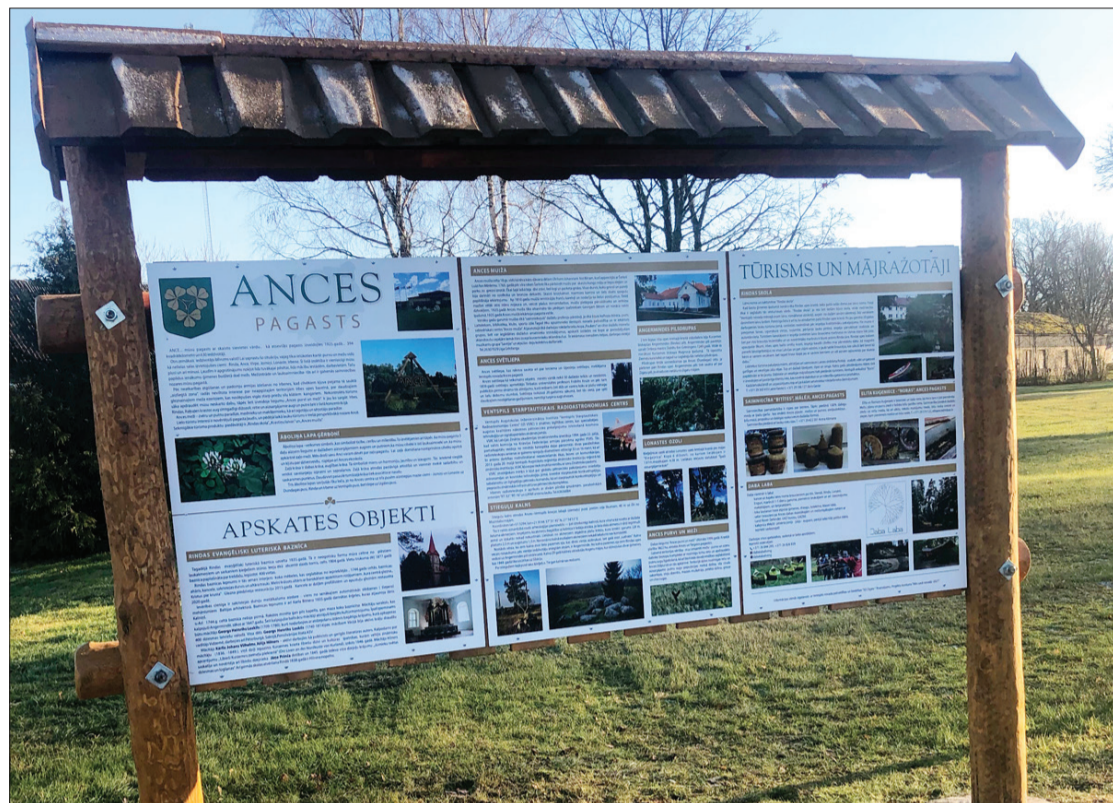
Ances centrā uzstādīts informatīvs stends, tajā ir daudz ziņu par pagastu un tā cilvēkiem.

Informācijas stends uzstādīts pašvaldības īpašumā "Ancnieki" – pašā pagasta centrā netālu no lielās Ances zīmes, turpat atrodas arī valsts ceļu Ventspils–Dundaga un Ance–Ugāle krustojums un stāvlaukums mašīnām. Tā ir atpūtas vieta, kur vienmēr pulcējas cilvēki, stends ir redzams, gan iebraucot, gan caurbraucot Ancei. Konstrukcija izgatavota no koka un ir līdzīgā stilā ar lielo Ances zīmi, tāpēc arī tas būs kā vides vizuālās pievilcības pilnveidotājs un uzlabotājs. Vienlaikus ar sava pagasta popularizēšanu mēs piedalīsimies Ventspils novada pozitīva tēla veidošanā.