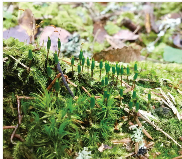
Ugālē atklāta Latvijā ļoti retas un īpaši aizsargājamas sūnu sugas zaļās buksbaumijas “Buxbaumia viridis” jauna atradne.

Dabas aizsardzības pārvaldes mediju attiecību eksperte Ilze Reinika