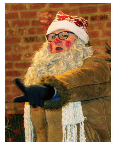
Vārves pagasta rūķiem palīdzēja no Jūrkalnes ieradies rūķis, kuram bija daudz labu padomu.