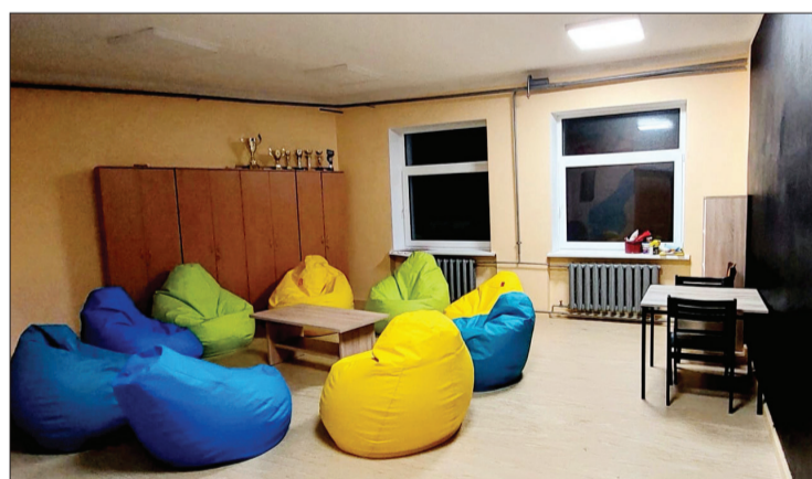
Pašu skolēnu mājīgi iekārtotā pašpārvaldes telpa. Labajā pusē – labo domu tāfele.

Valstī izsludinātās epidemioloģiskās situācijas dēļ skolās tika pagarināts brīvlaiks, un arī pēc tā skolēni mācījās attālināti. Tomēr