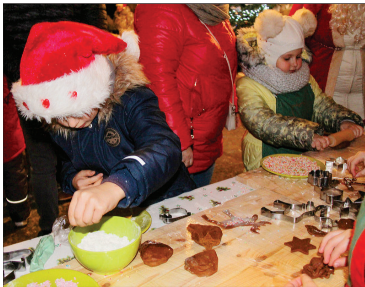
Rūķu darbnīcā darbojās arī paši mazākie, ķeroties pie piparkūku gatavošanas.

Īpašs paldies jāsaņem par kultūras darbinieku Ziemassvētku sveicieniem internetā. Ik dienu no 1. līdz 24. decembrim, atverot viņu veidoto Adventes kalendāru, varējām uz klausīt kādu Ziemassvētku vēlējumu. Jauki, ka kalendārs veidots ar izdomu.