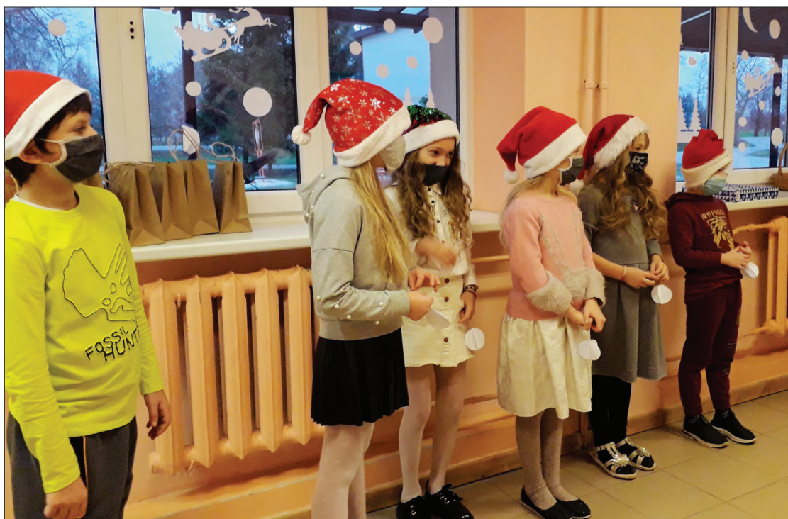
2. klases skolēni gatavi rotāt eglīti.