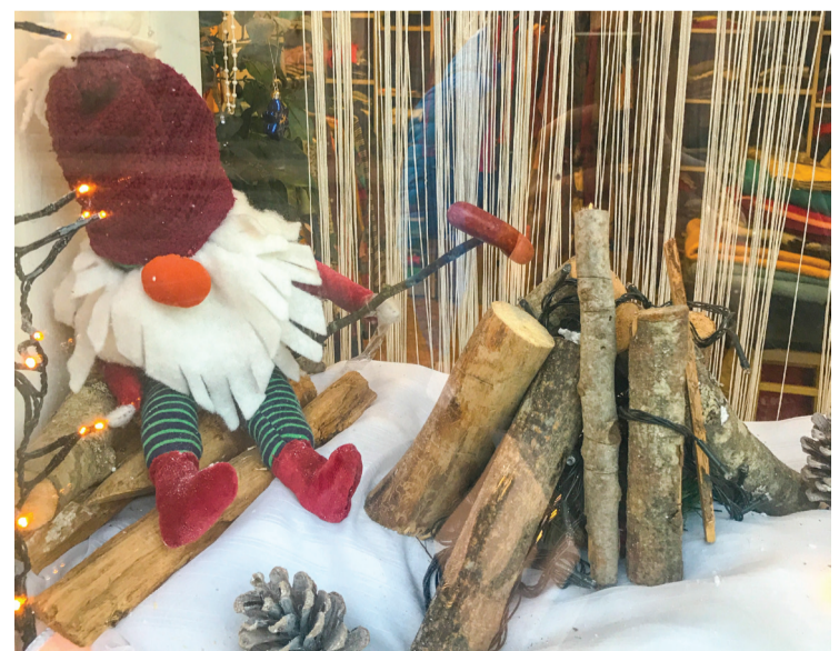
Veikala „Bodīte 7” skatlogs Sabīlē