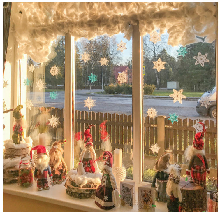
Smukumlietu un mājražotāju veikala „Rokraksts” skatlogs Stendē