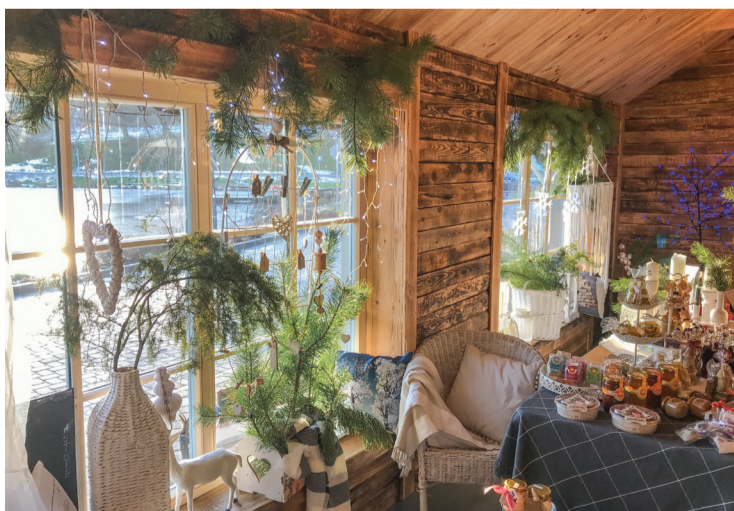
Kafejnīca „Cafe Nr.33” Talsos