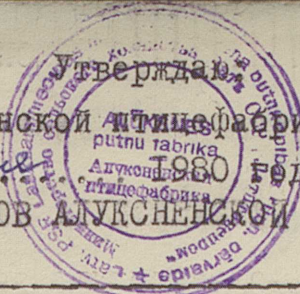
ГРАФИК ОТПУСКОВ РАБОТНИКОВ АЛУКСНЕНСКОЙ ПТИЦЕФАБРИКИ.