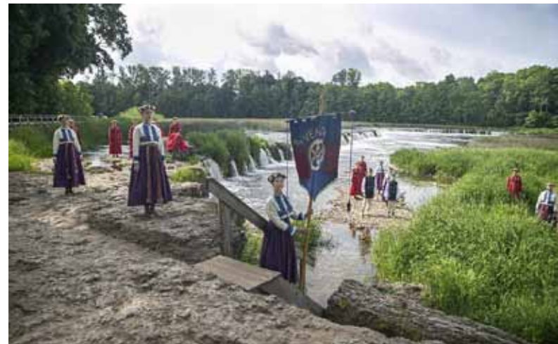
Kuldīgas novada bērnu un jauniešu centrs pie Ventas rumbas gatavojas skolēnu Dziesmu un deju svētkiem.