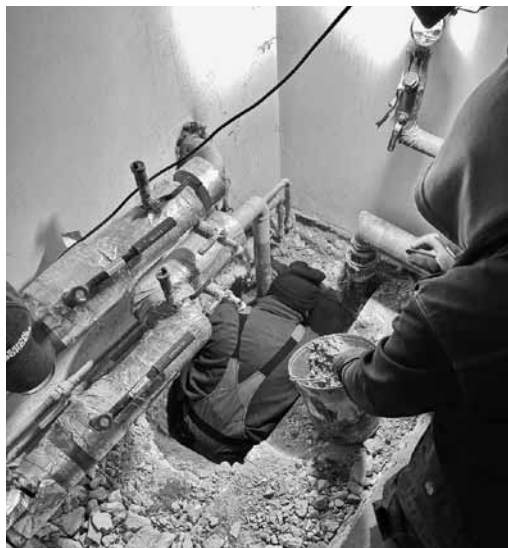
Bērnodārs Cīrulītis . Piemērs tam, ka siltumtrases pievads ar ārā nepiemērotiem materiāliem ar laiku plīsīs un notiks avārija. Ja kaut ko dara, tad tikai ar atbilstošiem materiāliem.

„Siltā grīda vienā dzīvoklī bieži vien apēd arī kaimiņiem paredzēto siltumu. Visi maksā vienādi, bet viens sildās vairāk.”