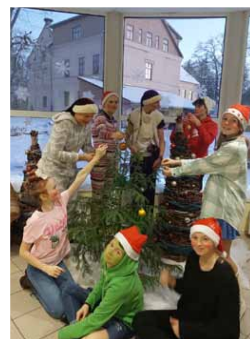
Vārmes jauniešu centrs Čiekurs tūlīt filmēs Ziemassvētku video.