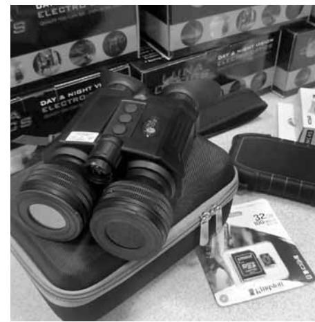
Binokļi ar nakts redzamību Valsts policijai palīdzēs nelikumības pamanīt daudz labāk. Malumediķiem, maluzvejniekiem un citiem likumpārkāpējiem nu jāuzmanās, jo tumsa vairs nedos vēlamo aizsegu.

Konkursā par binokļu iegādi bija trīs pretendenti, un iepirkuma komisija izvēlējusies SIA Cricoo . Līguma summa ir 18 991 eiro. Šis pretendents uzvarēja arī konkursā par videokameru iegādi – tur summa ir 5154 eiro. Projekts SCAPE II ilgst divus gadus un notiek Interreg V-A Latvijas–Lietuvas pārrobežu sadarbības programmā. Kopējais finansējums ir ap 473 000 eiro, no kuriem 85% jeb aptuveni 402 000 eiro finansē Eiropas Reģionālās attīstības fonds. Programmas nolūks ir palīdzēt novadus padarīt konkurētspējīgākus un pievilcīgākus dzīvošanai, uzņēmējdarbībai un tūrismam.