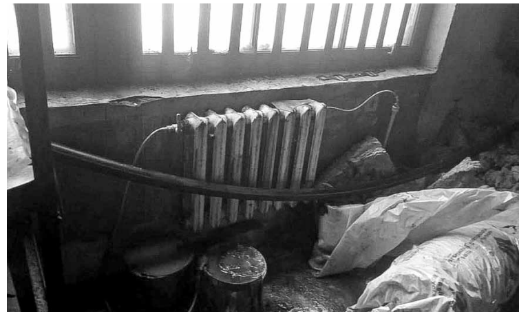
Pēdējā laika skaļākais notikums – Kuldīgas siltumtīklu darbiniekiem sākotnēji likās, ka Tehnikas ielā 2 senāk pa kluso izbūvēts nelegāls pieslēgums siltumtrasei. Tomēr patiesība tāda, ka arī pašvaldības uzņēmums daļēji pie tā vainojams, – pirms daudziem gadiem pieslēdzās vietējai trasei un to aizmirsā.