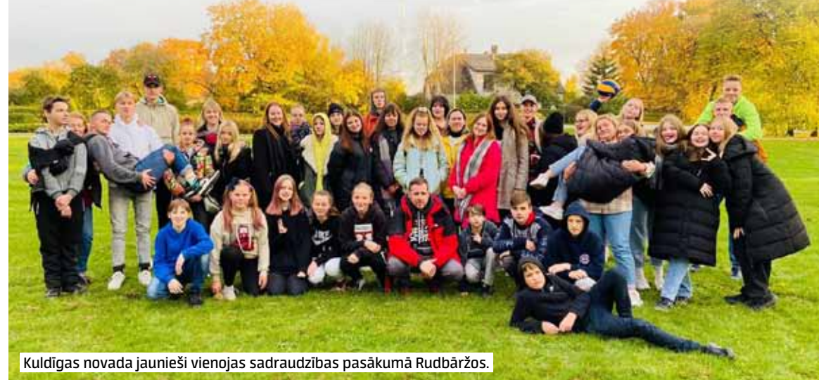
Kuldīgas novada jaunieši vienojas sadraudzības pasākumā Rudbāržos.

Dalību pasākumos nevarot saīdināt ar iepriekšējiem gadiem, jo apmeklējums bijis pavisam neliels: „Citus gadus pasākumi un meistarklases tika apmeklētas daudz aktīvāk, bet tagad priecājamies par katru bērnu un jauniešu, kurš piesakās un iesaistās mūsu rīkotajās aktivitātēs.”