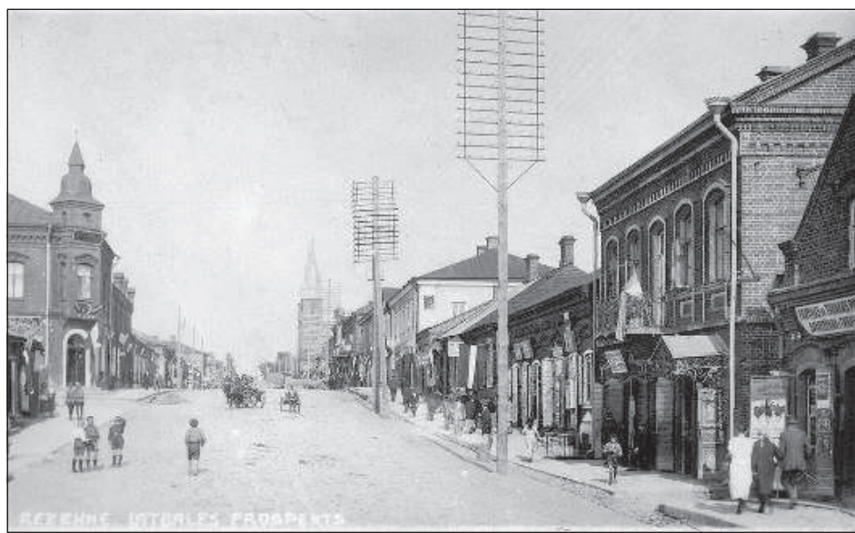
Фотография межвоенного периода.