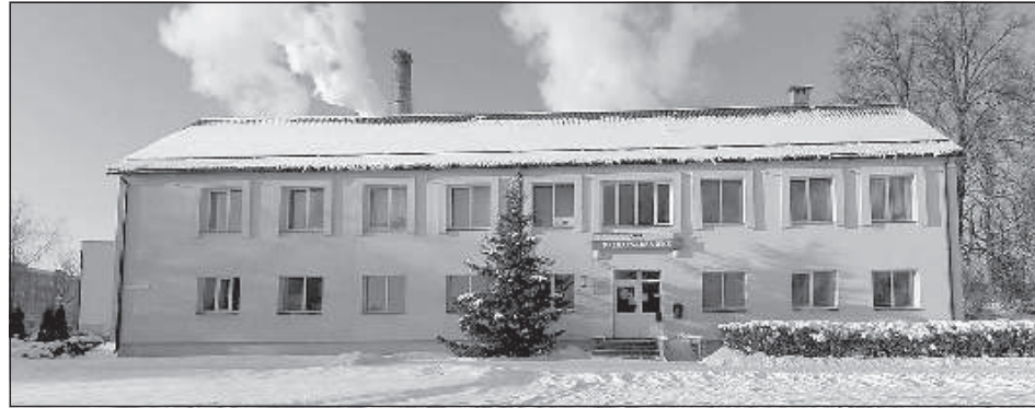
Офисное здание «Preiļu saimnieks».