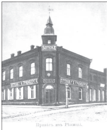
Фотография царских времен.

Если сейчас встать у аптеки Эргля и посмотреть на здание из красного кирпича на улице Латгалес, 42, что на противоположной стороне улицы (там ши-