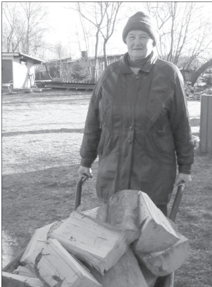
Дровами занимается только сама.