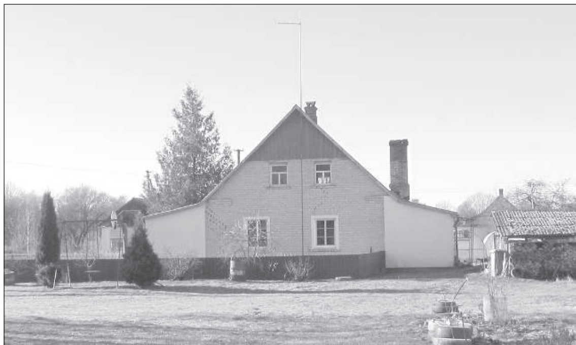
Дом как на картинке.