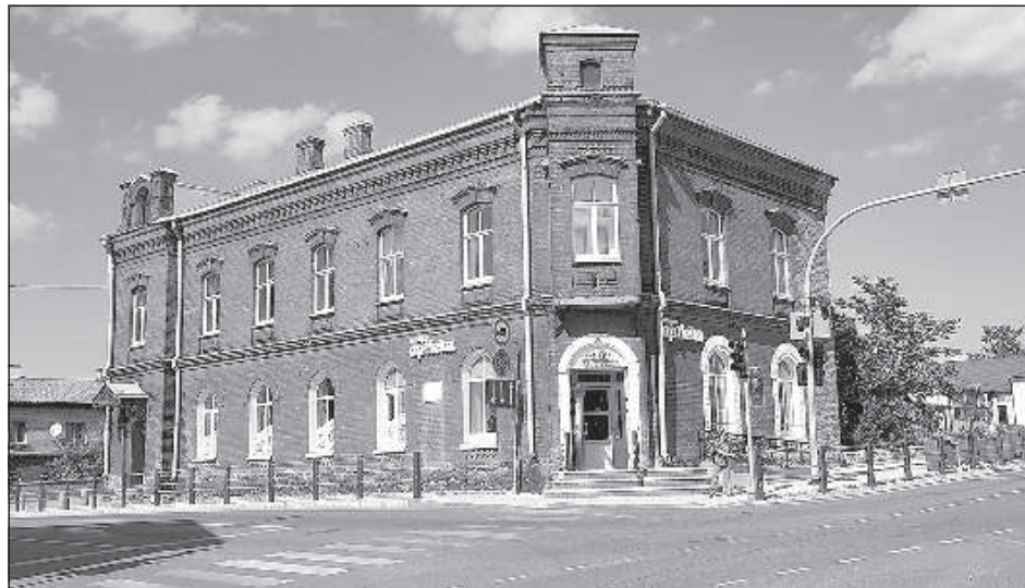
Летом 2019 года.