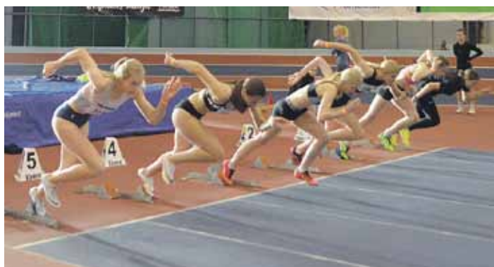
Jauno vieglatlētu sasniegumi.