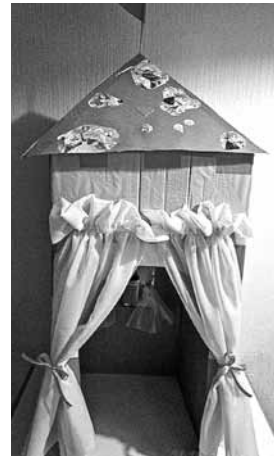
Bērna rotaļu māja.