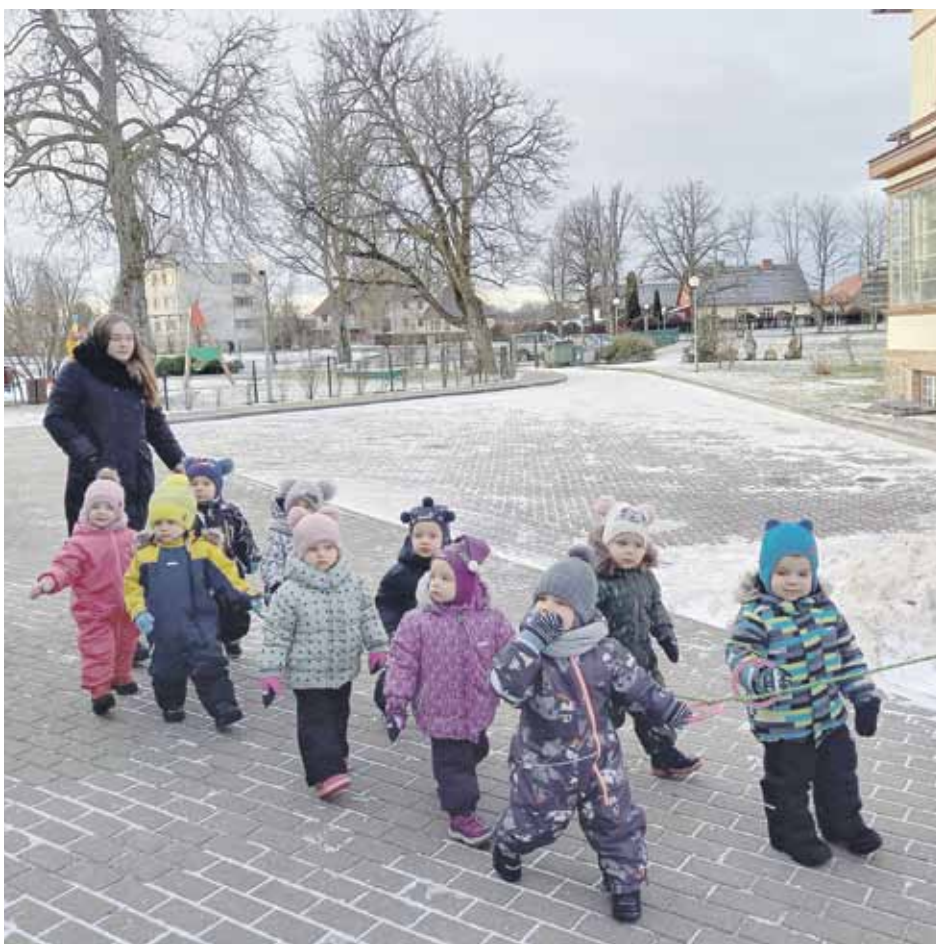
Dienas vidū mazie dodas pastaigā pagalmā, pirms tam silti saģērbjoties.