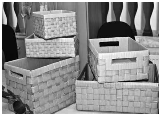
No kartona izgatavotas groza kastes.