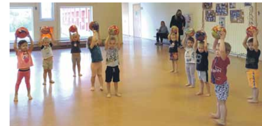
Te notiek mūzikas un sporta nodarbības.

Pašlaik Ābelītes jaunajā mājā ir astoņas grupiņas: divas bērniem no pusgada līdz diviem gadiem, pa divām arī trīsgadniekiem, četrgadniekiem un piecgadniekiem. Vecajā ēkā darbojas četras grupas – trīs, četrus un sešus gadus veciem bērniem.