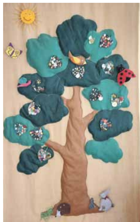
Ienākot Ābelītes jaunajā ēkā, var ieraudzīt krāšņus ābeļi, kas rotā sienu.

Daina Tafelberga, Amanda Gustovska