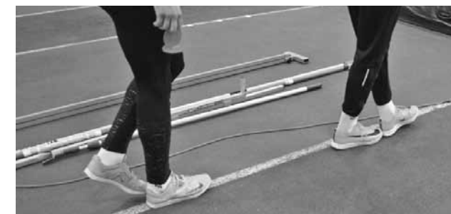
Tāllēcēji mēra savu ieskrējiena atzīmi.