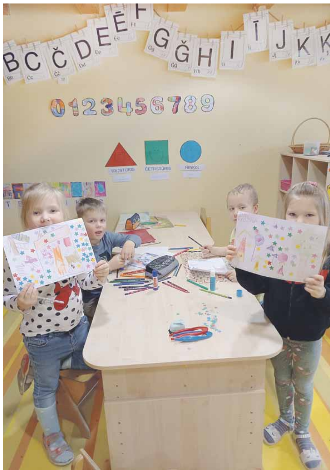
Jubilejas zīmējumi par tēmu Mans bērnudārzs . Mazie izkrāsojuši arī zīmētās tortes.