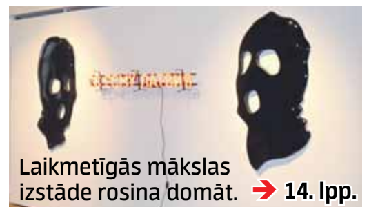
Laikmetīgās mākslas izstāde rosina domāt. → 14. lpp.