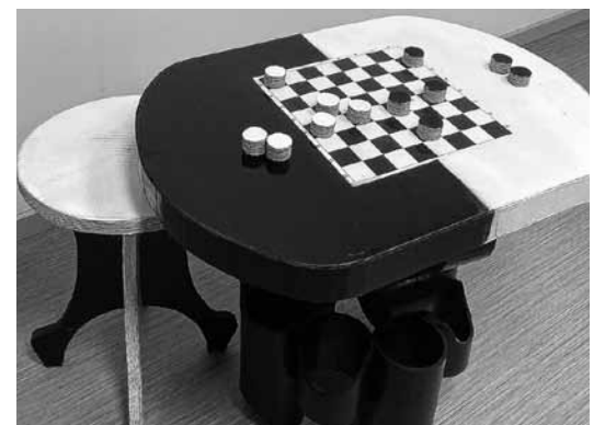
No kastēm darināts dambretes galdiņš.

Nereti rodas jautājums, kur likt iesaiņojuma kartona kastes. SIA Zaļā josta iesaka astoņus praktiskus veidus, kas ļaus ne tikai taupīt resursus un saudzēt dabu, bet arī pašiem radīt mājsaimniecībā noderīgas lietas.