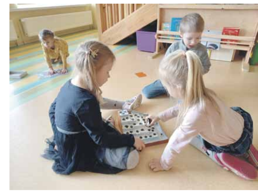
Bērnu ikdiena – spēles ar rotaļlietām, koka klucīšiem un citām mantām.