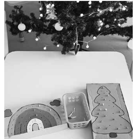
Ziemassvētku egles rotājumi no kartona.