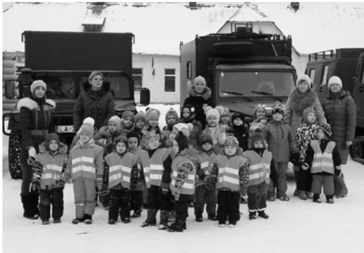
“Cālēni” Lāčplēša dienā apskatīja Nacionālo bruņoto spēku Kājnieku skolas tehniku