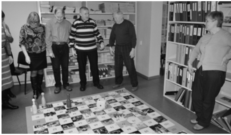
Interesenti iemēģina jauno lielformāta spēli darbībā

Spēle sastāv no spēles laukuma (2 x 2 metri), krāsainiem spēļu kauliņiem un jautājumu kartītēm.