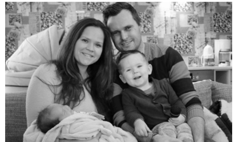
Mazais Renārs pasaulē nācis 15. oktobrī, kļūdams par simto 2016. gadā Alūksnes novada Dzimtsarakstu nodaļā reģistrēto mazuli