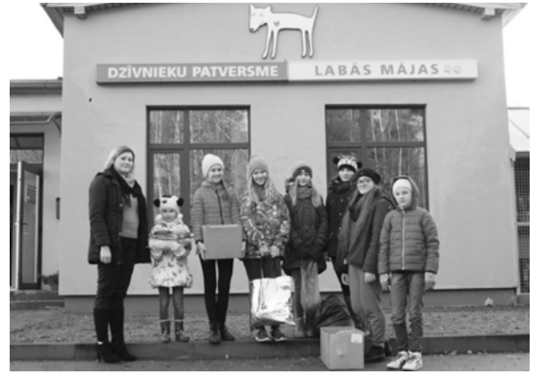
Jaunlaicenes pamatskolas audzēkņi šogad labos darbus veltījuši Rīgas dzīvnieku patversmei “Labās mājas”