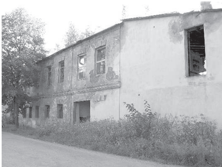
Бывший Резекненский пивоваренный завод. В моей юности оно было без штукатурки.

Выбросить стеклянную бутылку в мусорник было дорогим удовольствием – тара