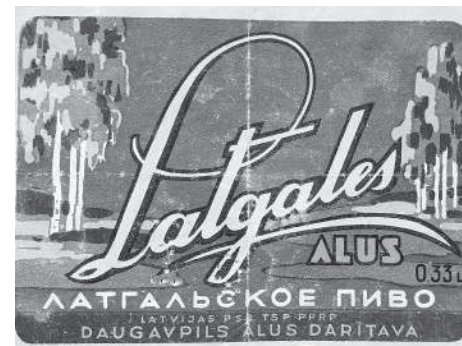
Это пиво можно было купить в Даугавпилсе, Резекне, Риге и др.