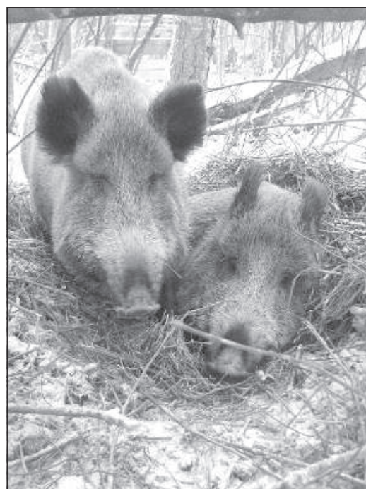
Кабанов в наших лесах предостаточно.