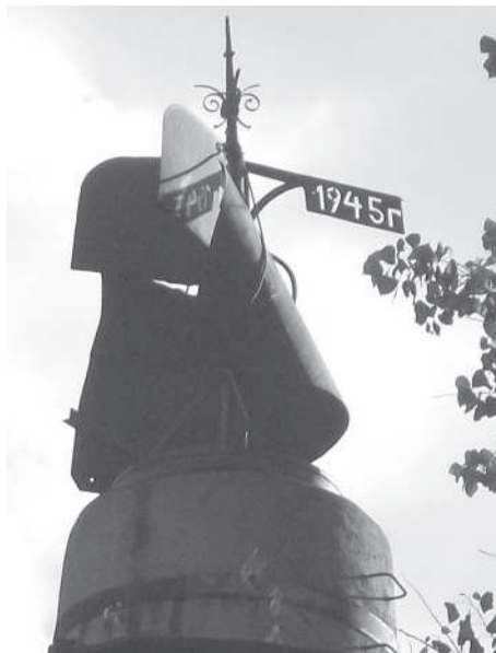
Флюгер пивоварни (2012).

Основные преобразования Резекненского пивоваренного завода произошли в