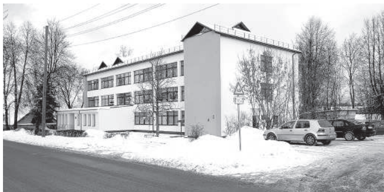
Бывшая железнодорожная поликлиника (2019).

начале 60-х годов 20-го века. «Раньше на Резекненском пивоваренном заводе к разливочному аппарату ящики привозили вручную, и в течение дня приходилось перемещать более одного вагона тары. Однако вскоре производство будет полностью механизировано: старое примитивное оборудование вскоре заменят герметичными котлами, сетью трубопроводов и новейшими механизмами. В свое время увеличение производства безалкогольных напитков вызывало трудности, теперь был сделан дозирующий насос для розлива сиропа в бутылки. На зерновом складе примитивные оконные вентиляторы, не способные подавать свежий воздух, заменили на мощные вентиляторы». 4