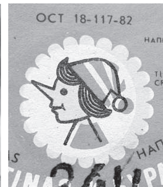
Популярный безалкогольный напиток.