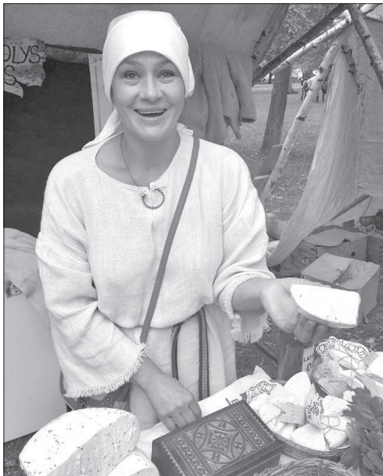
Продавец сыра с тмином.

«Čimīni zīd ūtrā godā pēc sēšonas, jūnija mēnesī. Ražu pūvōc pēc nūzīdēšonas, kad lelōkais sāklu vairums pijam bryunu nūkrōsu. Nūvylycynūt čymynu ivōkšonu nadreikst, jo jōs ōtri bērst. Čymynus pļauņ ar izkaptim un salīk vīnkūpus nalelōs kaudzeitēs (staterņūs). Ūtrā, trešā dīnā vad škyunī. Lai naiņu bērstūšōs sāklas zudumā, rotus izklōj ar brezentu un tad izdora čymynu vesšonu. Kuļ ar sprygulim, bet lelōkus vairumus ar kuļammašinu. Pēc tam sāklas izsejoj un ānōtā vītā izber plōnā kōrtā galeigi izkaļššonai. Nadreikst kaļtēt bizā kōrtā, jo tad