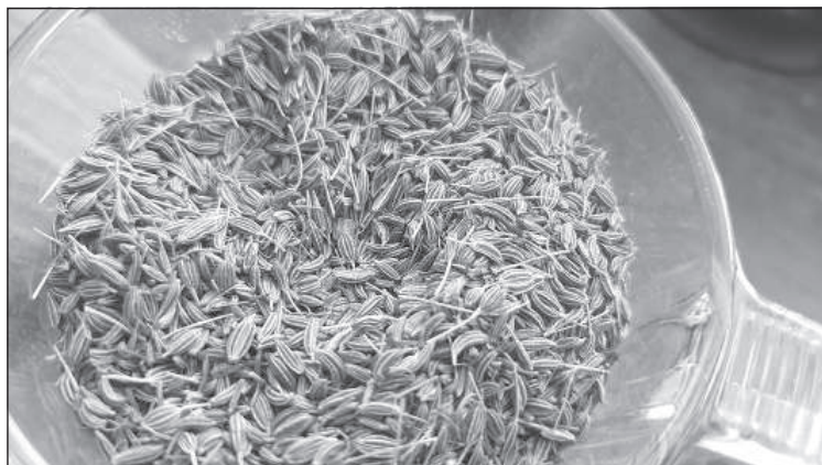
Семена тмина на кухне практически универсальны.

Тмин универсален! Его используют, когда квасят капусту и когда делают тминную водку. Если пожевать тмин, можно замаскировать запах алкоголя. Его даже добавляют в мыло как скраб!