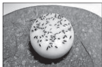
Это мыло - с семенами тмина.

ōtri var sāklas sōkt ikarst. [...] Bez jau mynātom sāklom nu čymynim audzātōjs īgyust arī čymynu pašu stublōjus kaulus. Šūs kaulus labi var izbarōt lūpim, seviški lobprōt tūs ād vuškas.» 3