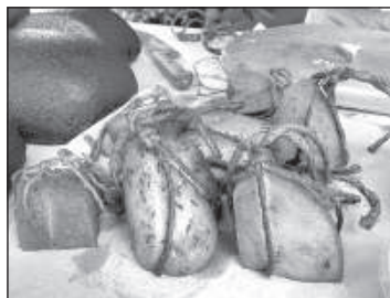
Копченый сыр с тмином (2014).

Не так радостно, когда тмин приходится использовать в лечебных целях. Его обычно рекомендуют при резах в животе, вздутии живота и неактивной работе кишечника.