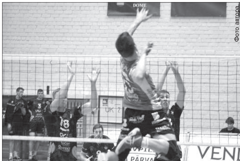
Фрагмент матча между «Эзерземе/ДУ» и «Бигбанк».

После вчистую проигранного первого сета – 17:25, даугавпилчанки