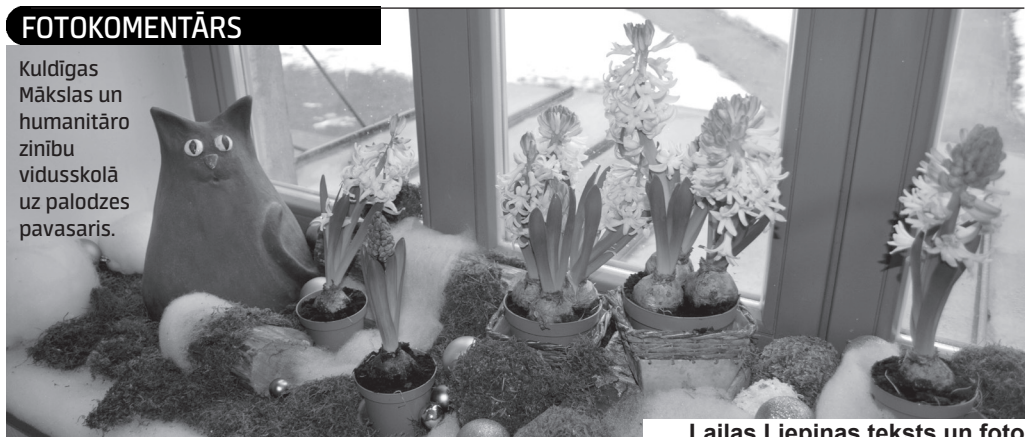
Lailas Liepiņas teksts un foto

Kuldīgas Mākslas un humanitāro zinību vidusskolā uz palodzes pavasaris.