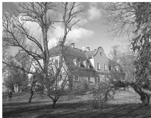
Maras muižas osis aizvadītājā gadā un nupat janvārī pēc vētras.