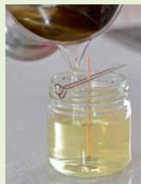
Sveču traukā ievieto degli un rūpīgi ielej izkausēto parafīnu.