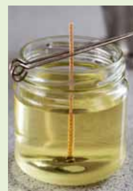
Ļauj svecei atdzist.