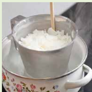
Tiek izkausēts parafins vai sojas vasks.