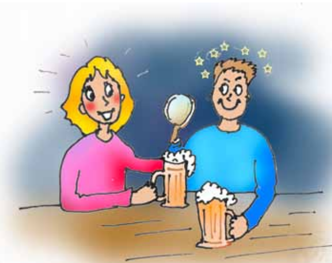
Sveču dienā meitām jādzer alus, tad būšot visu gadu skaistas.

Sievietēm šī ir svētku diena, kurā nedrīkst ne matus ķemmēt, ne kāpostus vārīt, pat ne adatas cilāt, lai mati nestāv kā sveces, lai kāposti aug un nabadzība nedur.