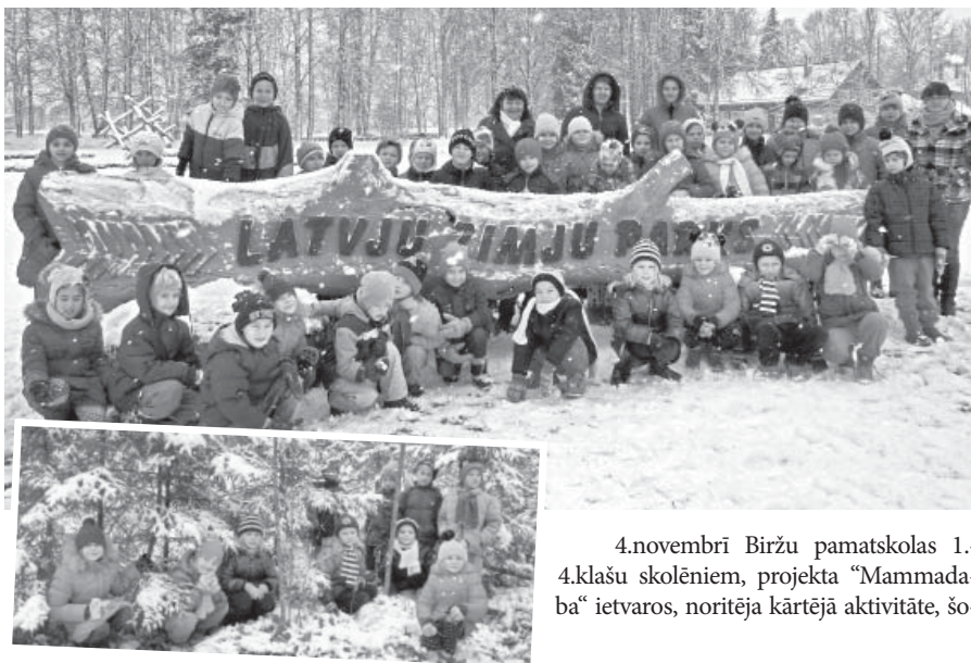
4.novembrī Biržu pamatskolas 1.-4.klašu skolēniem, projekta “Mammadaba” ietvaros, noritēja kārtējā aktivitāte, šo-

reiz Leimaņos Latvju zīmju parkā, lai iepazītu ozolkokā veidotās lielās, masīvās latviešu etnogrāfisko rakstu zīmes.