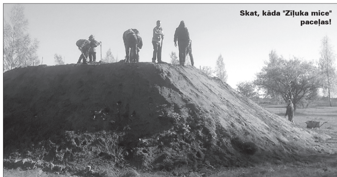
Skat, kāda "Zīļuka mice" paceļas!