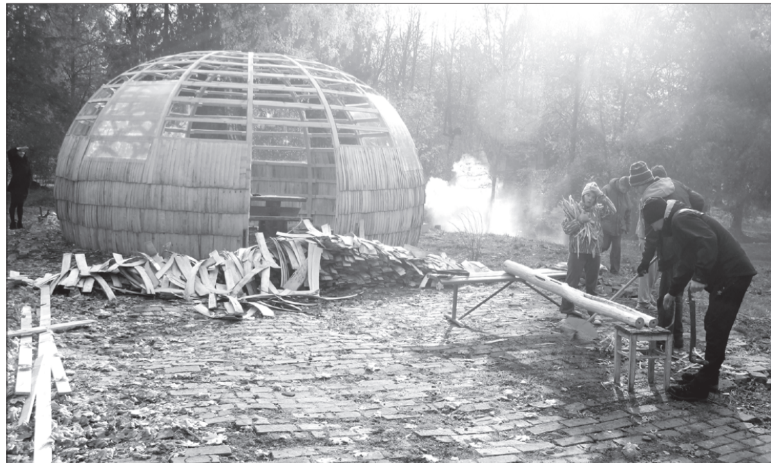
Viens no biedrības "Annahite" jaunajiem projektiem – nojume, kuras izveidošana piedalās arī skolas audzēkņi.