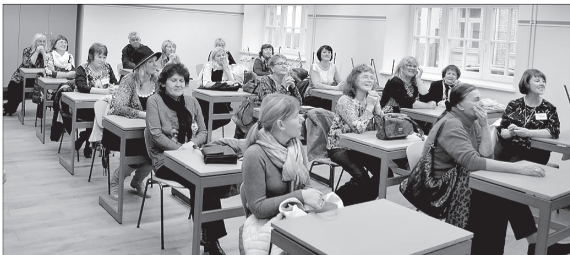
Vērgalnieki satikušies ar kolēģiem no Tārgales pamatskolas.

Viena no ļoti nozīmīgām vērtībām katra cilvēka dzīvē ir draugi. Īsti, patiesi, uzticami draugi. Taču izrādās, ka draudzēties var ne tikai cilvēki.