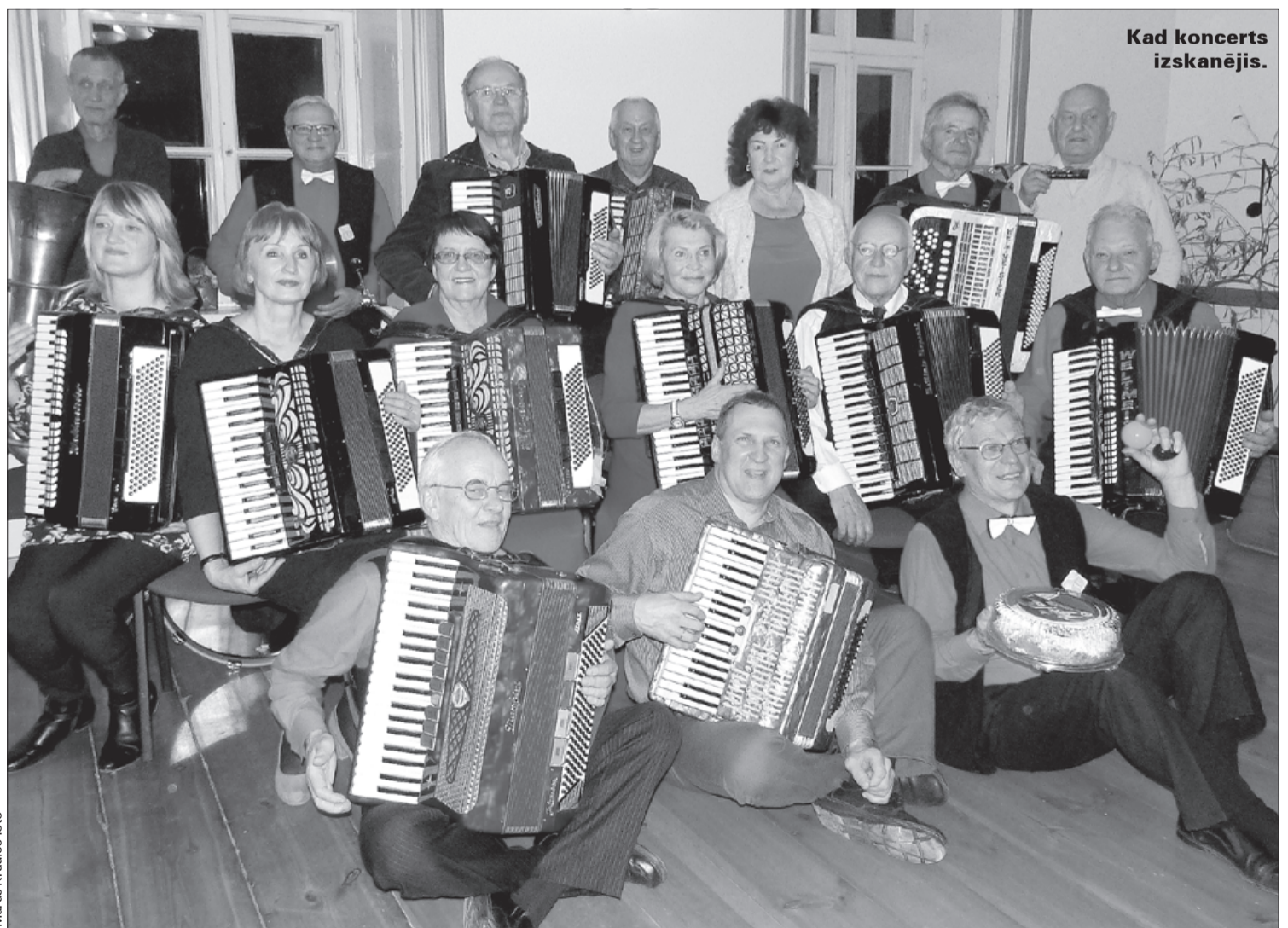
Kad koncerts izskanējis.

Pēc koncerta bija iespēja izbaudīt Spāres muižas piedāvājumu