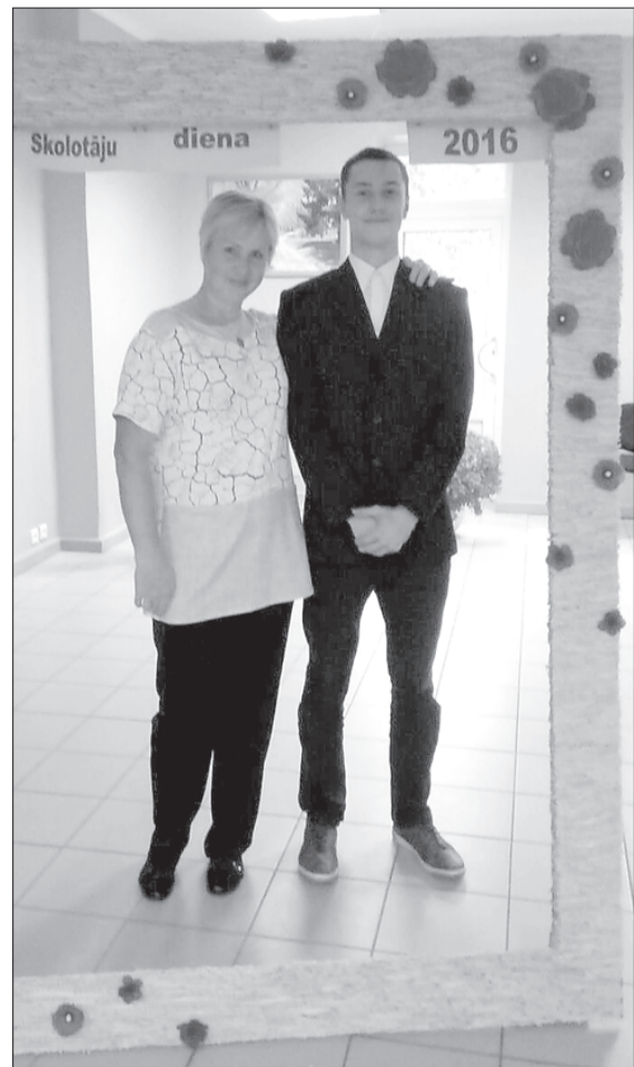
Neparasts moments – divi Zūru pamatskolas direktori vienuviet.