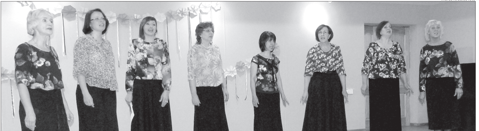
Nakts koncertā uzstājas ansamblis "Mežarozes".

Neticēsiet, bet tiešām – oktobris dižojās dažādu puķu košumā, kuras tika ievītas skanīgās dziesmās! Šo skanīgo koncertu Puzes Kultūras namā pieskandināja 14 kolektīvi no malu malām. Pie mums viesojās gan novada kolektīvi, gan mūsu lielpilsētas, gan kaimiņu novadu dziedošie ansambļi.