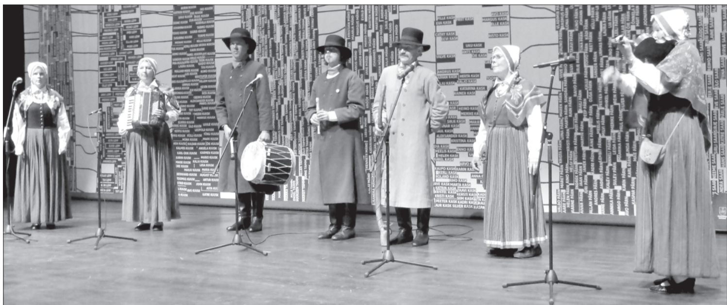
Tartu muzeja teātra zālē.

Jaunā, pelēkā stikla ēka atrodas bijušā padomju lidlauka skrejceļa