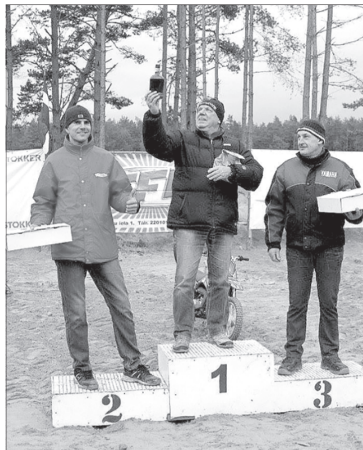
Vīriem prieks par uzvaru un labi pavadīto laiku.