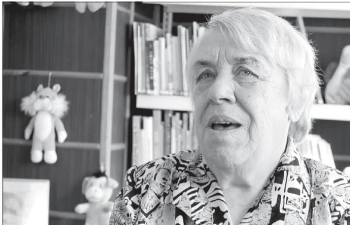
Senioriem, uzskata Māra, visas durvis ir vaļā; ja vien grib, var atrast veidu, kā pilnveidot savas prasmes un izpausties radoši.

Seniore iesaistījās arī Vārves pagasta amatiereteātrī "Vārava". "Tolaik, pirms sešiem gadiem, dzīvoju Ventavā un strādāju dārziņā .