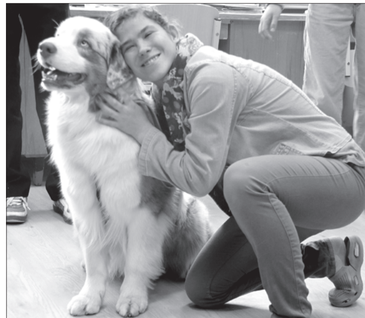
Ir tik labi pieglausties mīļam suņukam!

audzēkņi daudz varētu darboties ārpus skolas sola, jo neformāla gaisotne rosina atvērties un brīvāk paust savus uzskatus, bet tas sekme garīgās, emocionālās un fiziskās pasaules attīstību.