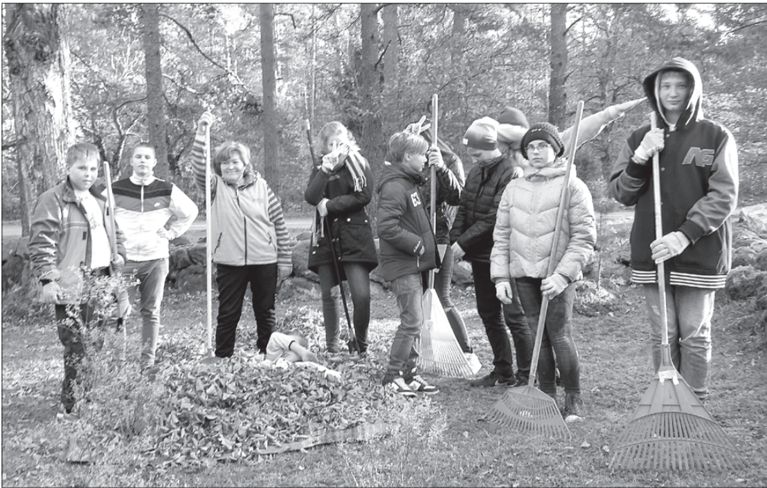
Labie darbi paveikti – sagrābts lapu birums pie Rindas baznīcas.