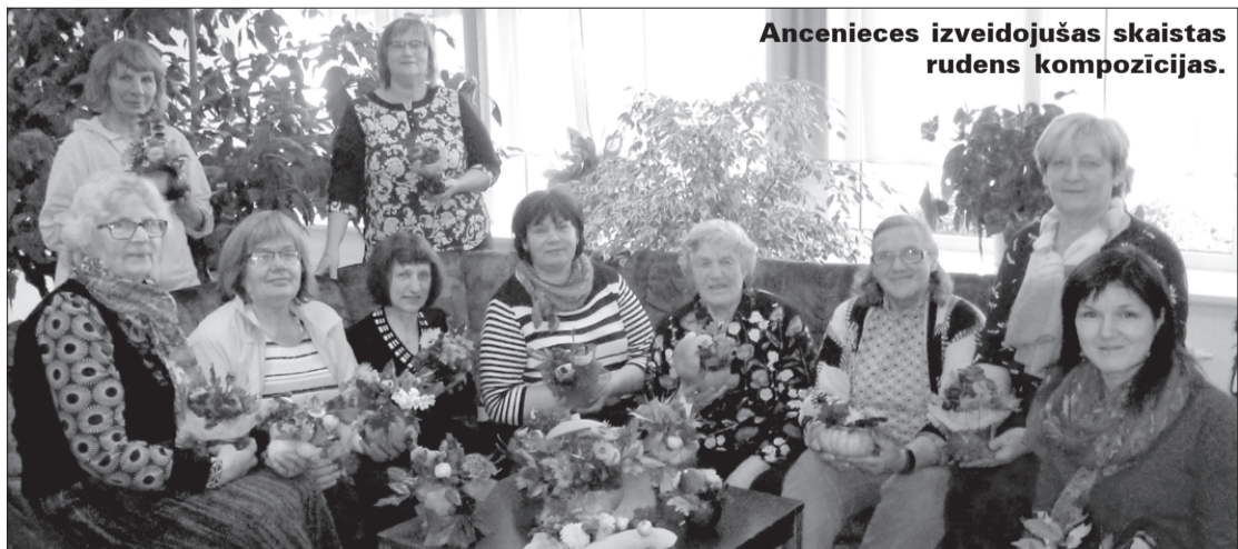
Ancenieces izveidojušas skaistas rudens kompozīcijas.

Līdz septembrim Kultūras namā rosījās celtnieki, kas nomainīja jumta segumu, iekārtoja ventilācijas sistēmu un elektroapgādes rekonstrukciju. Oktobrī Ances Kultūras namā, tāpat kā daudzās līdzīgās iestādēs, sākās jauns darba cēliens. Ances