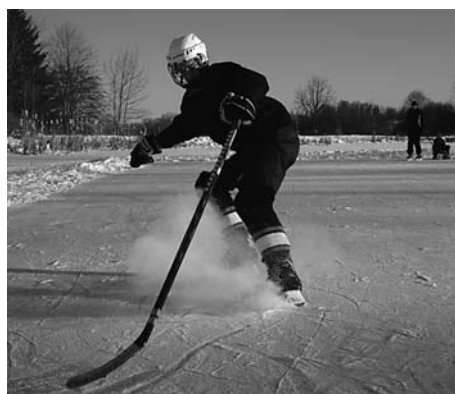
Ātrums, prāts, emocijas

Sports dod pārliecību par sevi, par to, ko spēju. Treniņi notiek divas reizes nedēļā un tādēļ aizņem daudz laika. Dažkārt pietrūkst laika kam citam, pat tam, lai satiktos ar draugiem.