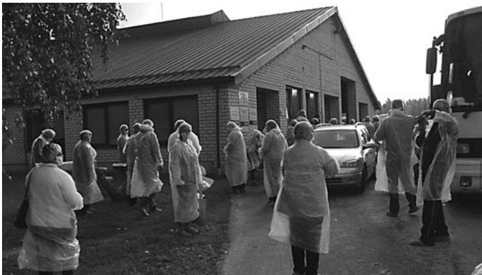
Gatavojamies apskatīt Jasineviču ģimenes fermu

Tālāk dodamies pie Jasineviču ģimenes, kas nodarbojas ar pienu lopkopību un ražo saimniecībā sieru. Biznesu uzsāka vecāki, bet tagat jau četrus gadus saimnieko jaunā ģimene. Saimniecībā ir 180 slaucamas govys, izslaukums – virs 8000 kg no govys. Dienā slauc 3,5 t piena un gatavo savā ražotnē 14 veidu produkciju. To ražo atkarībā pēc pieprasījuma. Tirgo lielveikalu tīklā IKI. Pārējo pienu pārdod svaigā veidā arī uz Viļņu. Saimniecībā ir nodarbināti desmit cilvēki – pieci strādā kūtī, pieci pie piena produkcijas ražošanas. Vīrs atbild par darbu fermā, bet sieva par ražotni. Ir īstenoti vairāki ES projekti – kūts celtniecība (puslētā, vasarā sienas sedz blīvs siets, ziemā – brezents), jaunas slaukšanas iekārtas iegāde, telpa siera ražošanai, mēslu krātuve. Saimniecība ir ieguvusi titulu „rajona labākā saimniecība”. Kopā tiek apsaimniekoti 230 ha zemes. Ziemai tiek gatavota skābbarība. Audzē lielas kukurūzas platības. Govys stāv kūtī nepiesietas, tās tiek izlaistas pastaigās. Mūsu apmeklējuma laikā tās tika barotas ar svaigu atālu. Lai gan tiek intensīvi strādāts, saimniecība ir ļoti sakopta. Visā teritorijā ievietoti lieli kokgriezumi, kas Lietuvā ir raksturīgi. Kad ieminējos, ka saimniecībā izskatās kā ārzemēs, saimniece stāstīja, ka no Eiropas pieredzes brauciena atgriezies ar domu, ka pie viņiem saimniecībā esot labāk.