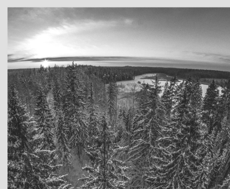
INTA BRIEŽA FOTOIZSTĀDE

Brauciet ciemos un ļaujieties fotogrāfa sajūtu lidojumam! ☞