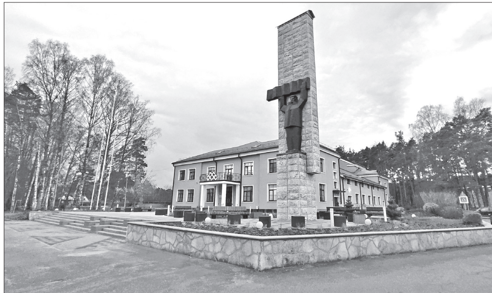
Projekta rezultātā Roja ir ieguvusi vēl vienu sakārtotu vietu, kur pulcēties, ar ko lepoties, kur pabūt savā nodabā.

Projekta rezultātā ir saglabāta pagājušā gadsimta septiņdesmitajos gados izveidotā laukuma pamatforma un tā apvienota ar mūsdienīgiem ārtelpas dizaina un labiekārtojuma risinājumiem, kas uzlabo laukuma funkcionālo lietojumu un iekļaujas kopējā Rojas ciema ainavā. Laukumā ap restaurēto pieminekli un ap kultūras centra ēkas galveno fasādi ir izveidotas vairākas pastaigu un atpūtas zonas ar soliņiem un pārvietojamiem kubiem, kuru novietojumu var pielāgot dažādu pasākumu vajadzībām. Laukumā ir atjaunotas platās, monumentālās centrālās kāpnes, kas papildinātas ar pārvietojamiem un multifunkcionāliem dizaina elementiem, kā arī atjaunotas dolomīta plākšņu atbalsta sienas gar Zvejnieku ielu. Dažādie laukuma apgaismojuma risinājumi dod iespēju apmeklētājiem laukumu apmeklēt ne tikai diennakts tumšajā laikā, un droši izgaismo ceļu uz kultūras centra galveno ieeju, bet dod iespēju laukumu izgaismot dažādu pasākumu vajadzībām. Jauns apgaismojums restaurētajam pieminek-