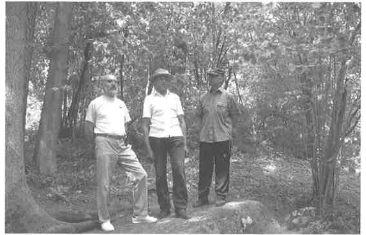
Uz īpašā akmens skan Jodupes vīru sveiciens skaistajām Gārsenes takām