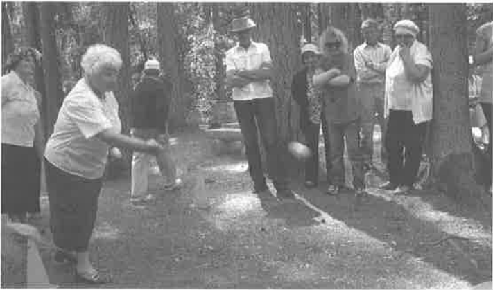
Tamāras veiksmīgais metiens