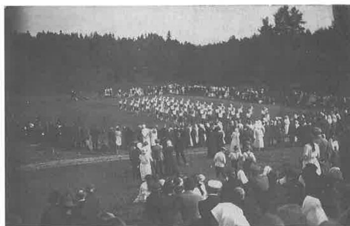
Bērnu svētki Susējas pagasta Vilkupē – gads nav zināms

Materiālu projekta „Aknīstes novads laiku lokos” ietvaros sagatavoja Edīte Pulere