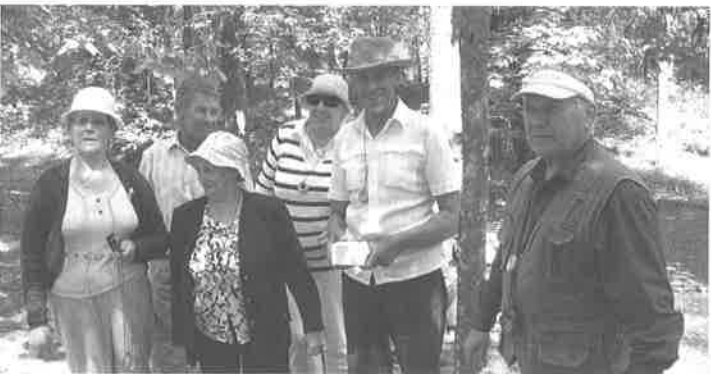
Ar nopelnītajām baranku medaļām