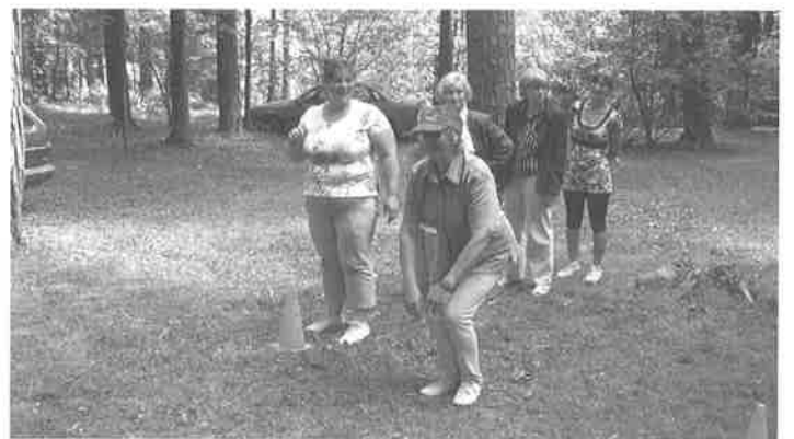
Tiesnese Zigrīda ir savā elementā