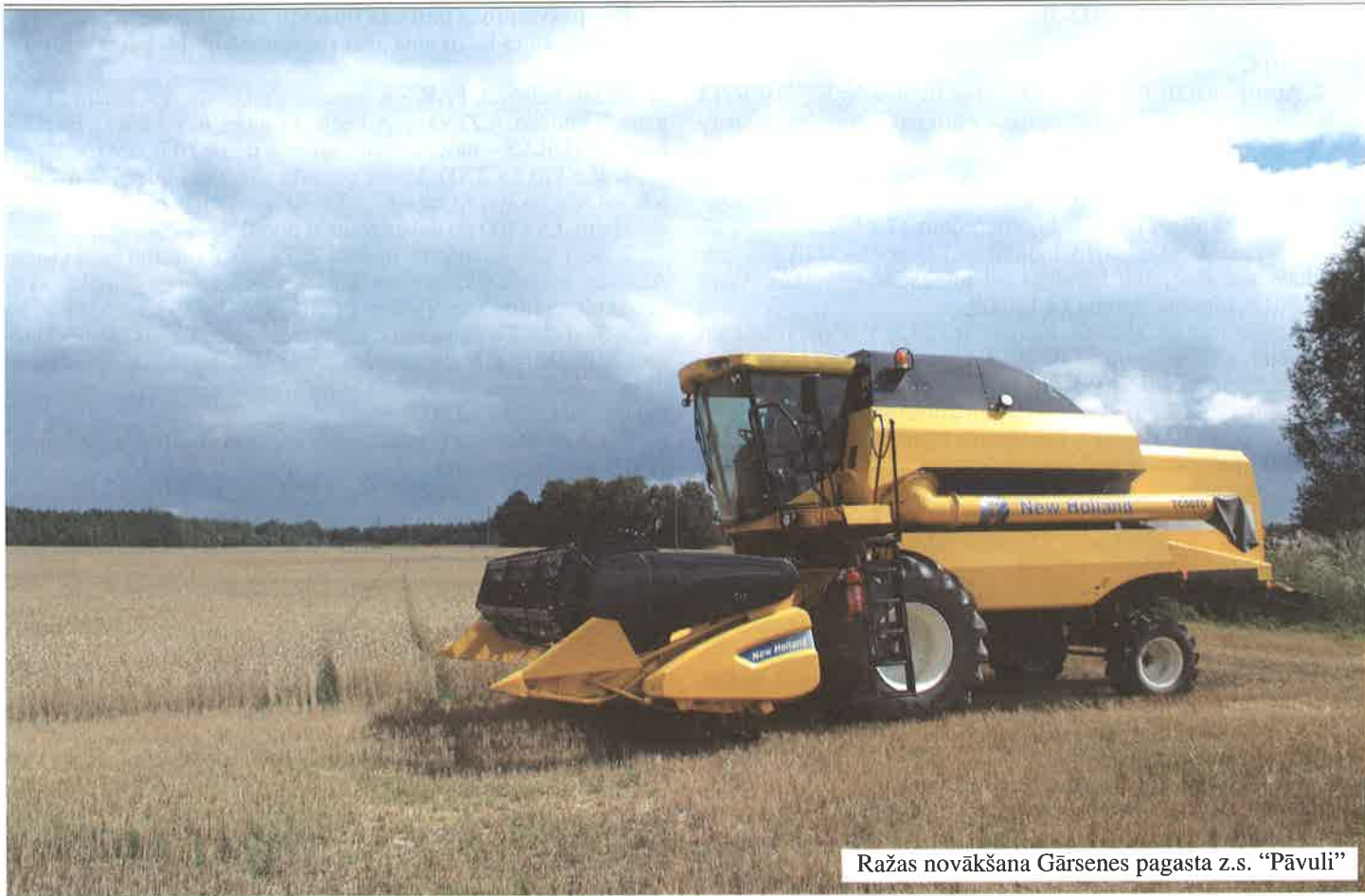
Ražas novākšana Gāršenes pagasta z.s. "Pāvuli"