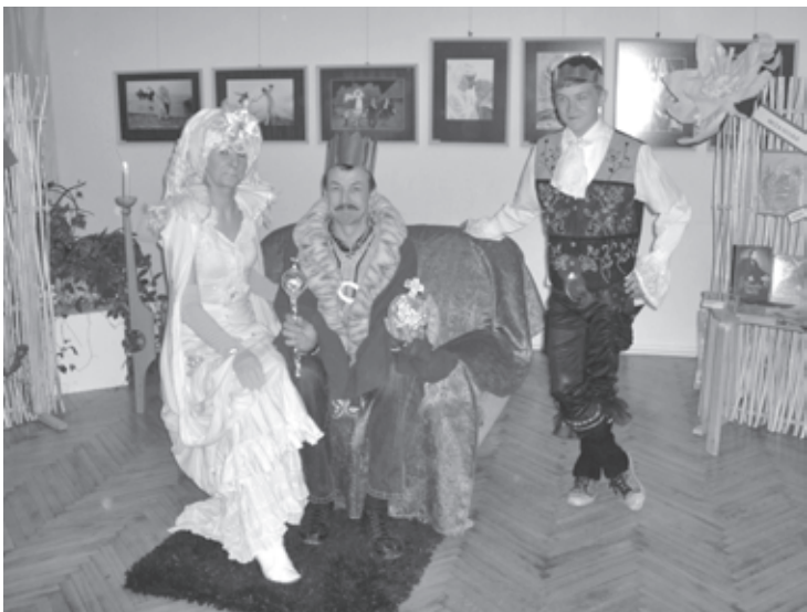
Karaliskā svīta Bibliotēku naktī

Cīravas bibliotēkā Bibliotēku nedēļa norisinājās visai spraigi un interesanti. Pirmo reizi bijām ieplānojuši atvērt bibliotēku saviem apmeklētājiem visai neparastā laikā- naktī no sestdienas uz svētdienu. Vēlajā vakara stundā visi bibliotēkas logi bija gaiši, visur skanēja jautra mūzika un apmeklētājus sagaidīja pasaku tēlos pārtapuši bibliotēkas darbinieki – Karalis ar savu svītu, Sniega karaliene un Stingrā madāma. Pasākums ar nosaukumu „Nesēdi tumsā!” bija pulcējis ap četrdesmit interesentus-vecākus ar bērniem, skolu jauniešus un bibliotēkas darbinieku ģimenes locekļus.