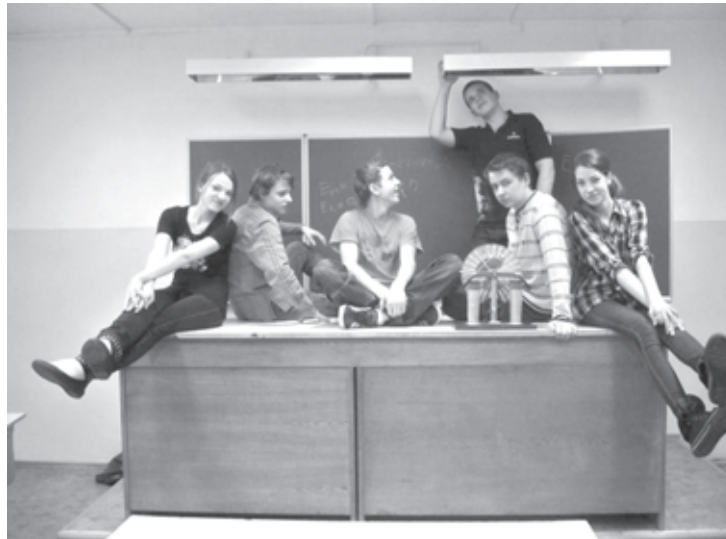
Kazdangas pamatskolas komanda

Koncerns “Latvenergo” katru gadu rīko erudīcijas konkursu “EXPERIMETS” 8. un 9. klašu skolēniem (pamattēma – elektrība). Šajā mācību gadā pirmo reizi nolēma piedalīties arī mūsu skolas 9. klašu skolēnu komanda “Zibšņi”. Konkurss aizsākās 1. februārī un tā noslēgums – labākās komandas noskaidrošana būs 7. maijā. Bija paties prieks, ka skolēni visu šo laiku ir izturējuši, cītīgi strādājuši un rezultātā Māteru Jura Kazdangas pamatskolas “Zibšņi” kā labākā komanda pārstāvēs Kurzemes reģionu konkursa fināla tiešraidē.