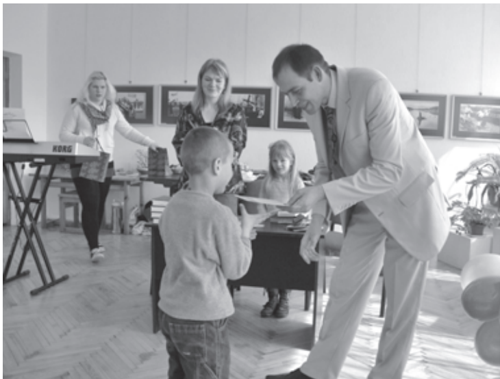
Skolas beidzējs saņem apliecību

Sestdienas rītā, 16. aprīlī Cīravas pagasta pārvaldes zālē uz savu izlaidumu pulcējās bērni, kuri trīs mēnešu garumā apmeklēja Aizputes Vasarsvētku draudze Bībeles apmācības kursu „Lielais ceļojums”.