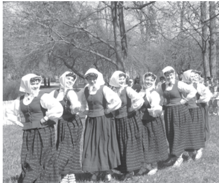
Aizputes vidusskolas dejotājas