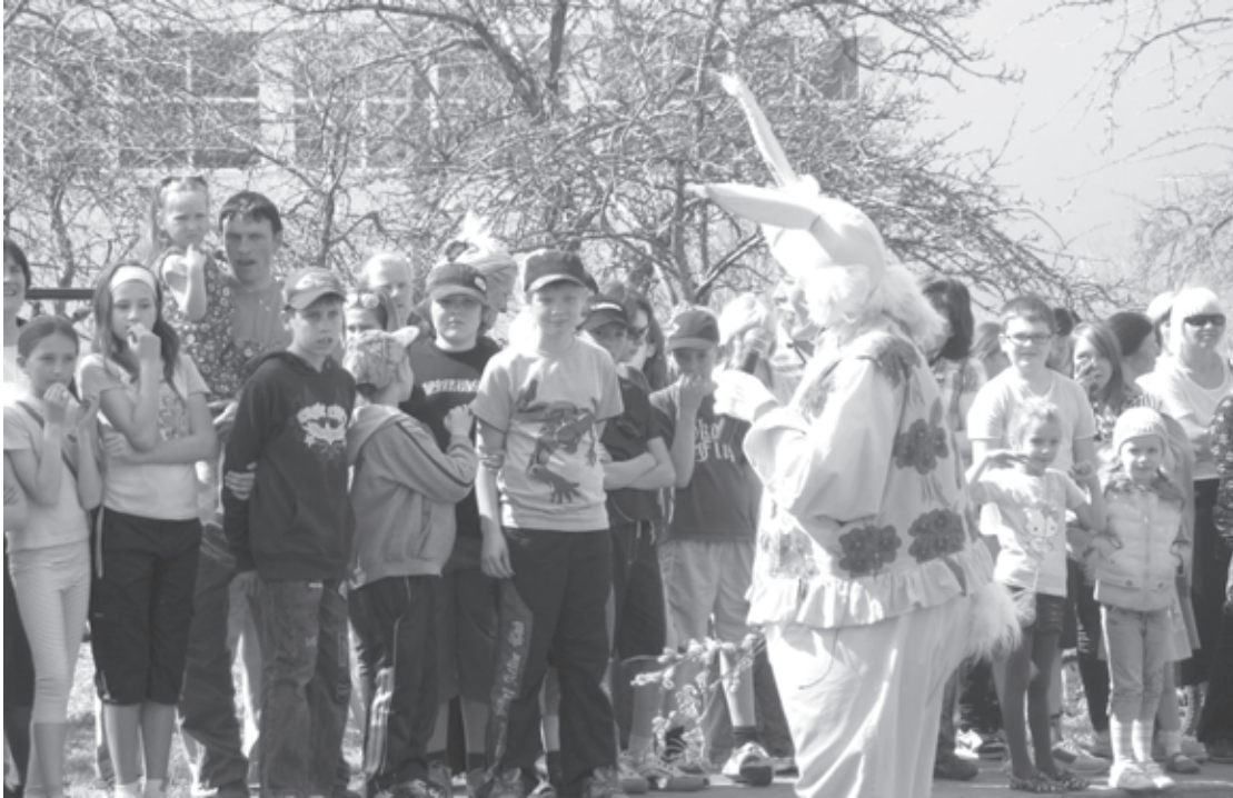
Liieldienu Zaķis Aizputē aicina uz kopīgām dejām un rotaļām

Klausījosi, brīnījosi, Kas aiz kalna gavilēja: Liieldieniņas braukšus brauca, Asnus veda vezumā.