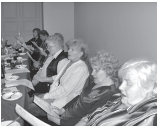
Kopā skan labi

Zaļās ceturtdienas pēcpusdienā Kultūras nama mazajā zālē aktīvākie pagasta seniori pulcējās uz Lieldienu iesvētīšanas pasākumu „ Kad sniegpulkstenis piebalso Lieldienu zvaniem ”.