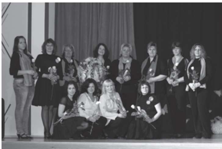
Kalvenes Kultūras nama sievietes vokālais ansamblis

Pavasaris ne tikai priecē mūsu sirdis, bet liek arī paskatīties uz ziemas mēnešos paveikto. Pavasaris ir gadalaiks, kad pagasta Kultūras nama pašdarbnieki paši vērtē savus darbus un tos vērtēt ļauj arī citiem.