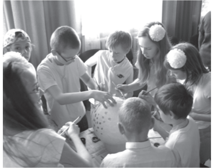
Skolēni radoši darbojas Lieldienu pasākumā

Lieldienu nedēļa skolā iesākās ar izstādi „Garausīts zaķīts”, kad no Aizputes pagasta malu malām skolā bija salēkuši dažādi zaķi – pavisam 50 jauki un jautri garauši. Tie omulīgi izvietojās pa skolas telpām un pārsteidza katru, kas ienāca skolā. Ceturtdien tie aizceļoja uz Saietu namu, lai izrādītu sevi arī pārējiem pagasta iedzīvotājiem.