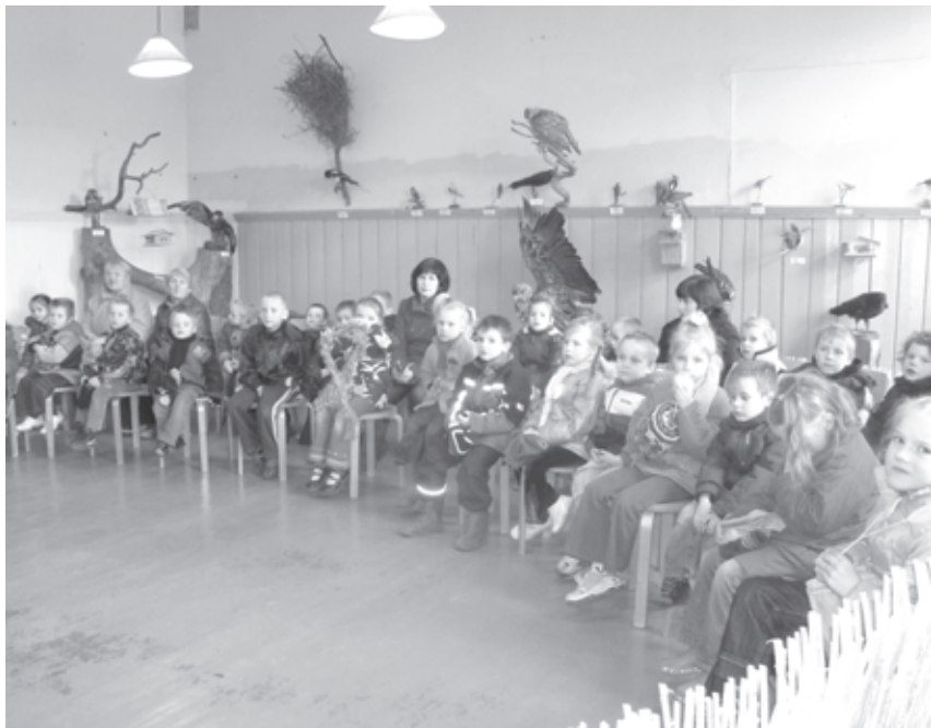
Skolēni klausās stāstījumu par putniem

ar ornitologu PII „Ezītis” bērniem bija iespēja katram uzzīmēt putnu, Māteru Jura Kazdangas pamatskolas bērniem – atbildēt uz viktorīnas jautājumiem, izspēlēt spēli „Barā drošāk”, veikt dažādus citus uzdevumus saistībā ar putniem. Daudzus interesus piesaistīja putnu būrīšu naglošana sadarbībā ar Aizputes mežniecības darbiniekiem.