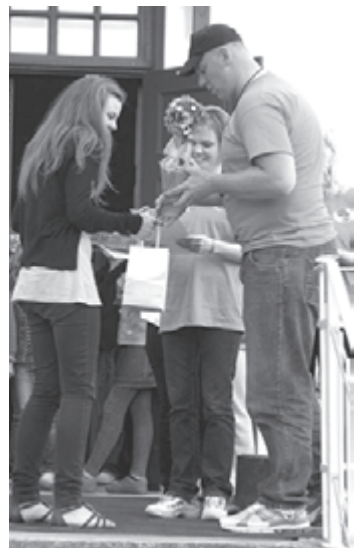
Skolēnu rallija komandu apbalvošana

iespējamie punkti. Nogurušas, bet sportiska azarta pilnas finišā iebrāuca visas skolēnu ekipāžas. Kamēr tiesneši skaitīja punktus, skolēnu rallija dalībnieki varēja uzmundrināt vēderus ar SIA „Juna – 1” sarūpēto gardo zupu, kura pēc spraigās rallija cīņas garšoja pavisam labi. Varēja dalīties