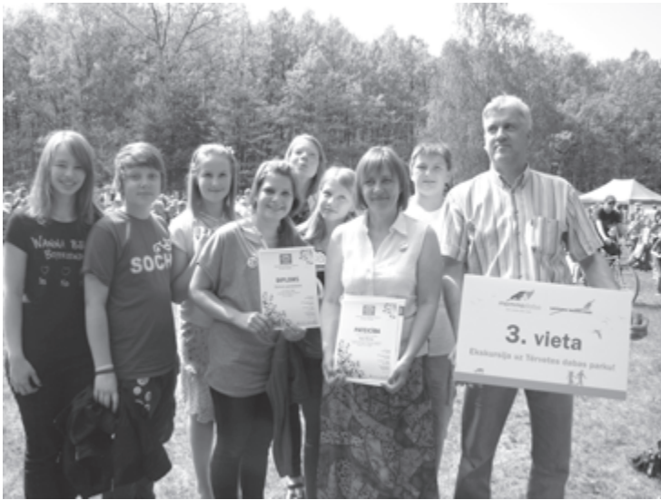
Mēs jau sen to bijām pelnījuši

Ir noslēdzies pirmais mācību gads, kopš Dzērves pamatskola iesaistījās ekoskolu programmā. Tā ir vides izglītības programma, kas veicina izpratni par vidi, saistot to ar daudziem mācību priekšmetiem. Tā veido pozitīvu attieksmi, interesi par vidi un līdz ar to arī vēlmi rīkoties, pie tam procesā iekļaujot ne tikai skolas dzīvē iesaistītos, bet arī apkārtējo sabiedrību, tādējādi veicinot kopējo vides apziņas attīstību. Visa mācību gada garumā aktīvi darbojamies, lai dzīvotu dabai draudzīgāk.