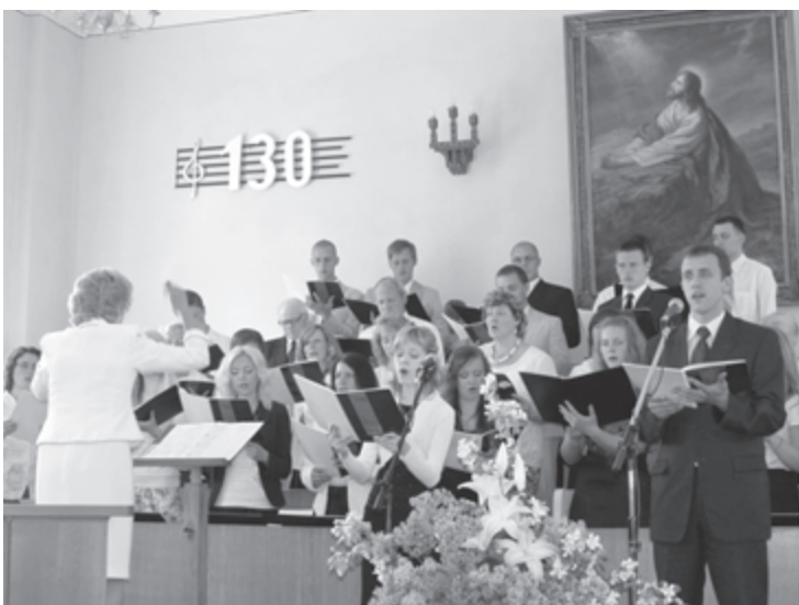
Dzied Aizputes baptistu draudzes koris

Ik gadus, atnākot maija mēnesim, Aizputes baptistu draudzes koris gatavojas svinēt savu dzimšanas dienu, aicinot ciemiņus no tuvākām vai tālākām draudzēm. Parasti šajos svētkos pie mums ir ciemojušies kādi dziedātāji vai dziedātāju grupas. Taču šoreiz lielās jubilejas reizē nolēmām, ka aicināsim „savējos” - mūsu bijušos kora dziedātājus, kas šobrīd vai nu vairs nedzied, vai nu kalpo citās draudzēs, vai arī dzīvo ārpus Latvijas. Kad