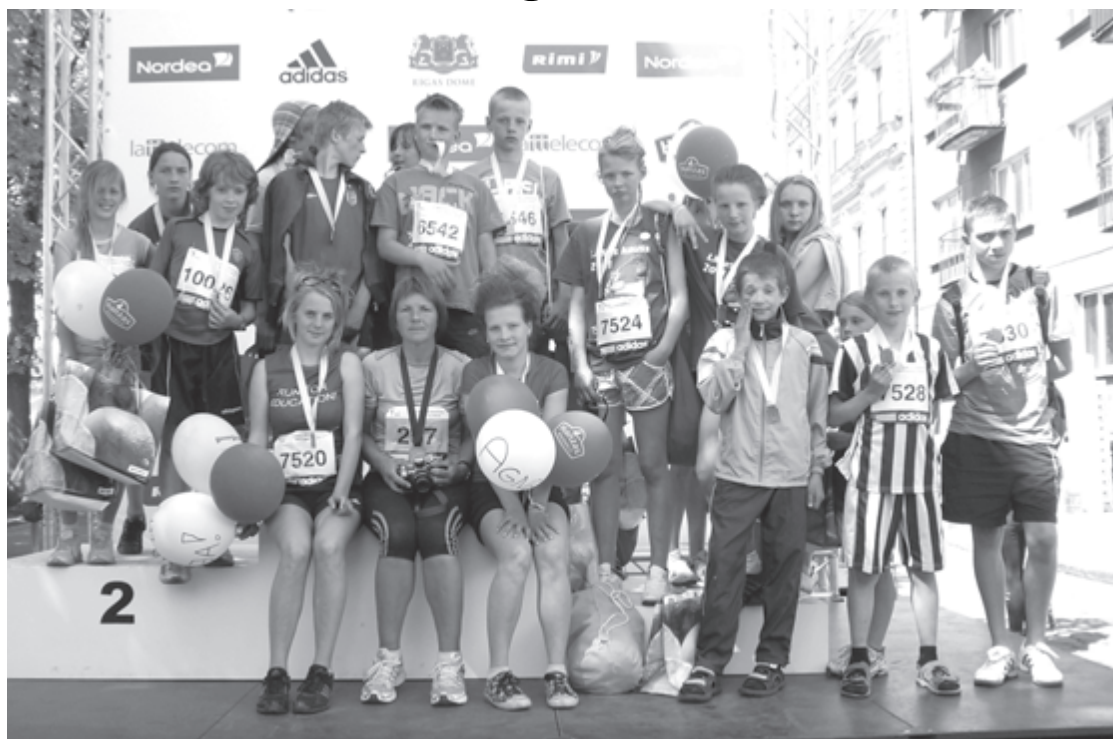
Aizputes novada maratonisti