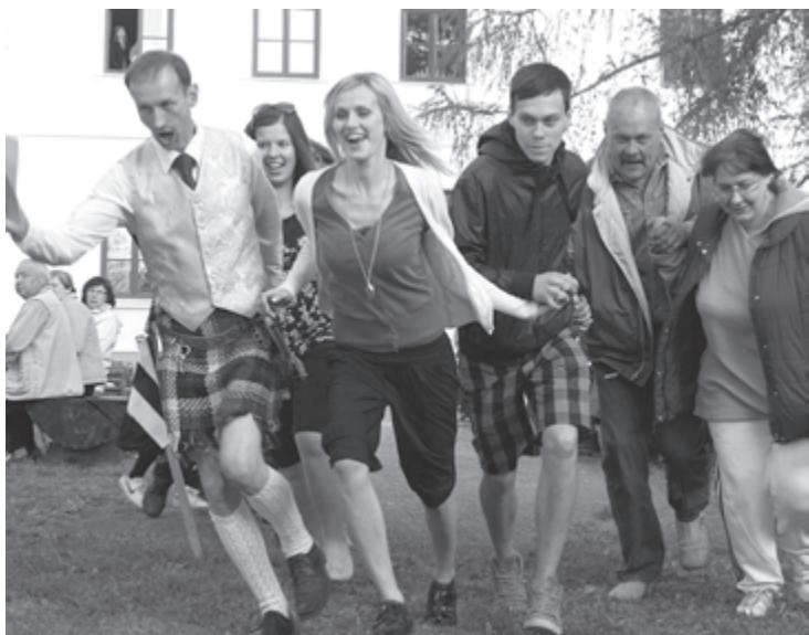
Pieaugušo rallija starts

2011. gada 14. maijā jau septīto reizi visa Latvija iesaistījās starptautiskā akcijā - Muzeju nakts, šoreiz ieskatoties sava kaimiņa sētā, jo šogad Muzeju nakts bija ar devīzi „Kaimiņi” . „Kaimiņu būtība” nozīmē gan kopīgus svētkus, gan kopīgu darbu, gan kopīgas bēdas un kopīgus priekus.