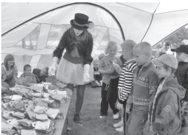
Katram tika dāvana no Klauniņa