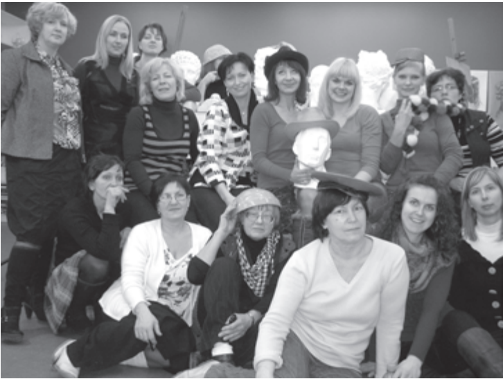
Ventspils mākslas studijas „VINcenta” dalībnieces

Līdz 29. jūnijam Aizputes novadpētniecības muzeja izstāžu zālē ir apskatāmi Ventspils mākslas studijas