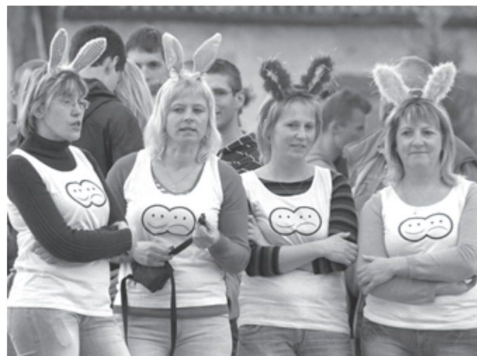
Pieaugušo rallija ekipāža “Zaķenes” pirms starta