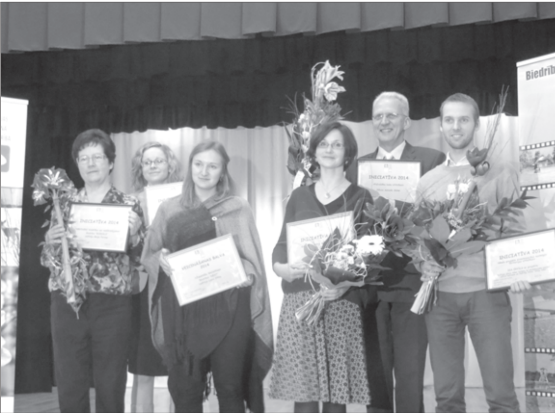
Daļa no veiksmīgajiem projektu realizētājiem

17. oktobrī Cīravas Kultūras namā biedrība "Liepājas rajona partnerība" rīkoja gadskārtējo konferenci "Dzīves kvalitātes