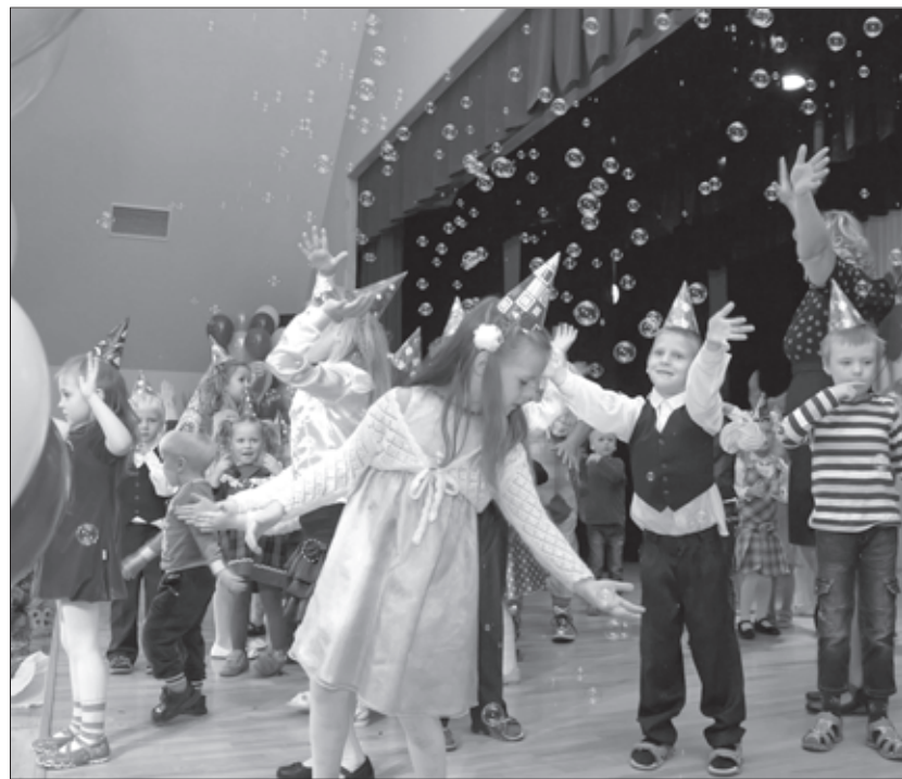
Mirkļi no bērnudārza “Pīlādžītis” jubilejas pasākuma

Nākošajā dienā mums visiem bija daudz atbildīgāks uzdevums - koncerta sniegšana un arī patīkams uzdevums - dāvanu un apsveikumu saņemšana. Mēs visi, bērnudārza darbinieki,