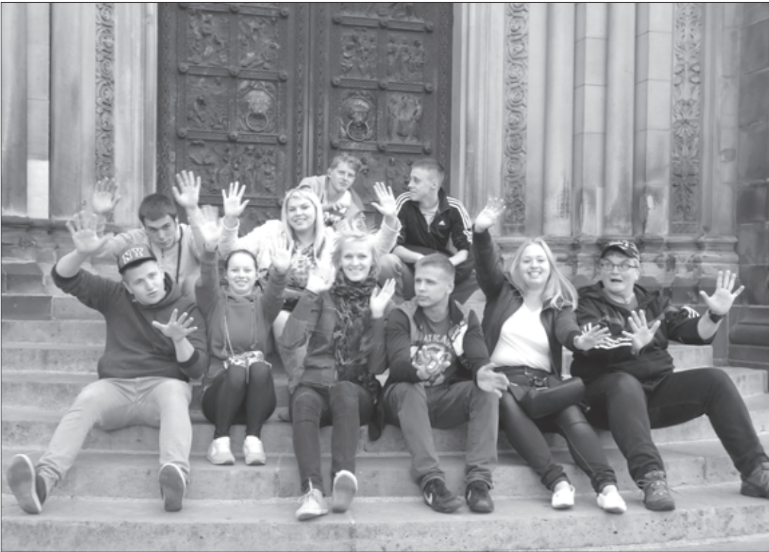
Praktikantu grupa uz Brēmenes Doma kāpnēm

Pašā mācību gada sākumā, laikā no 9. septembra līdz 14. oktobrim deviņi Cīravas Profesionālās vidusskolas jaunieši devās mācību praksē uz Vācijas pilsētu Brēmeni, lai piecas nedēļas strādātu dažādos uzņēmumos un iepazītos ar darba iespējām Vācijā.