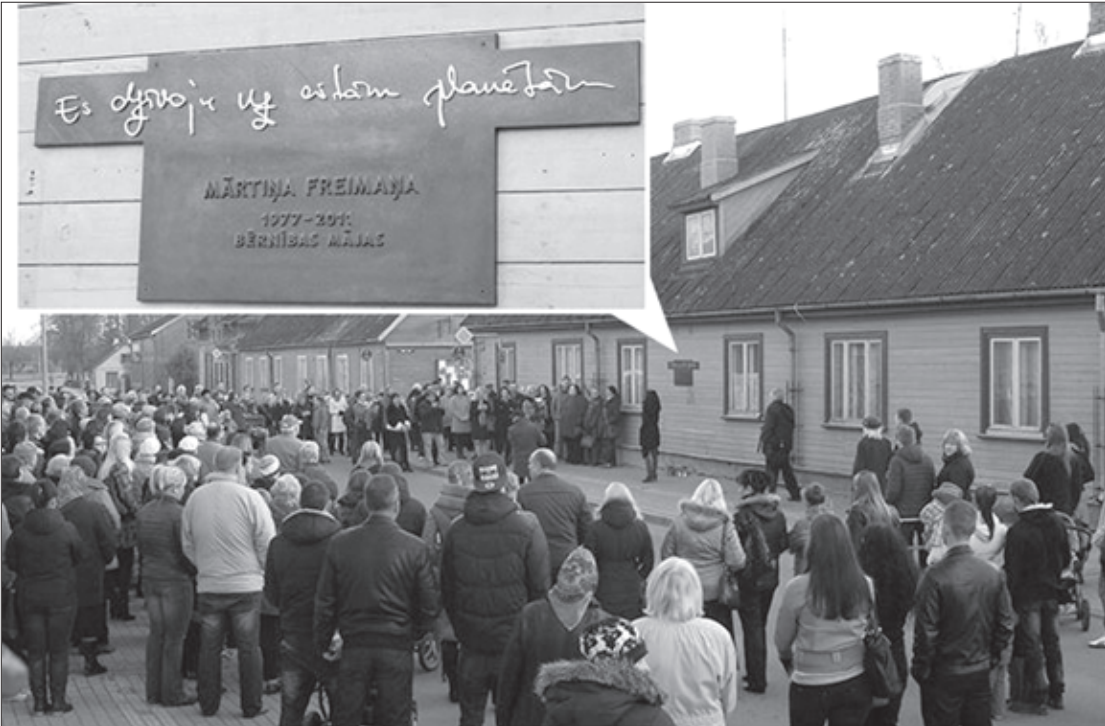
Piemīnas plāksnes atklāšana pie Mārtiņa Freimaņa bērības mājas Kalvenes ielā 30

9. novembrī Aizputē pulcējās Mārtiņa Freimaņa draugi un viņa dziesmu cienītāji, lai jau ceturto gadu svinētu Freimaņa Mārtiņdiena. Visas dienas garumā Aizputes ielās skanēja Mārtiņa dziesmas.