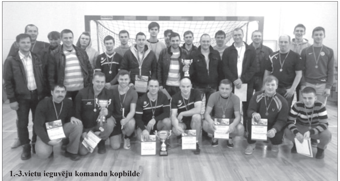
1.-3.vietu ieguvēju komandu kopbilde

Svētdien, 7. decembrī tika noskaidroti Aizputes novada 2014. gada čempionāta telpu futbolā godalgoto vietu ieguvēji vīriešiem. Līdz pat pēdējai turnīra (turnīrā tika izspēlēti 2 apļi) spēlei nebija zināmi nākošie čempioni. Svētdienas spēļu rezultāti: Apriķi - Veterāni 0:0, Rokasbirzs - Cīrava 3:1, Cīrava - Veterāni 7:0, Rokasbirzs - Apriķi 4:3.