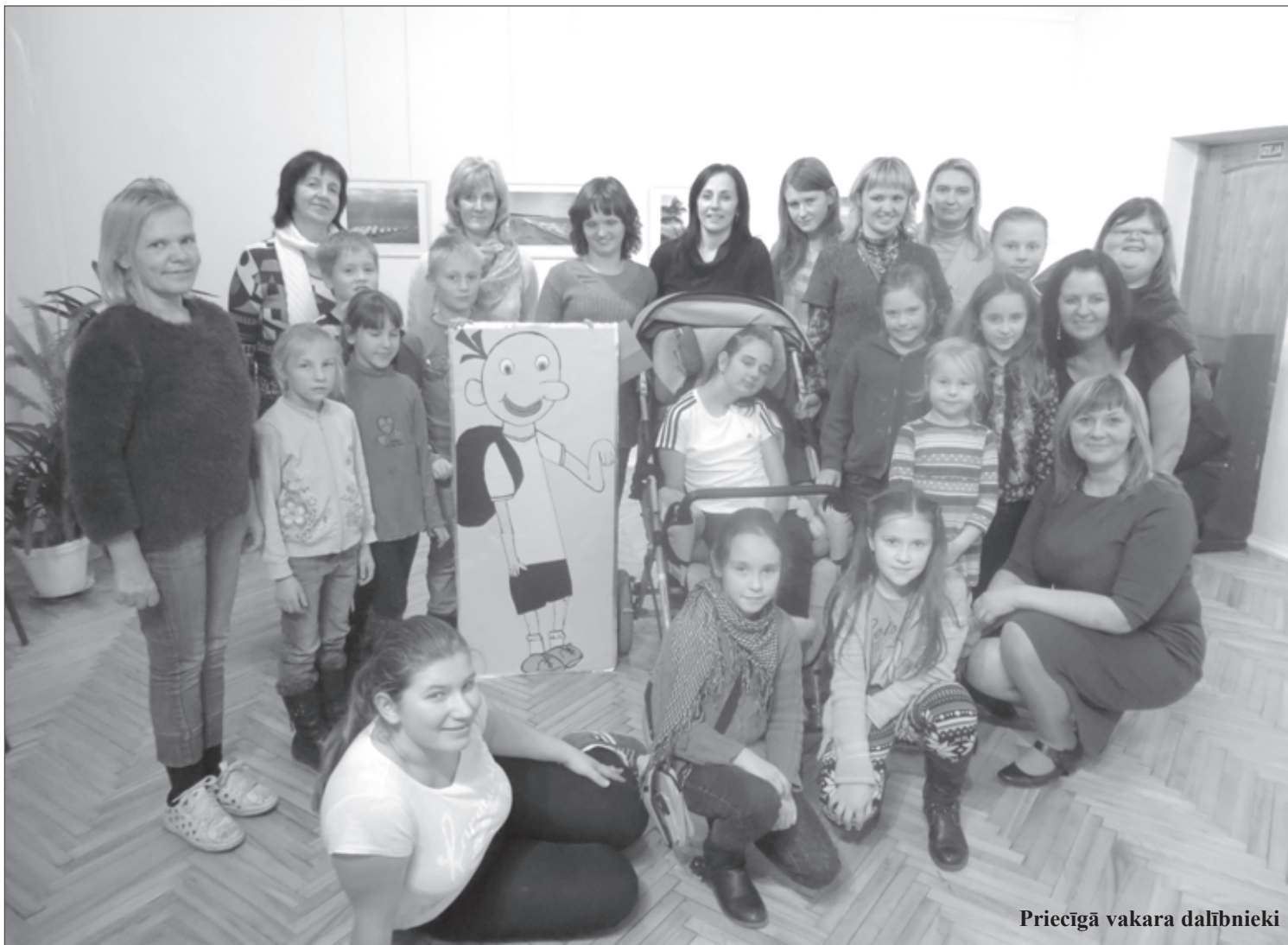
Priecīgā vakara dalībnieki