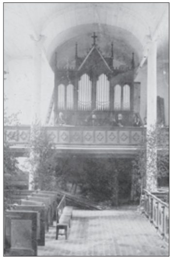
20. gs. sākuma pastkarte

1736. gada 13. septembrī Kēnigsbergā Piltenes ķeizariskās konsistorijas piesēdētājs