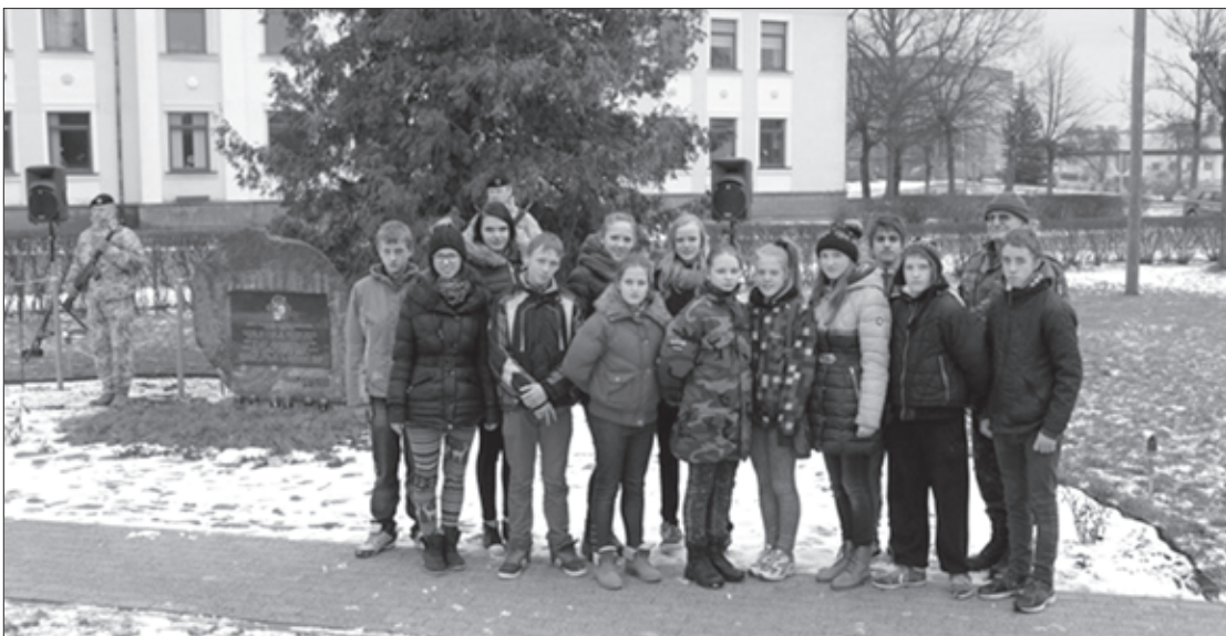
414.Aizputes jaunsargu vienības komandas pēc sacensībām Skrundas Karoga dienas piemiņas vietā

414.Aizputes jaunsargu vienības sešas komandas 29. janvārī piedalījās Skrundas Karoga dienas pasākumos, kas veltīti O.Kalpaka vadītai vēsturiskajai kaujai par Skrundas atbrīvošanu 1919. gada janvārī. Jaunsargi veica orientēšanās sacensības "Skrundas jaunie sargi" pa vietām Skrundā, kur risinājās izšķirošās kaujas par Skrundas atbrīvošanu no lielinieku militārajām vienībām.