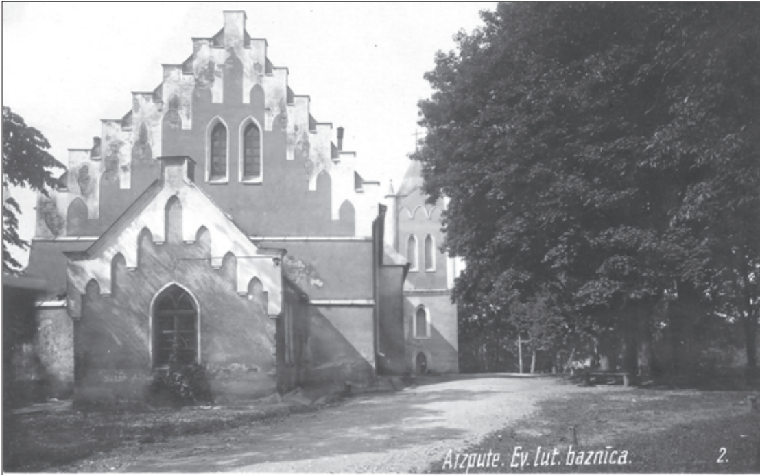
1920.-30. gadu foto