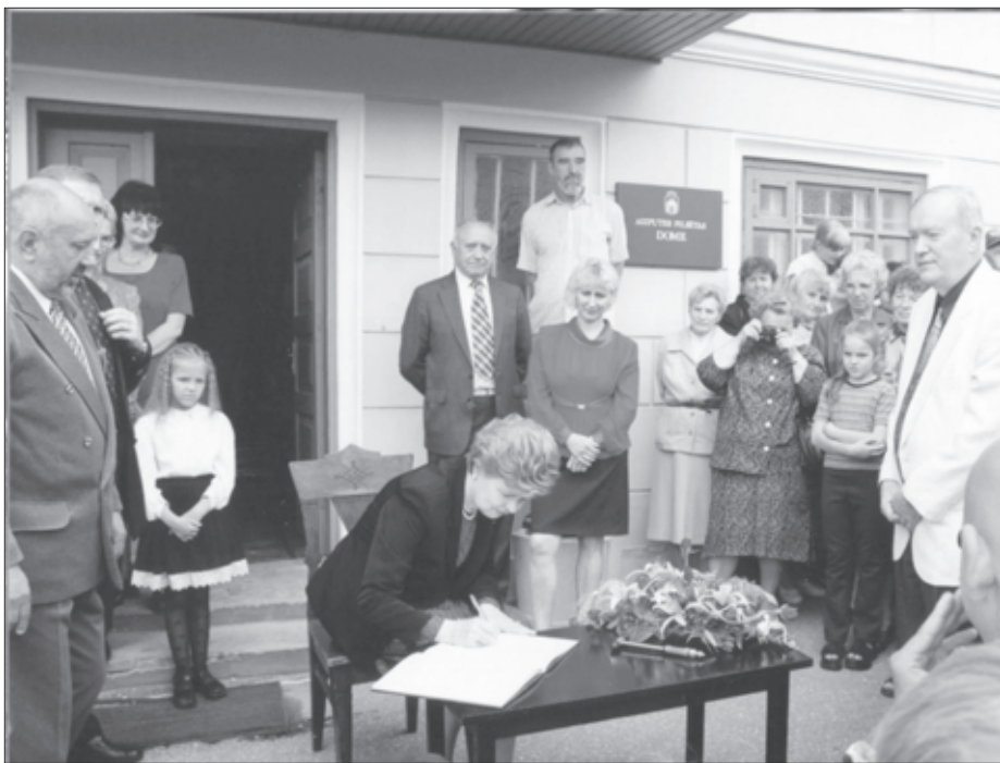
2000. gads - Valsts prezidente Vaira Vīķe Freiberga parakstās Domes viesu grāmatā

Sācies jauns gads. Īsi ieskatīsimies dažās apaļās un pusapaļās gadskārtās, uzzinot, kas Aizputes novadam ar tām saistās!