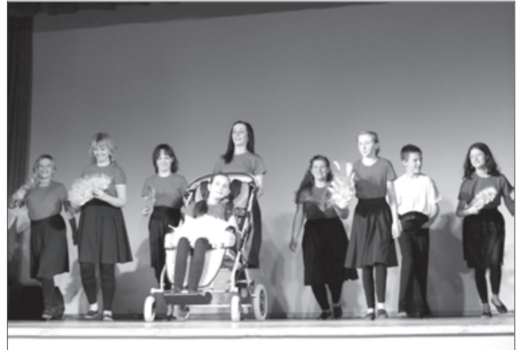
Labdarības koncertā Aizputes Kultūras namā

Marta mēnesī atbalsta centrs „Roku rokā” bērniem un jauniešiem ar īpašām vajadzībām rīkoja divus Labdarības pasākumus ar mērķi - līdzekļu piesaiste plašākas telpas labiekārtošanai.