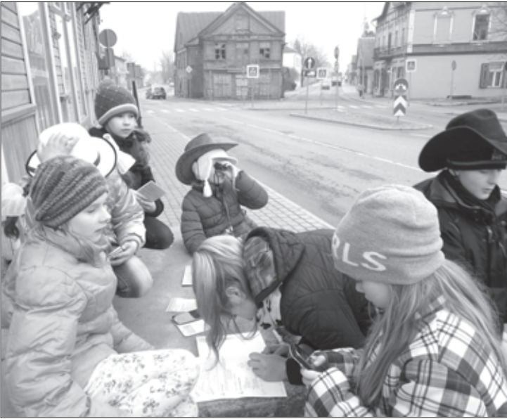
Mazpulcēni vienā no kontrolpunktiem

Esam no Aizputes 1013. mazpulka mazpulcēni un gribam pastāstīt par pasākumu, kurš mūsu mazpulkā notika 27. martā.