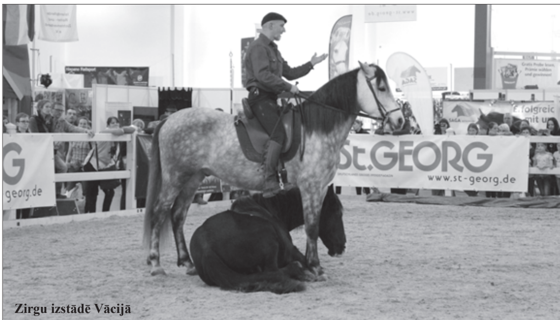
Zirgu izstādē Vācijā