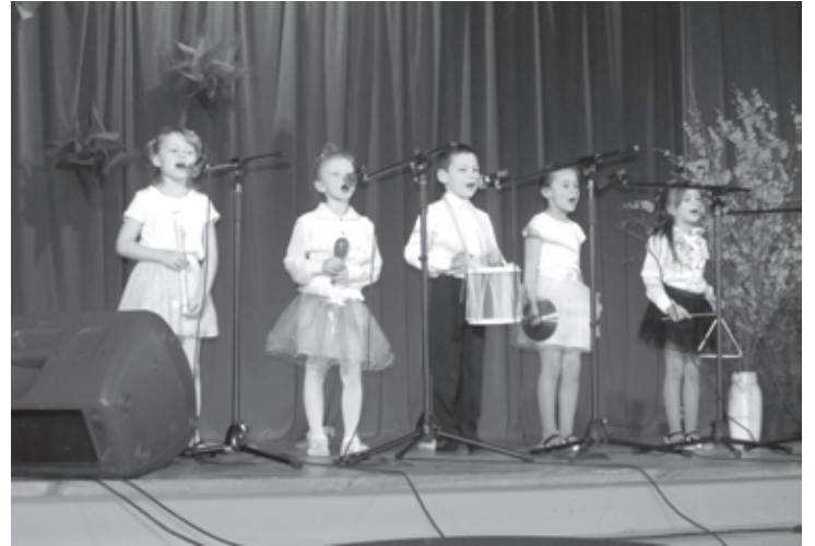
Aizputes PII Pasaciņa ansamblis „Mikimauši”

Pavasaris sevi ir pieteicis - jau kļuvis tik smaržīgs gaiss un vaļā ir dabas maiss, plaukst koši pavasara ziedi un strazdu dziesmas skan liegi!