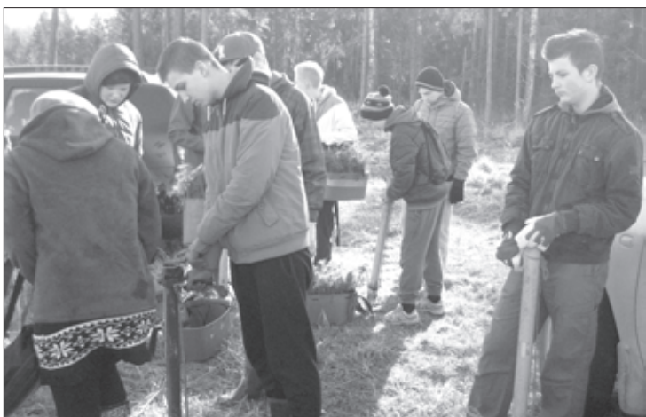
Skolēni stāda mežu

Š.g. 23. aprīlī Aizputes vidusskolas 8.b un 6.a kl. skolēni devās uz mežu stādīt priedes. Šis pasākums ir izveidojies kā laba tradīcija, jo mežu stādām ne jau pirmo gadu. Pagājušajā gadā mēs stādījām egles, un to stādīšana