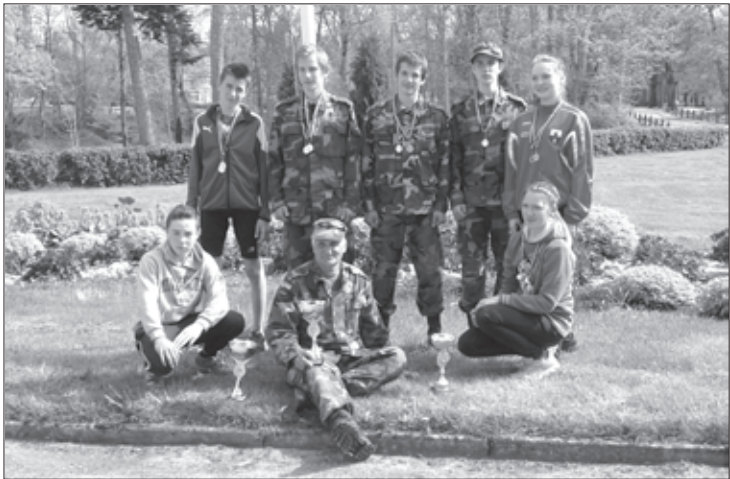
412. Kazdangas jaunsargu vienība

9. maijā Kazdangas sporta bāzē trešo reizi notika militārās daudzciņņas sacensības, kurās piedalījās Kurzemes novada jaunsargu komandas. Sacensībās piedalījās 17 jaunsargu komandas, kuras pārstāvēja Ventspili, Liepāju, Jelgavu, Skrundui, Kuldīgu, Aizputi, Rudbārzu, Nīkrāci, Laidus un Kazdangu. Jaunsargi sacentās divās vecuma grupās 4 disciplīnās: NATO šķēršļu joslā, granātas mešanā mērķī, šaušanā ar pneimatisko ieroci un skriešanā (meit. 2000m, zēn. 5000m).