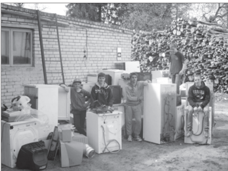
Akcijas „Štapseles ceļojums” čaklākie dalībnieki

Aprīlī Dzērves skolas komanda piedalījās Liepājas RAS organizētā nolietoto elektroierīču vākšanas akcijā „Štapseles ceļojums”. Akciju jau piekto gadu Liepājas atkritumu apsaimniekošanas reģiona skolām organizē SIA „Liepājas RAS”.