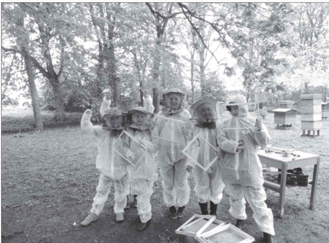
Jaunie bitenieki gatavi darbam