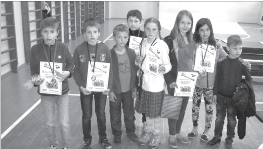
Dambretes turnīra uzvarētāji ar iegūtajām balvām

23.maijā Dzērves skolā jau piekto reizi notika dambretes turnīrs, kas veltīts Starptautiskai bērnu aizsardzības dienai. Dalībnieki ieradās no Liepājas, Kuldīgas, Aizputes, Saldus sākumskolas, piedalījās, protams, arī mūsu Dzērves pamatskolas bērni.