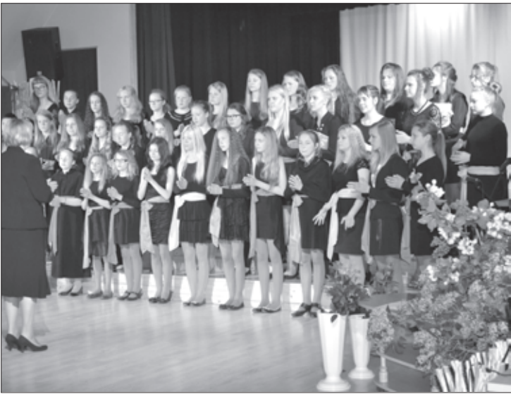
Novada kopkoris "Melodija" Cīravas kultūras namā