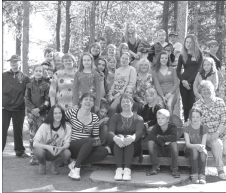
Čaklie makulatūras vācēji ekskursijā

24.maijā Apriķu pamatskolas aktīvākie makulatūras vācēji devās uz Siguldas svētkiem, kur norisinājās gada vērienīgākais vides un veselīgas atpūtas pasākums- Zaļās jostas festivāls „Tīrai Latvijai”. Šo pasākumu atbalstīja un dažādas izzinošas aktivitātes piedāvāja Latvijas zaļākās organizācijas: Latvijas meži un Cūkmens, Līgatnes dabas takas, Latvijas dabas muzejs, Latvijas ornitologu biedrība, dzīvnieku pansiņa Ulubele un vēl daudzas. Kopumā