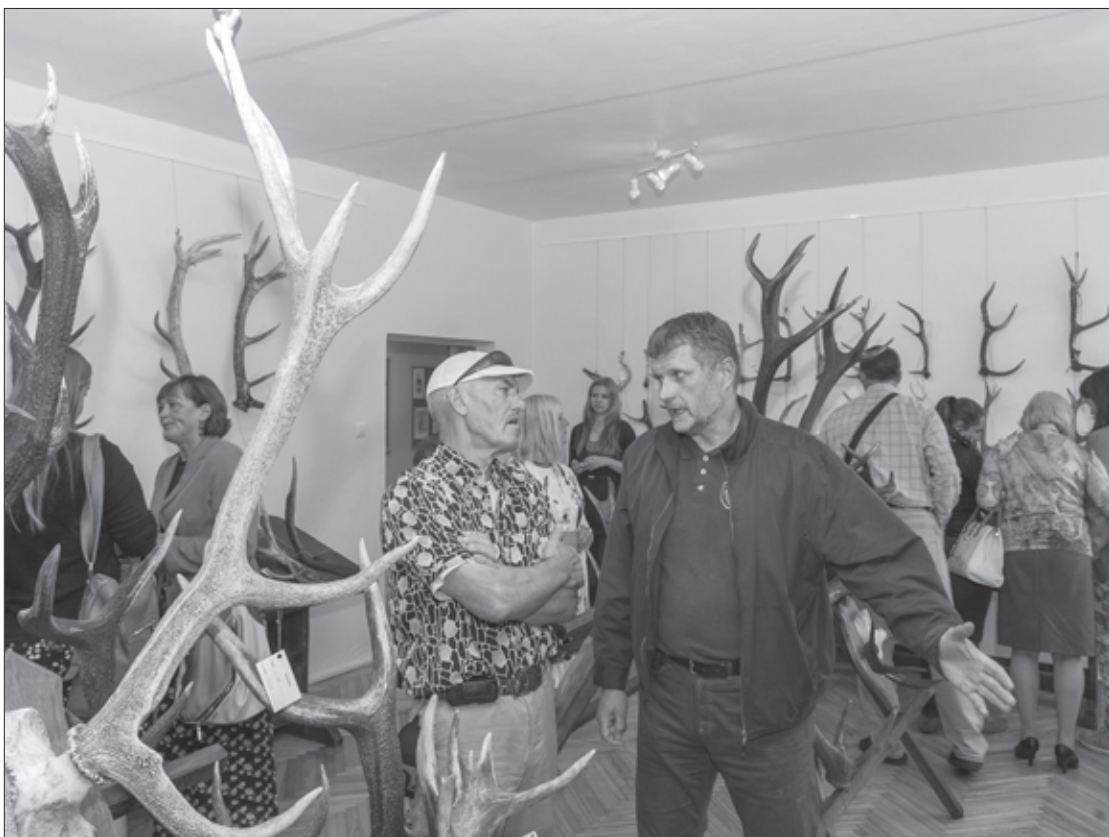
Kaislības sit augstu vilni

Tik daudz pozitīvu emociju, pārsteiguma un izbrīna vārdu Cīravas pagasta bibliotēkas zālē sen nebija piedzīvots kā 18. septembra pēcpusdienā. Todien tika atklāta atrasto briežu un aļņu ragu izstāde, ko sadarbībā ar pagasta ļaudīm bija sarūpējusi biedrība „Mednieku klubs „Avots”” (vienkāršāk – Cīravas mednieki).