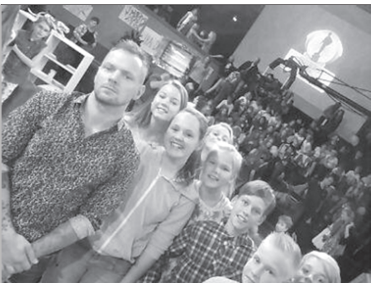
Aizputnieki televīzijā kopā ar spēles vadītāju

Arī šogad televīzijas erudīcijas spēlē "Gudrs, vēl gudrāks" piedalījās skolēni no Aizputes vidusskolas.