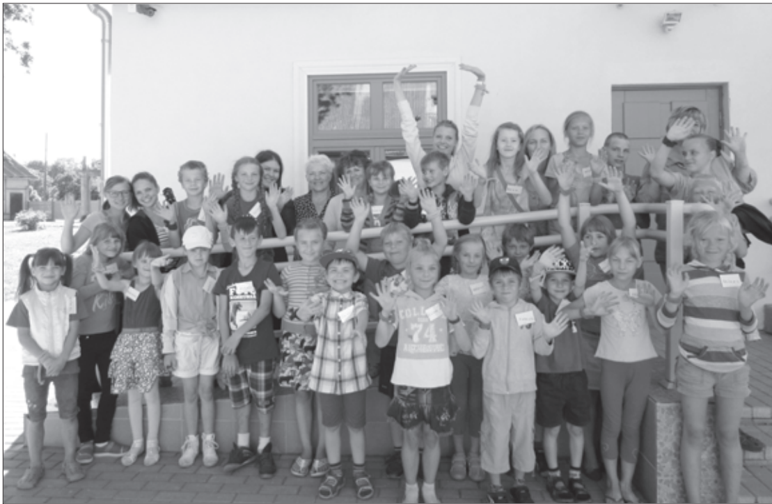
Biedrības “ŠĪLO” projekta “Izzini savu pasauli, novērtē to, kas Tev apkārt!” dalībnieki

Ir noslēdzies biedrības “ŠĪLO” projekts “Izzini savu pasauli, novērtē to, kas Tev apkārt!”, kuru līdzfinansēja Aizputes novada dome.