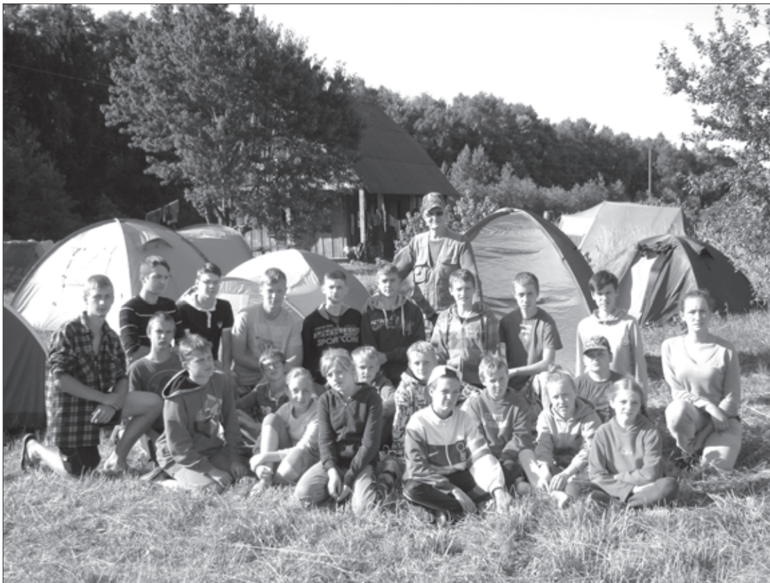
Bērnu vasaras nometnes dalībnieku grupa

Šogad Aizputes novada pašvaldības līdzfinansētā bērnu un jauniešu valstiski patriotiskā nometne notika Ventspils novada Jūrkalnes pagastā vēsturiskā vietā pie „Cerību buras” laikā no 27. jūlija līdz 2. augustam. Nometnē piedalījās 28 dalībnieki no Aizputes, Cīravas un Kalvenes. Nometnes programmā bija pārgājieni, ekskursijas, viktorīnas un prezentācijas par Latviju un tās bruņoto spēku vēsturi, vakaru uguns kuri un muzikāli pasākumi, tūrisma un sporta vingrošanas aktivitātes. Katrai nedēļas dienai bija savs saturs un nosaukums: tūrisma diena, pārgājēju diena, militārā diena, radošās amatniecības diena, sporta diena un vēstures studijas.