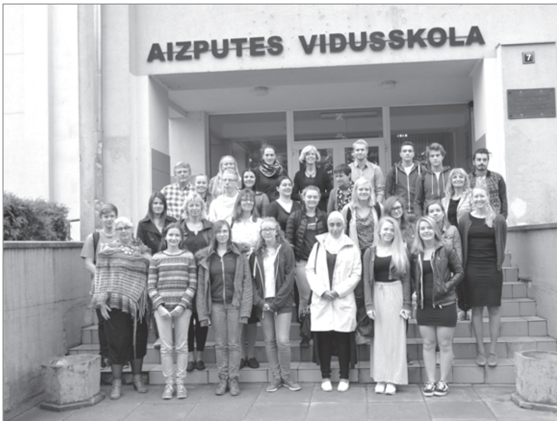
Projekta dalībnieki pie Aizputes vidusskolas

Aizputes vidusskola jauno mācību gadu uzsāka ar jaunu, starptautisku, ERASMUS + KA 2 aktivitātes atbalstītu projektu „Get infected to be protected”. Laikā no 13.09. līdz 19.09.15. Latvijā notika pirmā projekta aktivitāte, kurā piedalījās 25 skolēni un skolotāji no Gymnasium Donauwörth (Vācija), Liceo Statale „Coluccio Salutati” (Itālija), Cristeljik College Groevenbeek (Nīderlande), Os gymnas (Norvēģija), kā arī Aizputes vidusskola. Projekta mērķis ir iepazīstināt jauniešus ar daudzveidīgām slimībām, to izplatības ceļiem, profilaksi, jo, ja esi informēts, esi pasargāts!