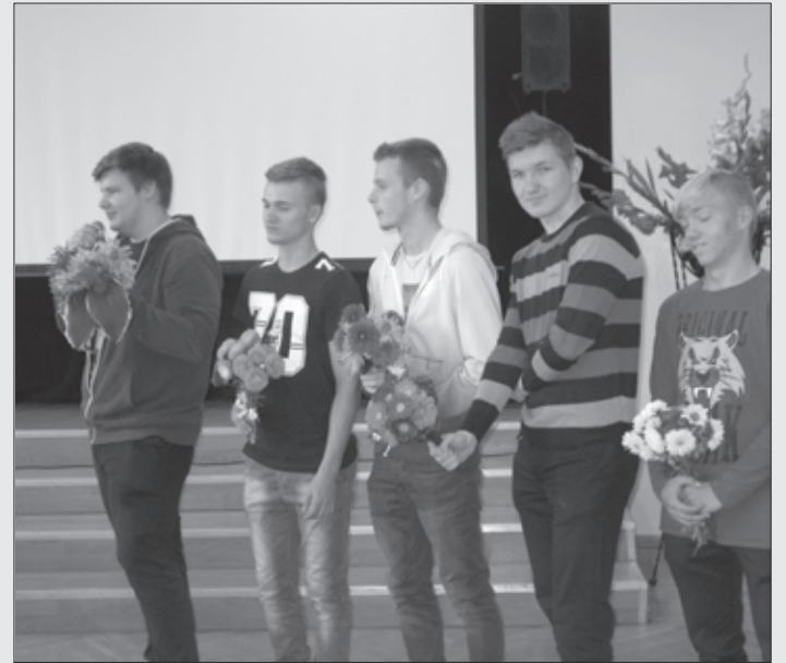
Puiši no 12. klases sveic skolu dzimšanas dienā

15. septembris ir diena, kad Aizputes vidusskola atzīmēja savu 94. pastāvēšanas gadadienu. Skolā valdīja svētku noskaņa. Nedēļas garumā skolēni gatavoja visdažādākos apsveikumus: grieza un līmēja, gatavojot apsveikuma kartītes, rakstīja novēlējumus, domrakstus, dzejoļus.