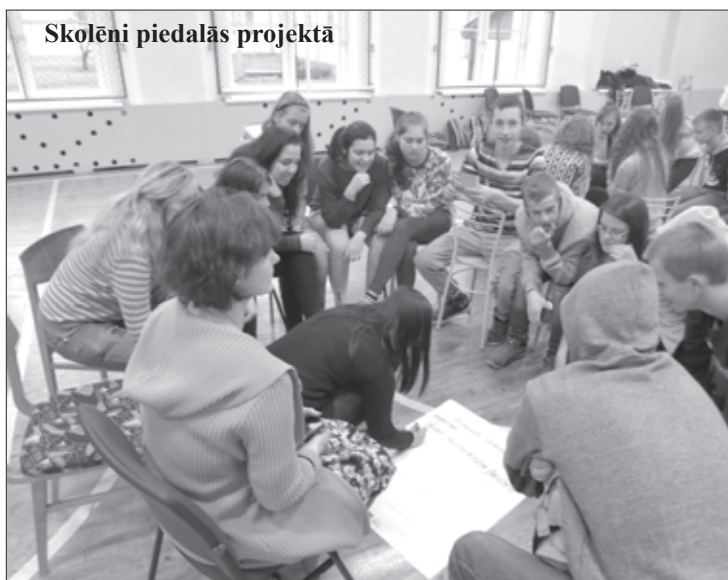
Skolēni piedalās projektā

Biedrība „Kazdangas kultūrvēsturiskais mantojums” augustā iesniedza projektu „No skolas sola līdz projektam” Latvijas Republikas Kultūras ministrijas finansētā projektu konkursa pilsoniskās sabiedrības attīstības un starpkultūru dialoga jomā “Iesaisties Kurzemē!” un ieguva finansējumu 500 eiro apmērā.