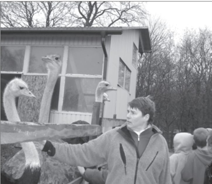
Ekskursijas dalībnieki priecējas par lielākajiem putniem pasaulē