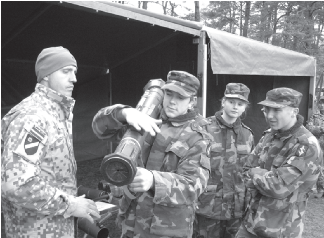
Lāčpēša balvas izcīņas sacensībās Liepājā, Beberliņos 06.11.2015.

Šogad oktobra sākumā es sāku apmeklēt jaunsargu nodarbības. Šķita, ka aiziešu maksimums uz divām nodarbībām un man apniks, bet notika tieši pretējais – man tās tik ļoti iepatikās.