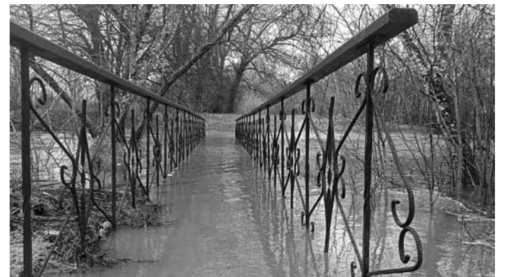
„Jau ceturto reizi šoziem applūdis tiltiņš pār Ēnavas upi Kuldīgas novada Raņķos.” Fotografēts 18.02.2022. ap 11.00.