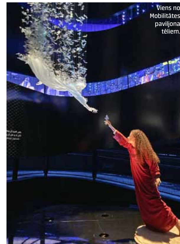
Viens no Mobilitātes paviljona tēliem.

Latvijas paviljonā – izstāžu zāle, kurā ir mūsu pašu radīts pasaulē ātrākais elektrokartings.