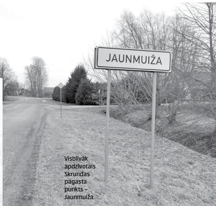
Visblīvāk apdzīvotais Skrundas pagasta punkts – Jaunmuiža.

Savukārt V. Brūdere atbild: „Pašlaik transporta plūsma ir pielāgota skolēniem un strādājošajiem. Autobusi no Skrundas