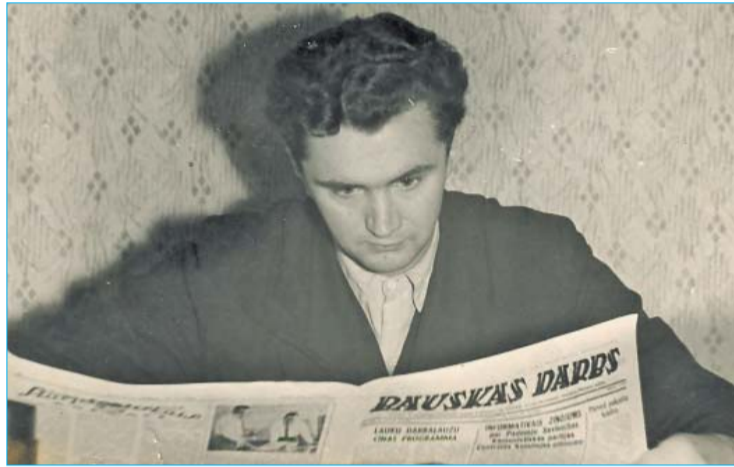
Jānis Dimants jaunībā 20. gs. 50-to gadu beigās

2021.gada 28. oktobra Līvānu novada domes sēdē deputāti lēma piešķirt augstāko Līvānu novada apbalvojumu – "Līvānu Goda pilsonis" – Līvānu novada Jersikas pagasta iedzīvotājam, Triju Zvaigžņu ordeņa kavalierim, ilggadējam LTV ziņu raidījuma "Panorāma" galvenajam redaktoram un žurnālistam Jānim Dimantam. Apbalvojums piešķirts par nozīmīgu ieguldījumu žurnālistikas jomā, Latvijas lauku un zemnieku darba popularizēšanā, par lokālpatriotismu, kā arī par pozitīvu Jersikas pagasta un Līvānu novada tēla veidošanu.