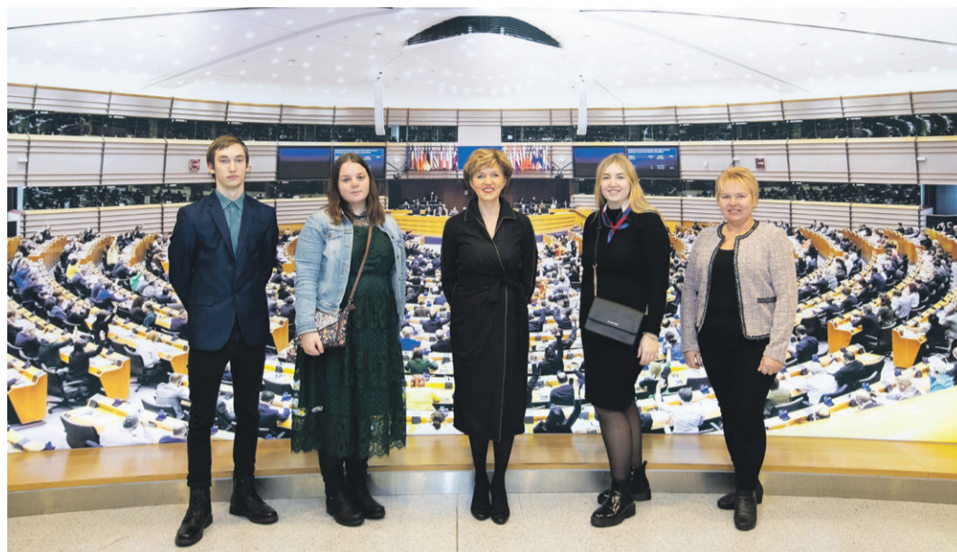
Saulkrastu novada vidusskola