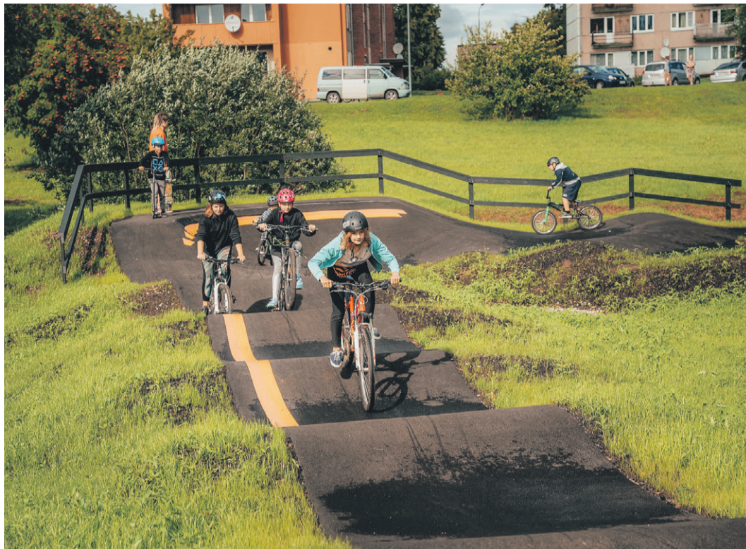
Augusta beigās atklāta jaunā Pabažu velotrase.