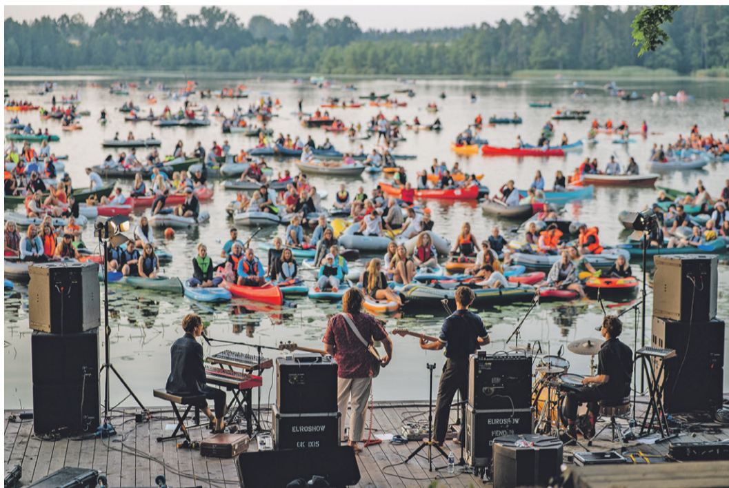
Aizvadīti pirmie Saulkrastu novada svētki mums visiem kopā! Grupas „Carnival Youth” koncerts Pabažu ezerā, saullēktu sagaidot.

Par nākamā gada budžetu: ja šogad no apvienotā Saulkrastu un Sējas budžeta pašvaldību izlīdzināšanas finanšu fondā tika iemaksāti 235 000 eiro, tad 2022. gadā jaunajam novadam būs jāsamaksā aptuveni 990 000 eiro. Neskatoties uz to, ir paredzēts neliels budžeta pieaugums, taču jāņem vērā, ka valstī ir liels sadārdzinājums visās jomās, kas būtiski skar arī pašvaldību, piemēram, iestāžu patērētajai elektrībai, ielu apgaismojumam. Būtiski ir palielināt arī darbinieku algas – šeit prioritārs ir pirmsskolas pedagogu atalgojums. Šobrīd budžets tiek izstrādāts, bet darām visu, lai nepieciešamos darbus varētu paveikt laikā.