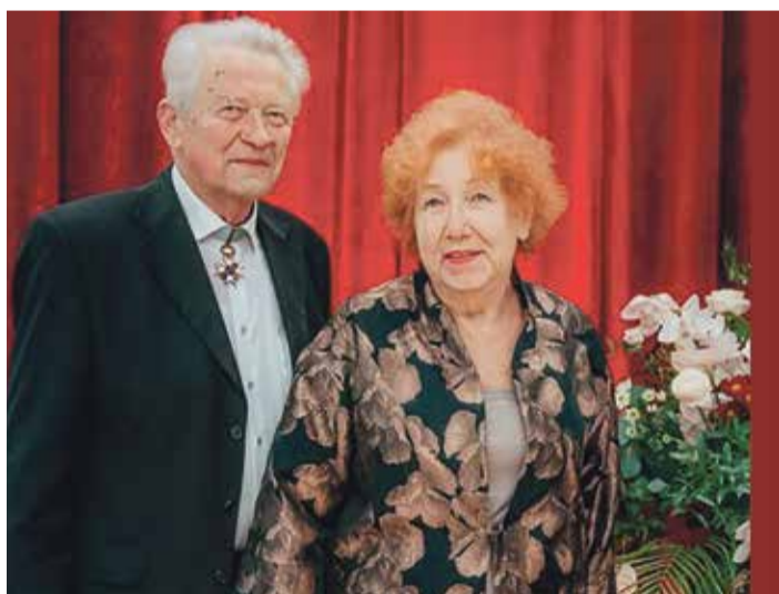
Krūmiņi: 2021. gada 18. novembrī, apmeklējot kultūras namu „Zvejniekciems” Saulkrastos.