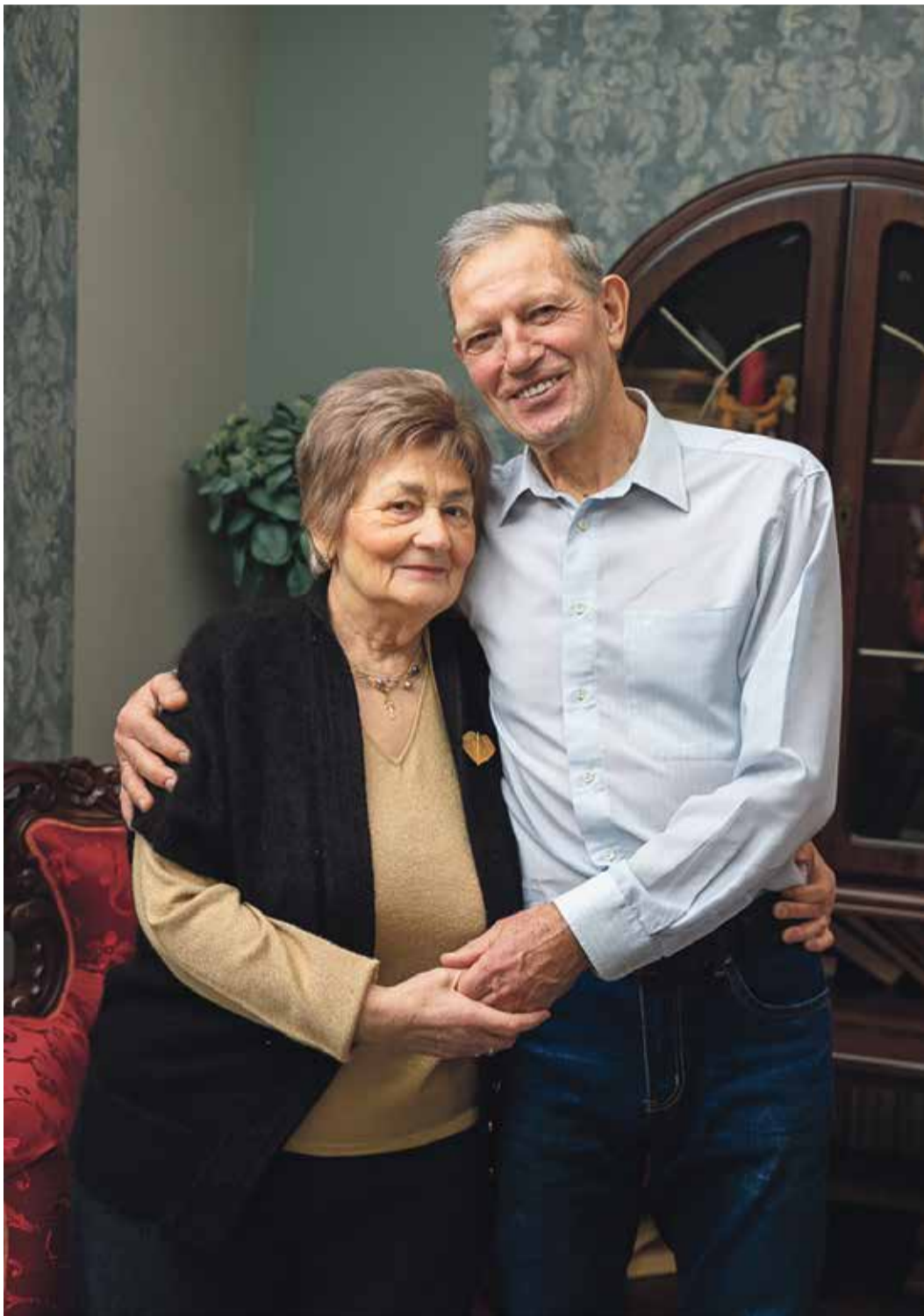
Jučmaņi: foto no 2021. gada vasaras

„Viens vienīgs vārds, un tas ir – mīlestība, un otrs vārds – lai tev ir silta sirds! Un trešais vārds – dot citiem sevi labo; tas nezudis, – tas tikai lielāks augs, lai kur tu iesi, tavi solī ziedēs, lai ko tu teiksi – tavi