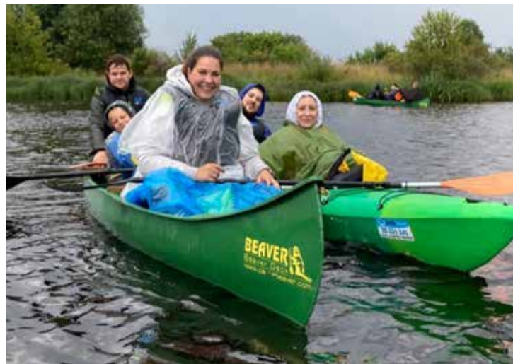
Laikapstākļi nebija šķērslis ekspedīcijas uz Nāves salu dalībniekiem.