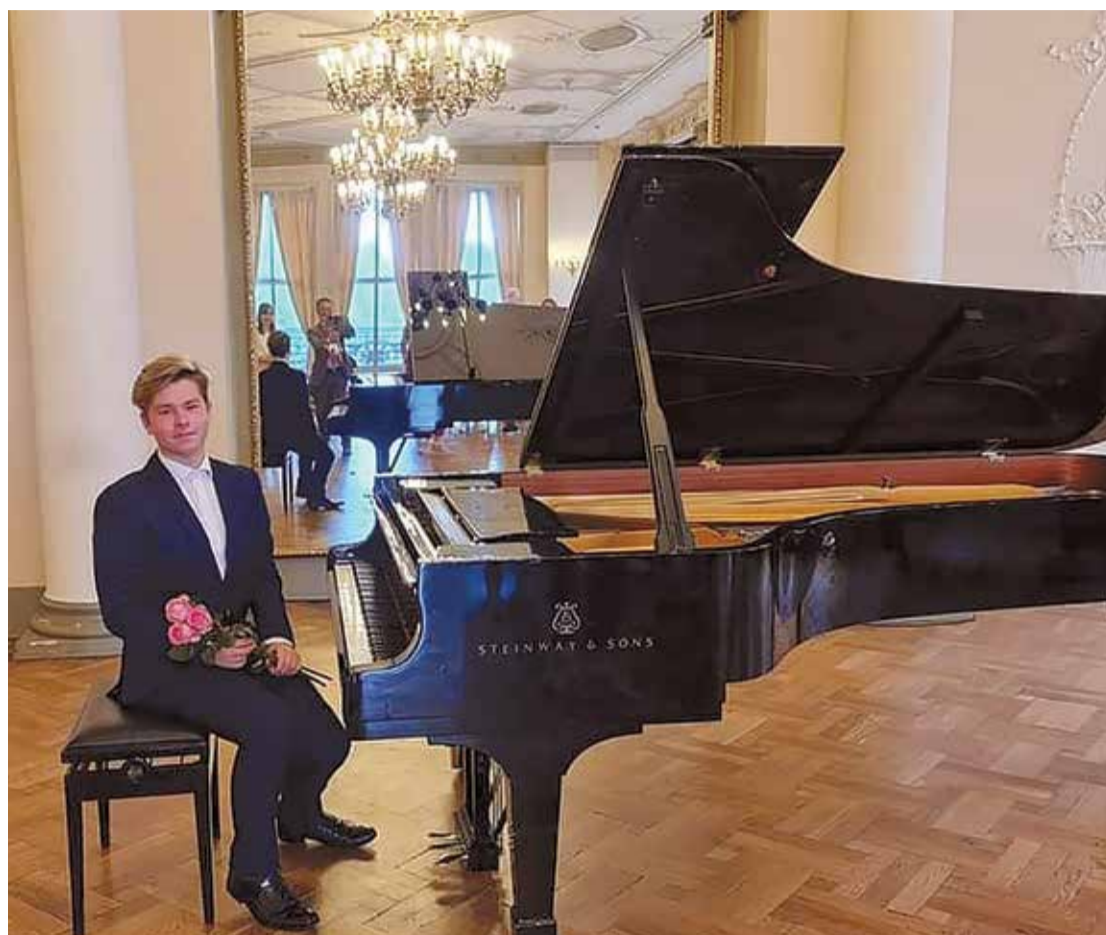
Teodora Reitera konkursa laureātu koncerts 2021. gadā Rīgā.