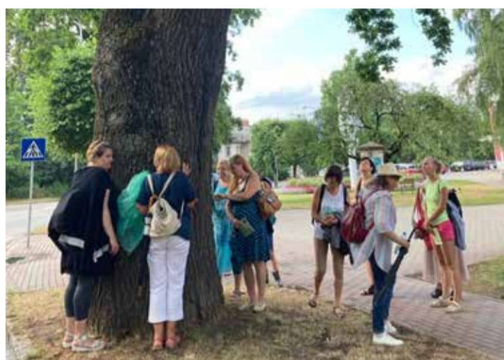
Ekskursija, kurā iepazīnām novada dižkokus.

Pagājušajā gadā pirmo reizi Salaspils novada uzņēmēji piedalījās projektā „Atvērtās dienas laukos”. Četri uzņēmēji – „Salaspils Mellenes”, „Doles tējas”, „Pennello crafts” un „Zoo Rezidence” – sniedza ieskatu savā darbībā vairāku dienu garumā.