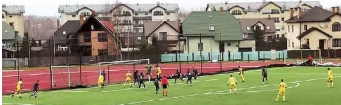
Pirmajā spēlē Salaspilī "Super Nova" tikās ar BFC "Daugavpils".

"Mājīgajā stadionā ir patīkami atrasties, viss kompakti un mobili, atmosfēra pilnībā futbola, kaut spēle bija vien kontroles. Oficiālās spēlēs emocijas būs vēl karstākas," pēc aizvadītās spēles Salaspilī teic futbolisti.