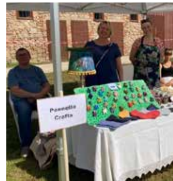
Tirdziņš Doles salā šogad bija plaši apmeklēts.

Bet septembra beigās ikvienam Salaspils uzņēmējam, amatniekam un mājražotājam bija iespēja doties pieredzes apmaiņas braucienā uz Bauskas novadu, viesojoties pie dažādu nozaru un sfēru tūrisma uzņēmējiem, tostarp