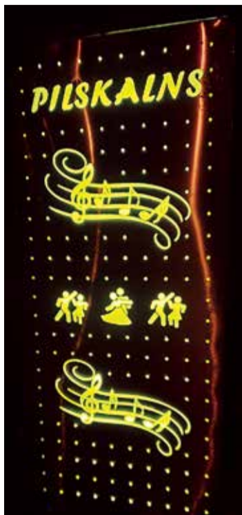
Ceļam uz Liepupes pilskalnu tagad ir sava norāde.