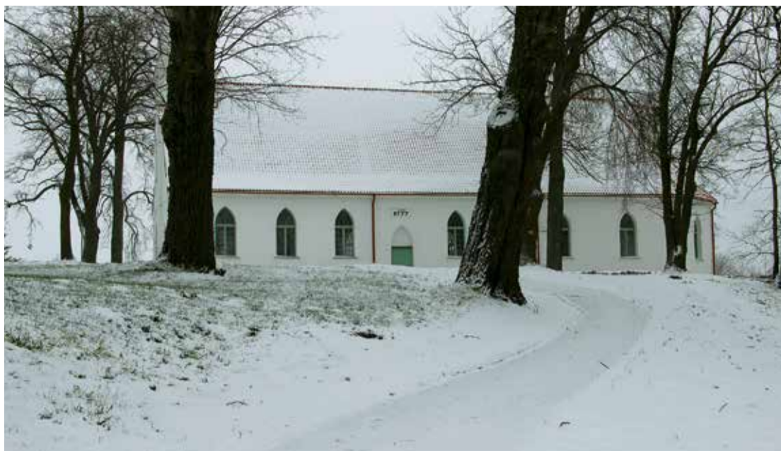
Lielsalacas evaņģēliski luteriskās baznīcas apkārtnes labiekārtošana ir pabeigta.

Mēs esam laikā, kad mūsu pilsētā notiek vērienīgi tās sakārtošanas un labiekārtoša-