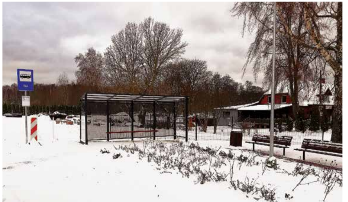
Finišam tuvojas Tūjas autoceļa mezgla un autobusa pieturas atjaunošanas darbi.