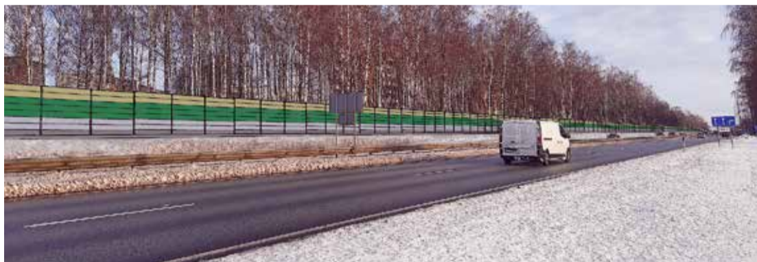
Vizualizācija ar trokšņu sienu. Skats uz Salaspils pilsētu no autoceļa A6 Rīga - Daugavpils posmā no Nometņu ielas līdz Enerģētiķu ielai.