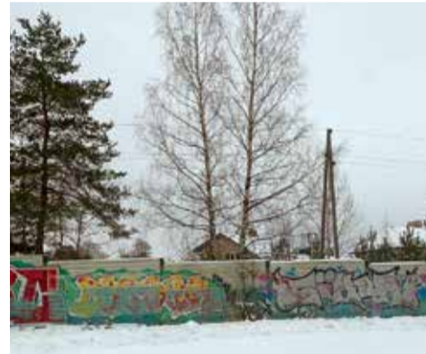
2007. gadā būvētā trokšņa barjera pie Saulkrastu apvedceļa 2021. gada decembrī

izbalējušais krāsojums jāatjauno. Kas netiek atjaunots, var pārliecināties vienā no retajām Latvijas vietām, kur tādās gar valsts ceļiem izbūvētas - pie Saulkrastu apvedceļa (skat. attēlu). Saulkrastu gadījumā vairākos posmos tā ir divreiz zemāka nekā Salaspili plānotā, bet pat to atjaunot ceļa apsaimniekotājam ir problēma.