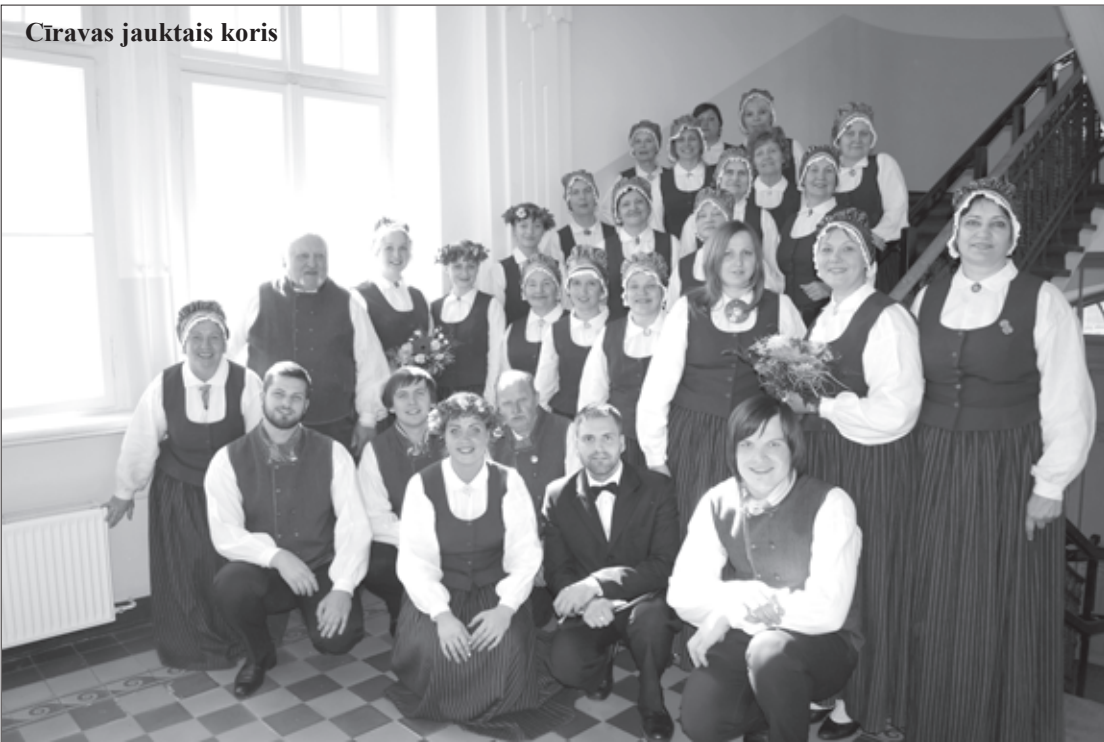
Cīravas jauktais koris

Pavasaris ir laiks, kad dažādu nozaru pašdarbības kolektīvi rāda savu sniegumu, piedaloties skatēs. Arī mūsu novada dziedātāji, dejotāji, pūtēju orķestra mūziķi stājās