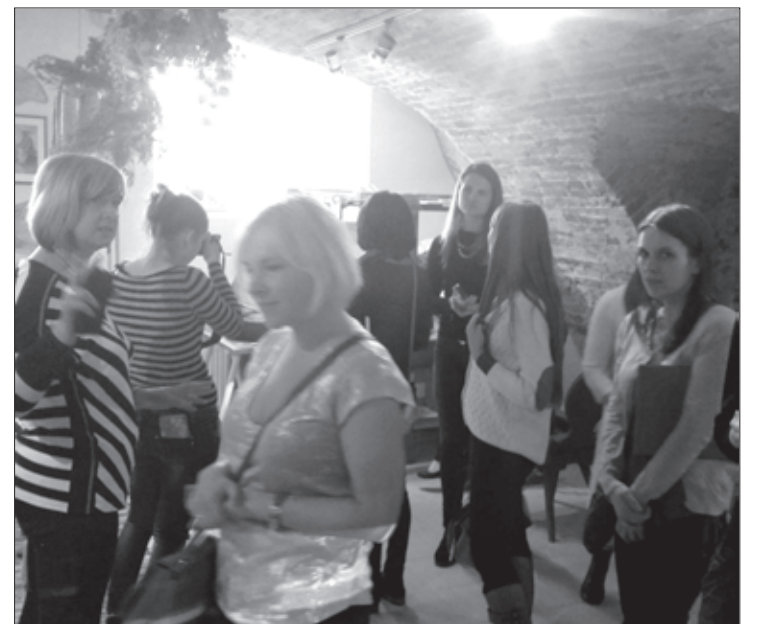
Tūrooperatori iepazīstas ar Aizputes novadpētniecības muzeja atjaunoto pagrabstāva ekspozīciju

Šī gada 14. aprīlī Latvijas tūrisma operatori tika aicināti divu dienu vizītē uz Liepāju un tās apkārtni. Vizītes ietvaros tūrooperatori viesojās arī Aizputē. Aizputē viesiem tika prezentēts labākais 2015. gada Latvijas vīns, Aizputes vīna darītava un Aizputes novadpētniecības muzeja atjaunotie pagrabi ar prasmju darbnīcu piedāvājumu. Tūrisma operatorus no tūrisma aģentūrām kā “Baltic DMC group”, SIA “Latvia Tours”, “REMIRO TRAVELS”, “Travel Biiz” un “IMPRO ceļojumi”, kā arī pārstāvjus no “Lauku ceļotājs” un tūrisma ziņu portāla Travelnews.lv uzņēma Aizputes novada Tūrisma informācijas centrs sadarbībā ar Liepājas reģiona Tūrisma informācijas biroju.