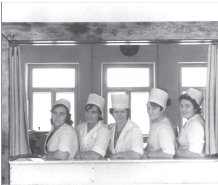
Ēdnīcas kolektīvs Valātā

Lai kavētos atmiņās un kazdandznieku atmiņu stāstos par kolhoza laikiem. Lai