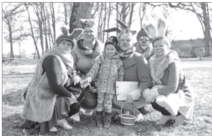
Liieldienu zaķu komanda

Liieldienu pasākums pirmdienas rītā izvērtās jauks, sportisks un krāsains. Visi atnākušie tika sadalīti piecās komandās. Katrai komandai bija iedalīta sava īpašā krāsa – rozā,