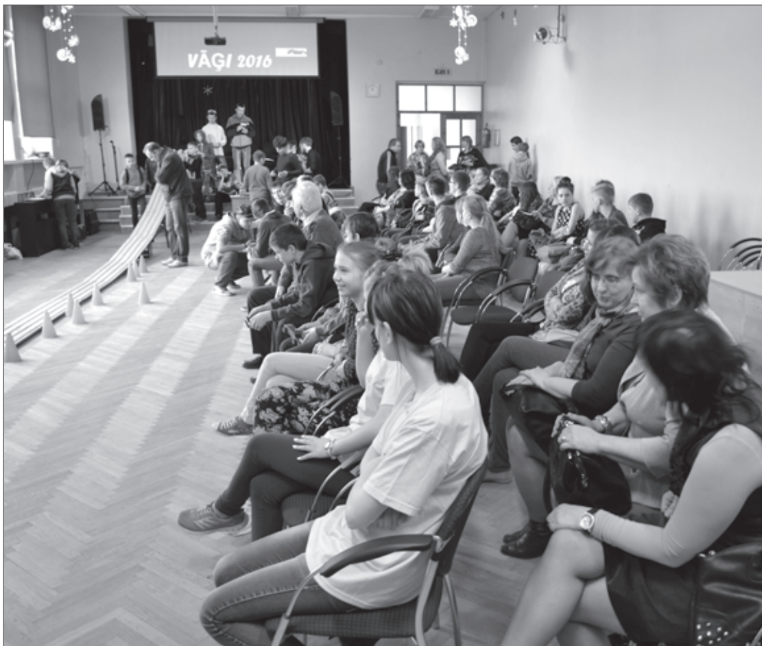
Koka automodeļu sacīkstes var sākties