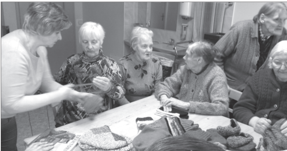
Rokdarbu stunda aprūpes centrā „Rokaiži”

19. aprīlī Cīravas pagasta „Sirds siltuma” pulciņa rokdarbnieces iejutās skolotāju, padomdevēju lomā – viņas devās uz pansionātu „Rokaiži”, lai turienes interesentu pulciņam ierādātu dažādu rokdarbu tapšanu.