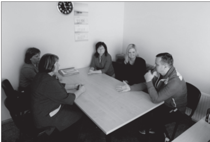
Sporta medicīnas centra pārstāvju vizīte Aizputē

Valsts sporta medicīnas centra (turpmāk – Centrs) ārstniecības personas no 4. – 8. aprīlim devās uz Liepājas rajona sporta skolu (turpmāk – LRSS) Vaiņodes, Grobiņas un Aizputes sporta centriem, lai sportistiem un bērniem ar paaugstinātu fizisko slodzi veiktu veselības aprūpi, t.i., padziļināto profilaktisko medicīnisko pārbaudi (turpmāk – medicīnisko pārbaudi).