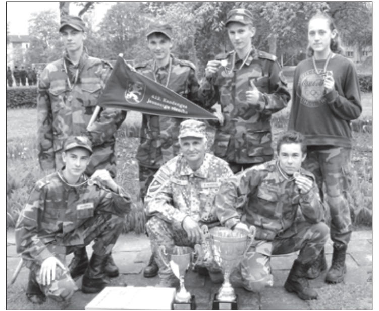
Kazdangas jaunsargu vienība

14. maijā Skrundas novadā O. Kalpaka Rudbāržu pamatskolas apkārtnē notika Jaunsardzes un informācijas centra 1. novada nodaļas Kurzemes "Vīru spēles" par godu O. Kalpakam.