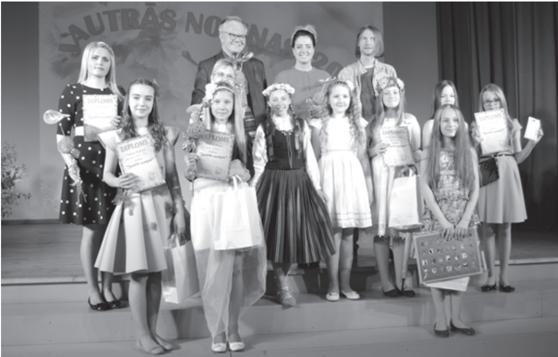
Vokālistu konkursa vecākās grupas solistes un žūrijas dalībnieki