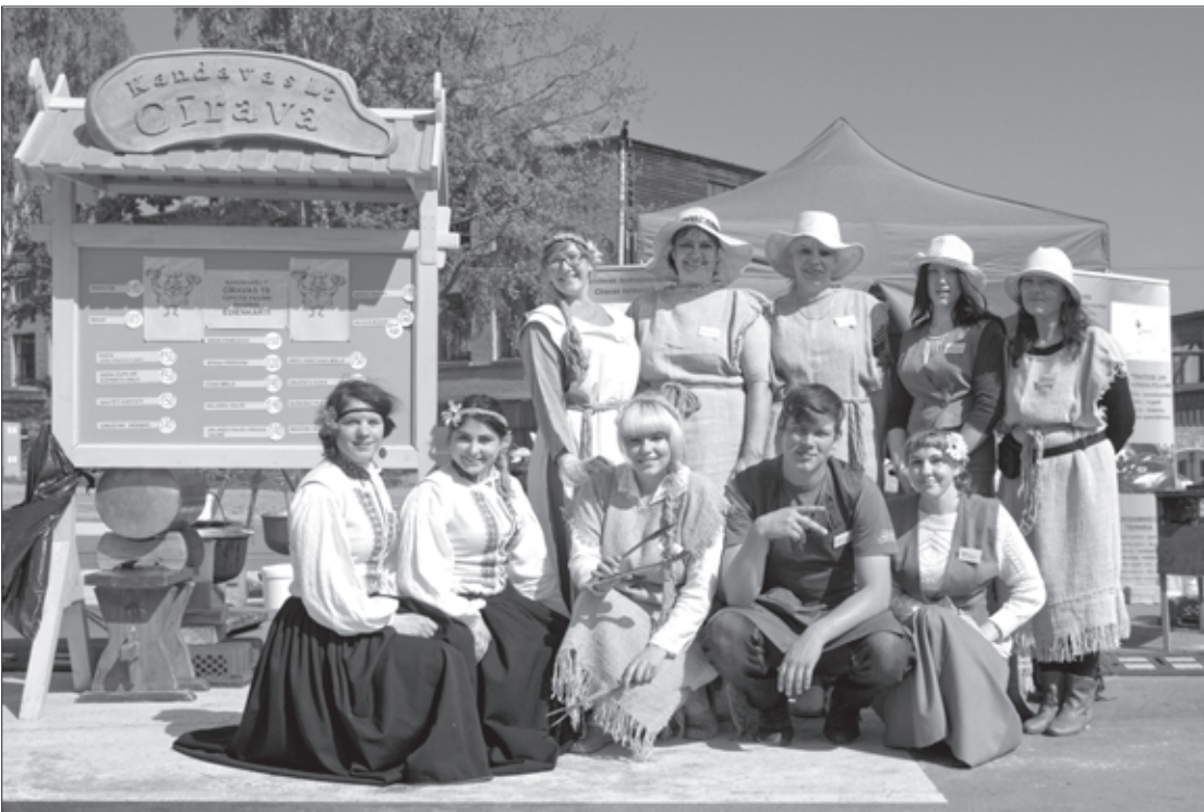
Kandavas LT Cīravas teritoriālās struktūrvienības Līvas tirgus komanda

21.maijs Kandavas LT Cīravas teritoriālās struktūrvienības topošajiem pavāriem bija notikumiem bagāts.