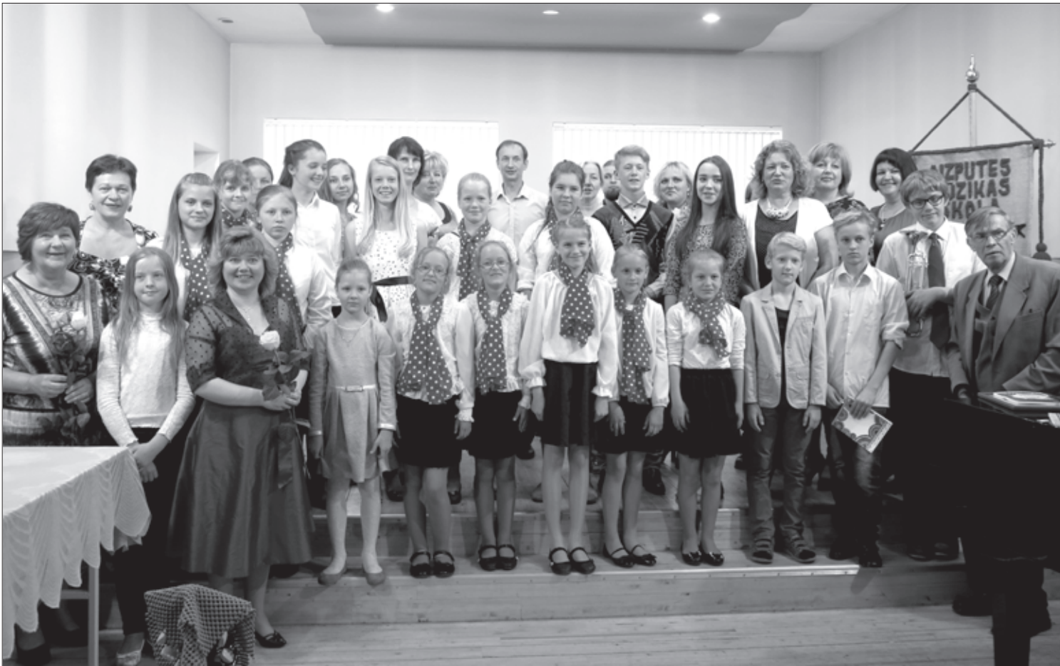
Profesionālās ievirzes un interešu izglītības pedagogi un audzēkņi pieņemšanā pie domes priekšsēdētāja Aizputes Mūzikas skolā