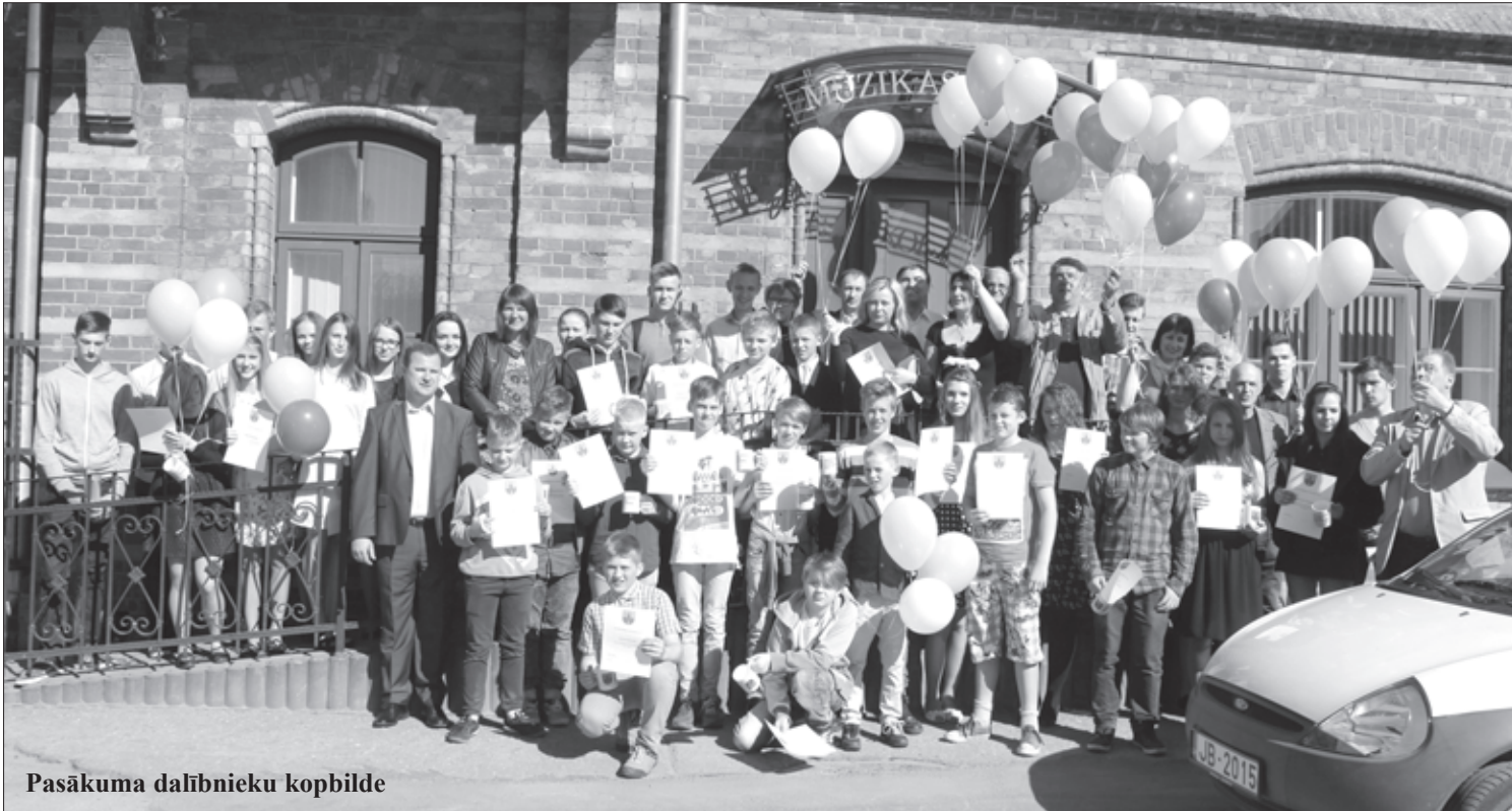
Pasākuma dalībnieku kopbilde