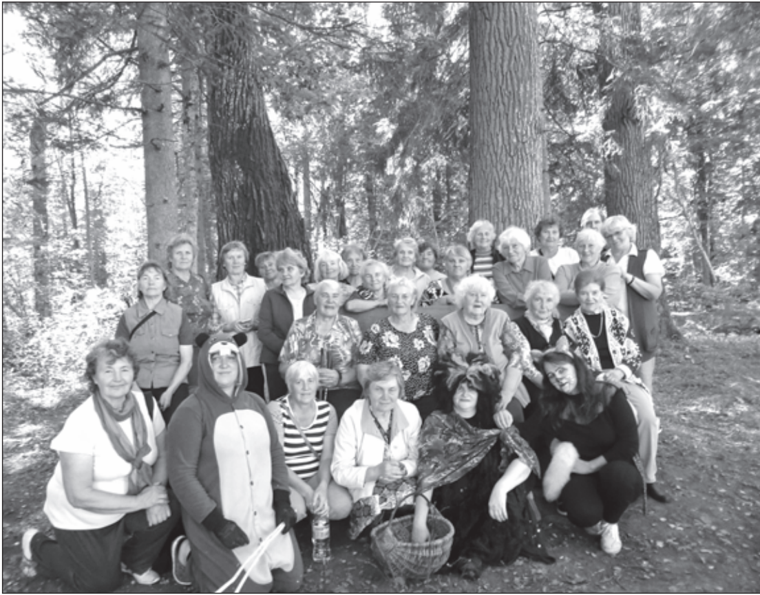
Visi kopā jautrā bariņā

Cīravas Mežaparku jau iepazinuši daudzi - gan mūsu novada ļaudis un apkārtējo skolu audzēkņu grupas, gan ciemiņi no tālākām vietām. Parka izklaides un atrakciju komandas piedāvātās veselīgās aktivitātes priecē jebkura vecuma dabas mīļotājus, ļaujot izbaudīt gan aktīvo atpūtu, gan mūsu dabas parka skaistumu.