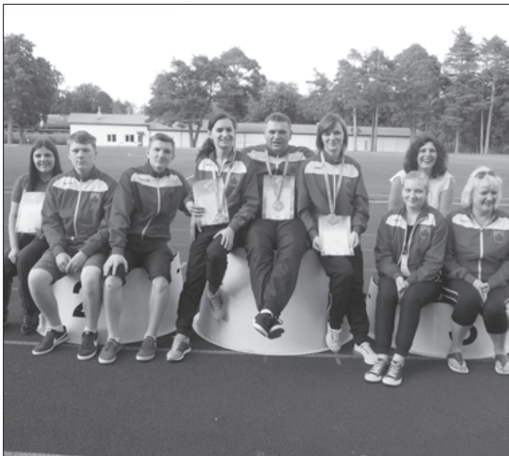
Aizputes novada ložu šaušanas komanda pēc sacensībām ar izcīnītajām medaļām Latvijas IV Olimpiādē

No 8. līdz 9. oktobrim Aizputes novada sporta bāzēs (šautuvē un Sporta centra hallē) risināsies mūsu