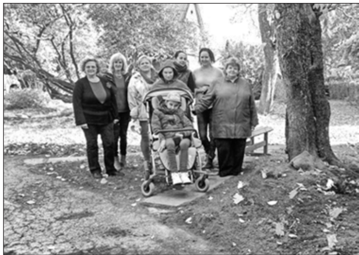
Atbalsta centra dalībnieki kopā ar Rīgas paliatīvās aprūpes biedrības biedriem

Oktobris ir aktīvs laiks, kad īpašus pasākumus organizē Bērnu paliatīvās aprūpes biedrība, atzīmējot Pasaules Hospisa un Paliatīvās aprūpes dienu, lai pievērstu uzmanību neizārstējamu slimu bērnu aprūpei un vajadzībām.