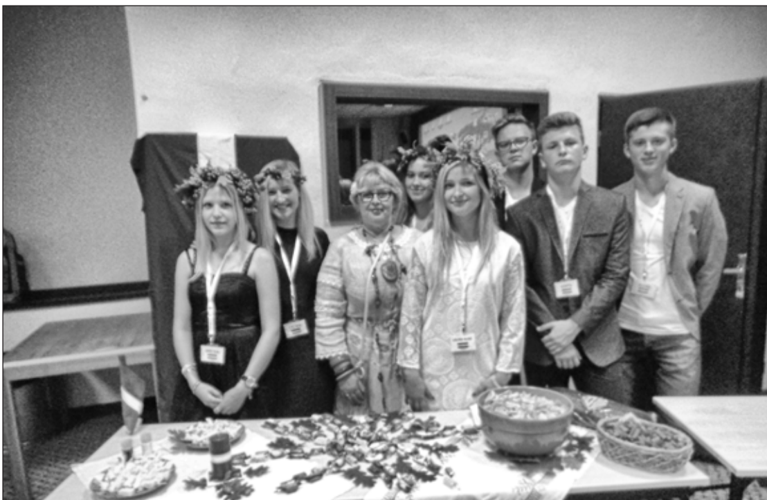
Projekta dalībnieki Stara Lubovnā

Šī gada septembrī septiņiem Aizputes vidusskolēniem bija iespēja piedalīties angļu valodas apmācībās „Project International village” Slovākijā, kur sarunvaloda bija tikai angļu valoda.