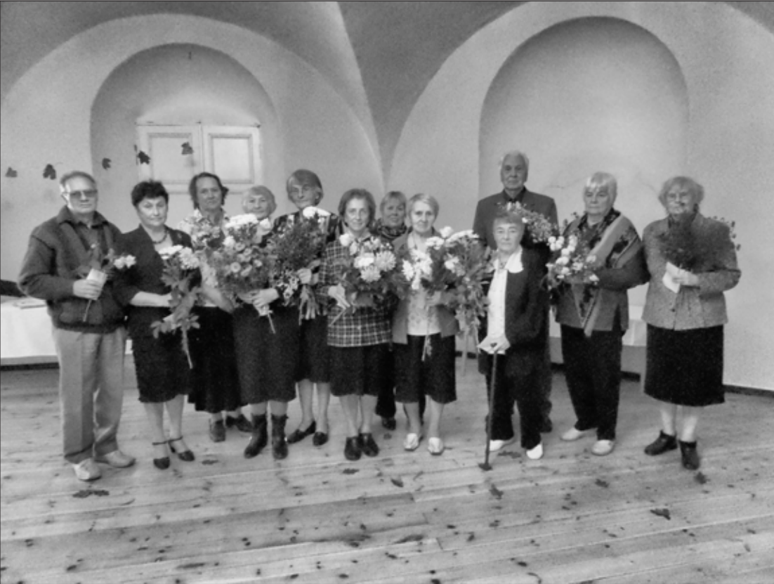
Pasākumā godinātie skolotāji un pirmsskolas darbinieki

Oktobrī, kad rudens lapas krāsojas un dārzos koši greznojas dālijas un asteres, tiek atzīmēta Skolotāju diena. Tā ir svētku diena skolotājiem, un to sirdī jūt ikviens no skolotājiem, vienalga, vai viņš vēl strādā vai nē, un tā ir svētku diena arī skolēniem, kad gribas pateikties savam pirmajam skolotājam, savam mīļākajam skolotājam... Cik bieži mēs pasakām tik vienkāršu vārdu kā "paldies"? Skolotāji, paldies! Mēs novērtējam jūs un jūsu darbu!