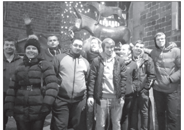
Praktikantu grupa Vācijā

Arī šogad Kandavas Lauksaimniecības tehnikuma Cīravas teritoriālā struktūrvienība pieteica dalību ERASMUS+ projektam. Projekts tika veidots Kandavas Lauksaimniecības tehnikumam un struktūrvienībām Cīravā un Saulainē. Kopējais projekta finansējums ir 133174 eiro. Pavisam kopā projektā iekļautas 6 plūsmas uz 5 dažādām valstīm: Vācija, Portugāle, Apvienotā Karaliste, Spānija un Austrija. Cīrava sevi pārstāvēs Vācijā, Apvienotajā Karalistē un Austrijā.