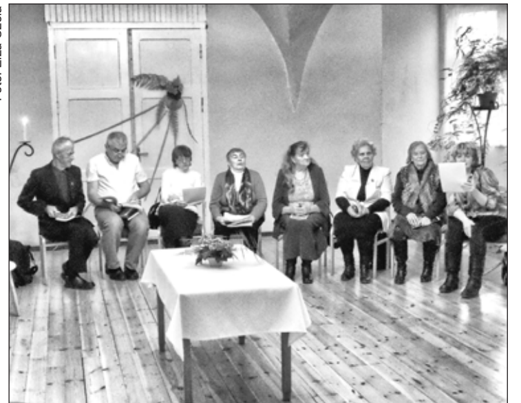
Pasākuma dalībnieki autori-dzejnieki

25. novembra pēcpusdienas mirklī Kazdangas muzejā aizritēja dzejas noskaņās. Pēcpusdienas pasākums “Mirkļis dzejā” pulcēja novada dzejniekus – astoņas radošas personības, kuras vienoja mīlestība uz Latviju, skaistas atmiņas par Kazdangu, prieks un lepnums sveikt Latviju dzimšanas dienā, vēlme priecēt klausītājus ar savu sarakstīto dzeju.