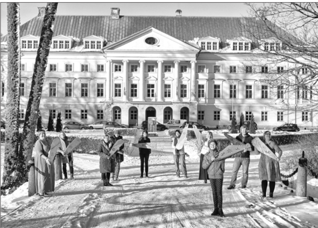
Projekta dalībnieki ar pašu gatavotajām koklēm