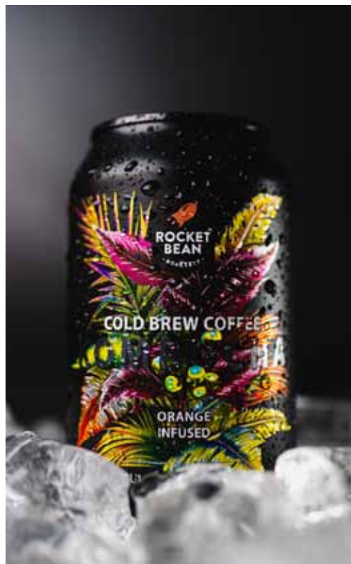
Kuldīgas SIA Rudys Brewing Co kopā ar Rīgas SIA Rocket Bean Roastery radījuši neparastu dzērienu – auksti brūvētas kafijas kombuču.

Rudys Brewing Co ir Kuldīgas biznesa inkuba-