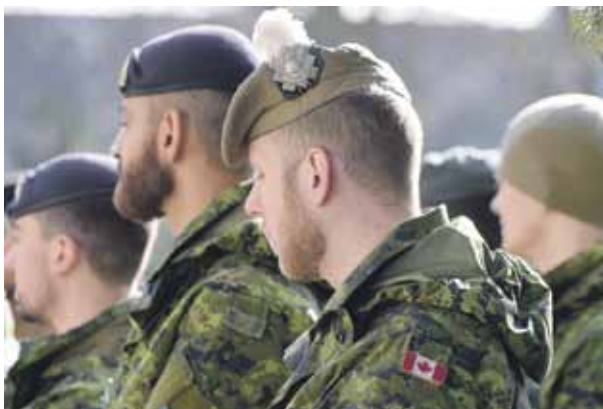
Pārgājienā piedalās arī Latvijas sabiedroto karavīri no Kanādas.