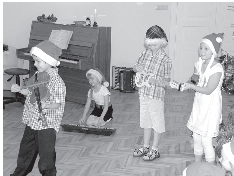
Savu Jaungada svētku programmu viesiem rādīja Buratīno bērni

Kāpēcītis un 3. pirmskolas izglītības iestādes Spārīte telpu atklāšana notika septembra vidū. Projekta mērķis bija veikt Limbažu pirmskolas izglītības iestāžu vienkāršošanu un teritorijas labiekār-