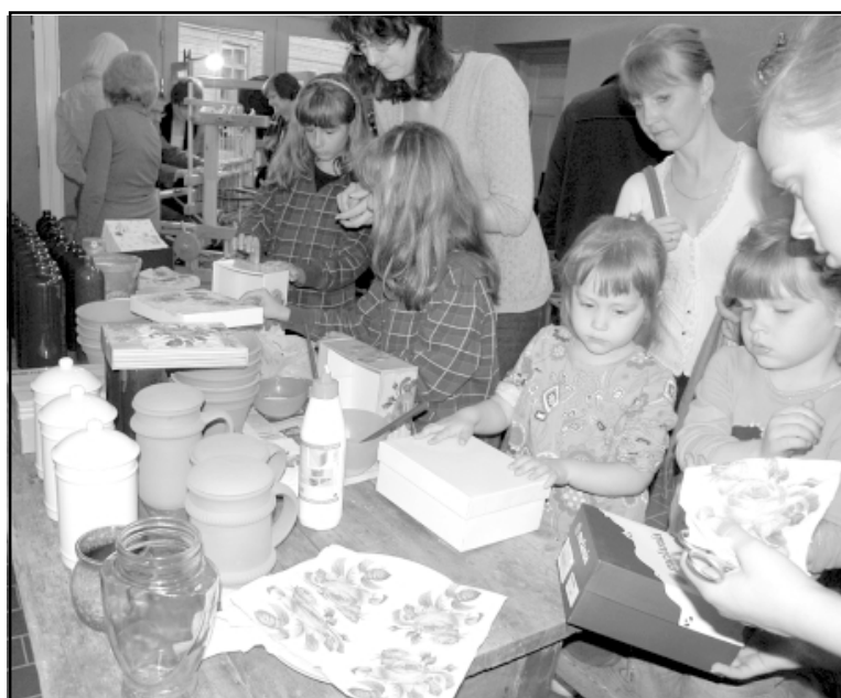
Radošajā darbnīcā top izgreznotas dāvanu kastītes un puķu podi