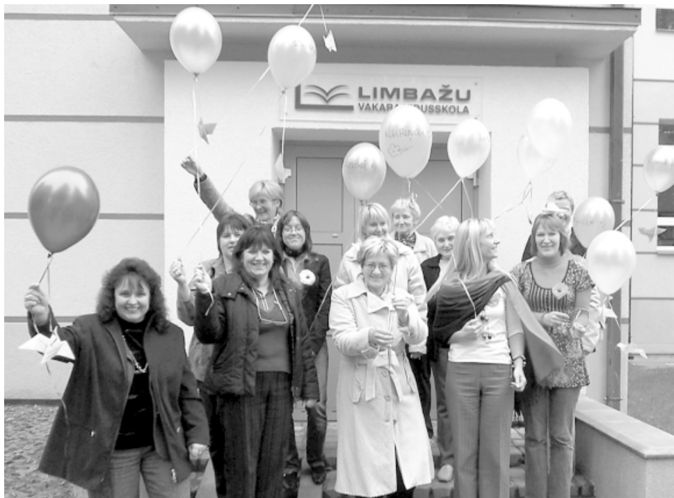
Limbažu Jauniešu un pieaugušo vakara (maiņas) vidusskolas pedagogu kolektīvs

Arvien vairāk ir cilvēku, kuri dažādu iemeslu dēļ izvēlas vai ir spiesti mācīties vakarskolās. Limbažu Jauniešu un pieaugušo vakara (maiņu) vidusskolā mācības atsāk pieaugušie, kas agrāk sociālu, finansiālu vai citu apsvērumu dēļ aizgājuši no skolas un sākuši strādāt. Tagad viņi saprot, ka izglītība nepieciešama plašākam apvērsumam un karjerai. Ir tādi, kas skolas gaitas iekavējuši ģimenes apstākļu dēļ, agri kļūstot par vecākiem. Vakarskolā var sastapt arī topošas un jaunās māmiņas. Ar lielu prieku klausos, kā klases audzinātājas kļuvušas par krustmātēm. Viss skolas kolektīvs priecājas par ikvienu mazuli. Pie mums mācās arī arodskolu beidzēji, kuri vēlas iegūt vispārējo vidējo izglītību.