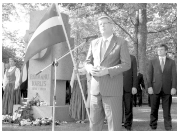
Prezidents uzrunā tautu: - Himna jādzied no pilnas krūts un skaļi, jo tikai tad tā kļūst maģiska un aizraidīs ienaidniekus

Baumaņu Kārļa 175. jubileja tika aizvadīta sirsnīgā un tautiskā gaisotnē. Cieņu pret valsti himnu un tās autoru šajā dienā izrādīja ikviens viļķenietis - pie katras mājas lepmi plīvoja sarkanbaltsarkanais karogs.