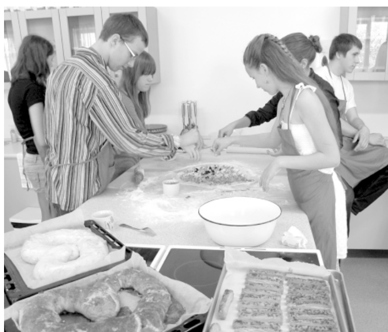
Skolēni radošajā darbnīcā apgūst kliņģeru gatavošanas prasmi